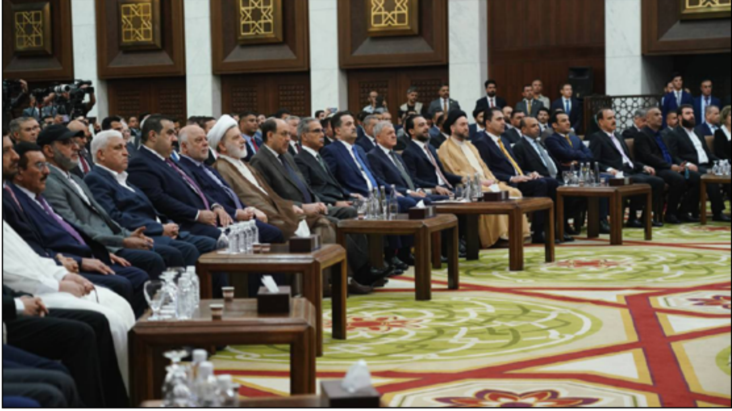
لحفاة اقامها الاطار التنسيقي يوم أمس بمناسبة عيد الغدير

في وقت يضع فيه الإطار التنسيقي ملامح المرحلة المقبلة وإدارة المحافظات تصرح طهران الأخير للمرة الثانية في غضون أشهر، باحتمال علاقتها باستهداف اجانب في العراق. وبدأ «الإطار» والجهاز التنفيذي يصعدان ضد مجموعة سياسية بالتزامن مع استعدادات اجراء الانتخابات المحلية المفترضة قبل نهاية العام الحالي. يجري ذلك بالتزامن مع انطلاق سلسلة من التغييرات في المناصب، يعتقد انها ستتوسع، وسط شكوك باحتمال وجود دوافع سياسية وراء استهداف بعض الشخصيات. وتحدث الترتيبات الجديدة وفق تفاهات في داخل «ائتلاف ادارة الدولة»، الذي ينوي اراحة بعض الاطراف او اضعافها على الاقل، خلال الفترة المقبلة. ولا يستبعد ان يكون الامر متعلقا بالشراكة القديمة التي كانت بين زعيم التيار الصدري مقتدى الصدر وبعض القوى السنية والكردية في نية قطع الطريق امام عودة التحالف الثلاثي. ما يعكس التسويات الجديدة، بحسب اوساط الإطار التنسيقي، هو الكشف عن اختطاف مواطنة روسية-اسرائيلية في