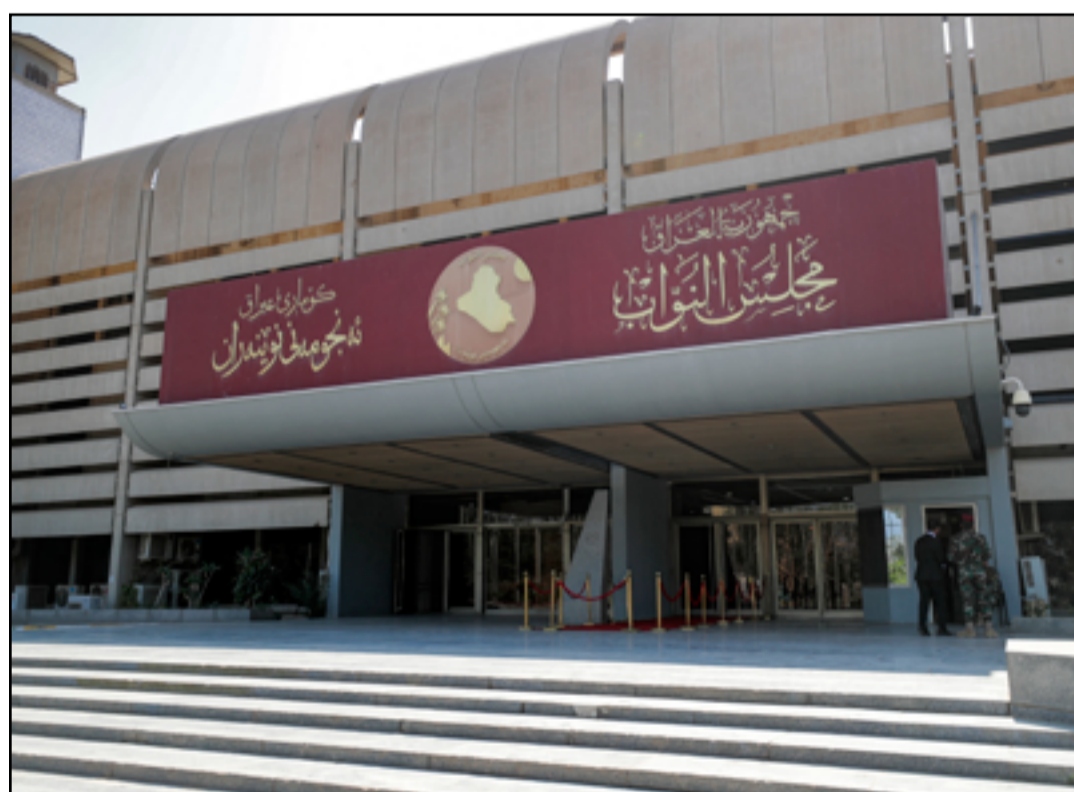
مبنى مجلس النواب

ولفت، إلى أن «المادة 376 من ذات القانون عاقبت بالسجن 7 سنوات على العقود الباطلة في عقود الزواج، وأيضاً المواد 401 وما بعدها وما يتعلق بهتك الحياء العرضي، وأيضاً المادة 3 من قانون الأحوال الشخصية وضعت شروط العقد ومثل هذه الجرائم تخالف ذلك.»