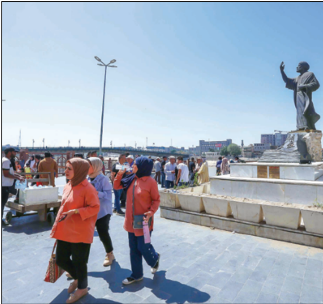
رم ارتفاع درجات الحرارة تواجدهم مكثف لرواد شارع المتنبي..