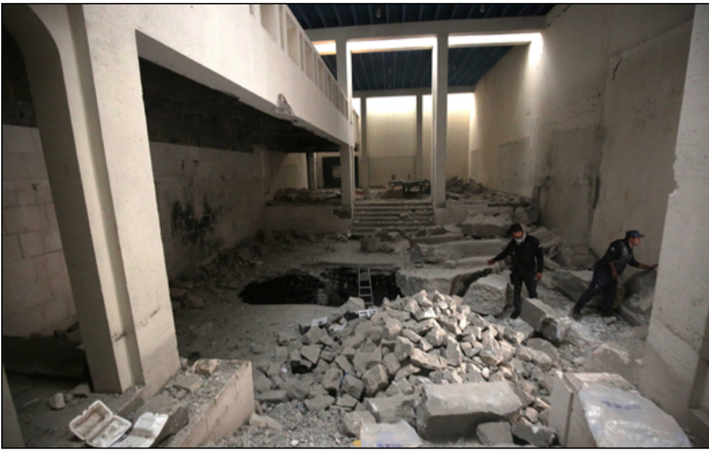
دمار كبير خلفه داعش في متحف الموصل