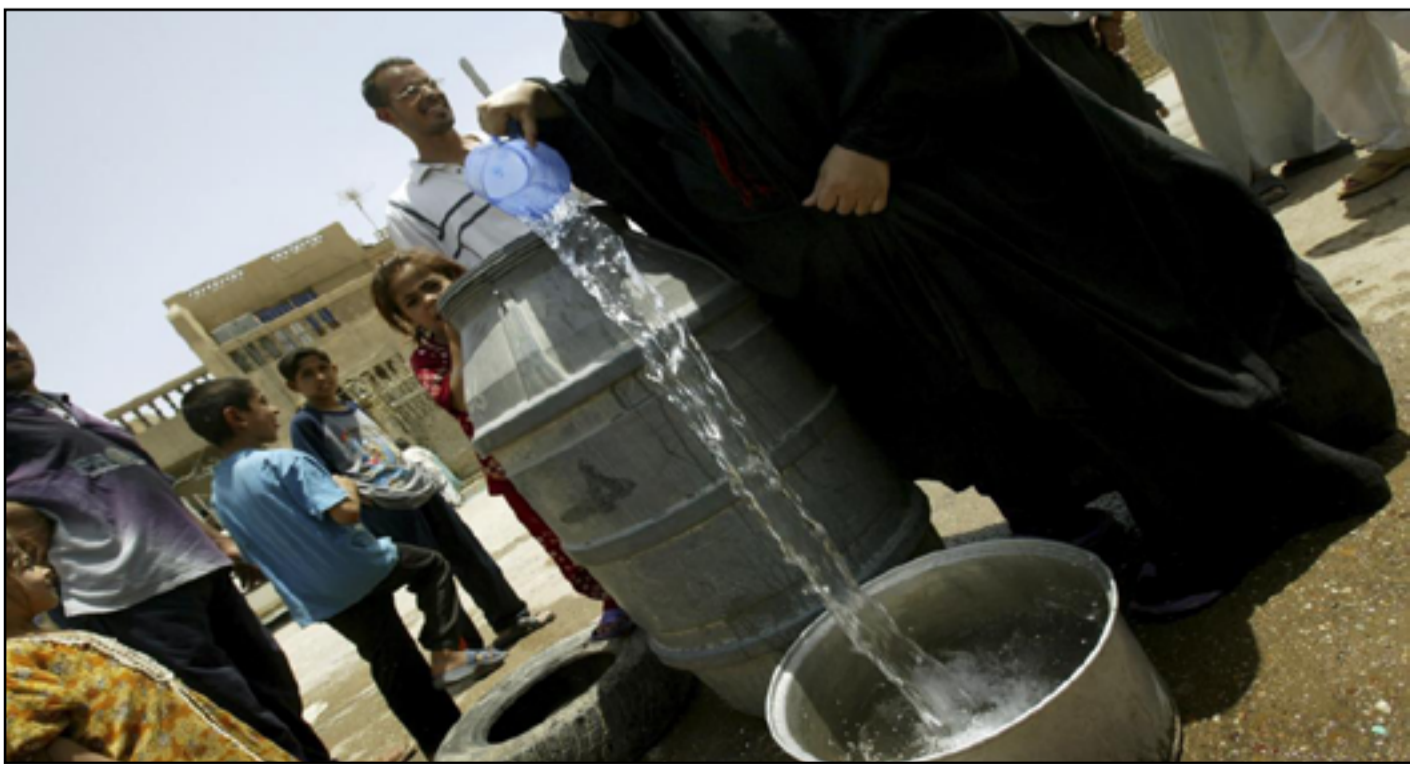
استمرار المخاوف من حدوث أزمة في مياه الشرب رغم التطمينات الحكومية