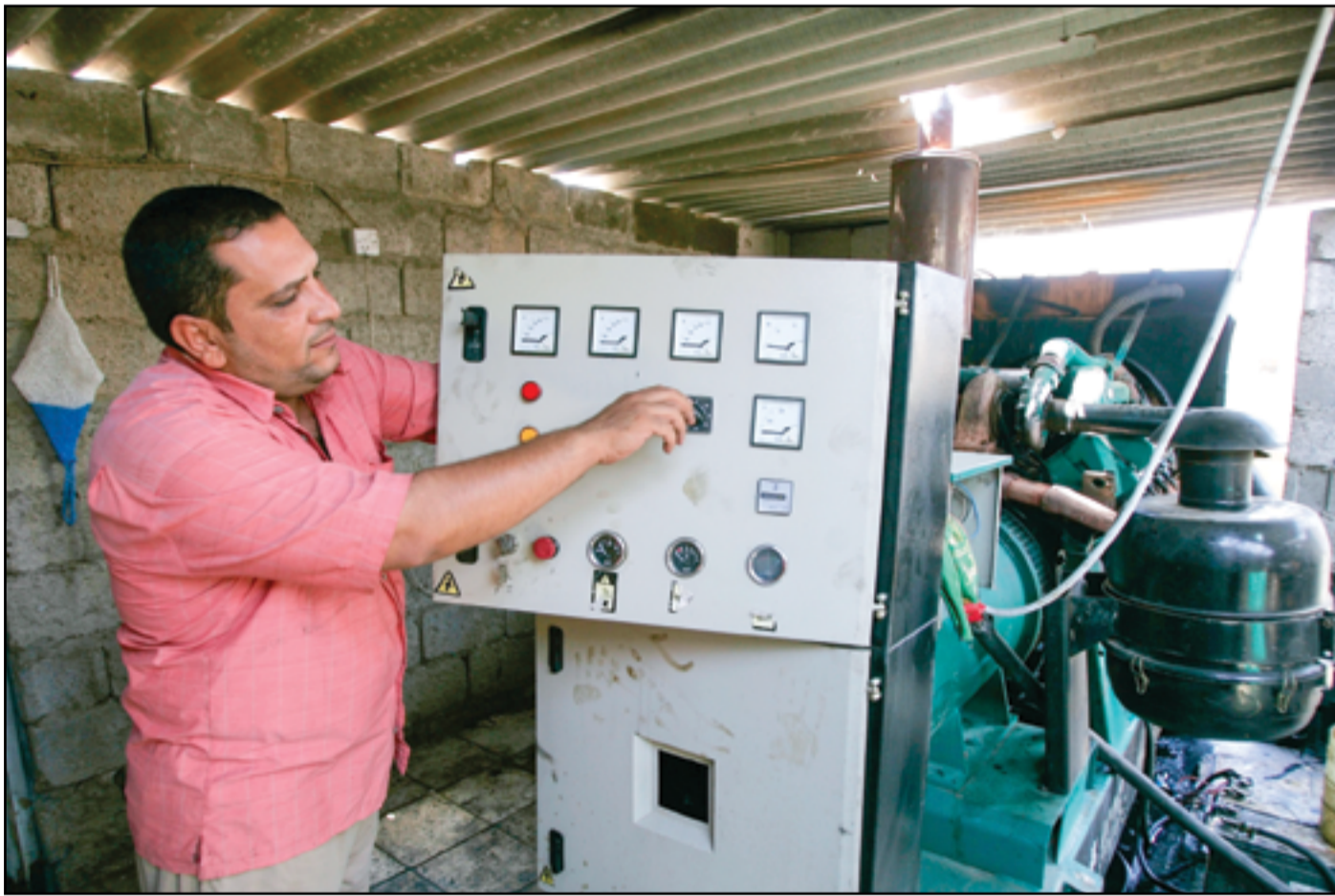
أصحاب المولدات الأهلية يشكون قلة تزويدهم بالوقود...