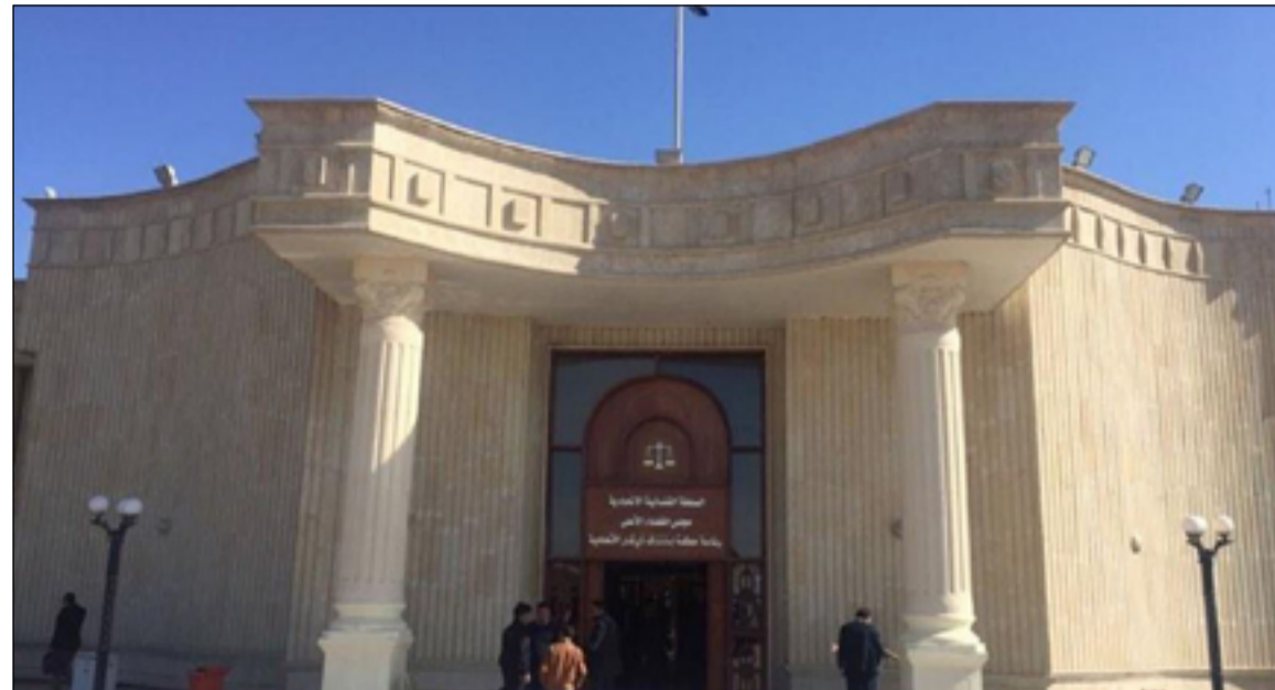
مبنى محكمة استئناف ذي قار