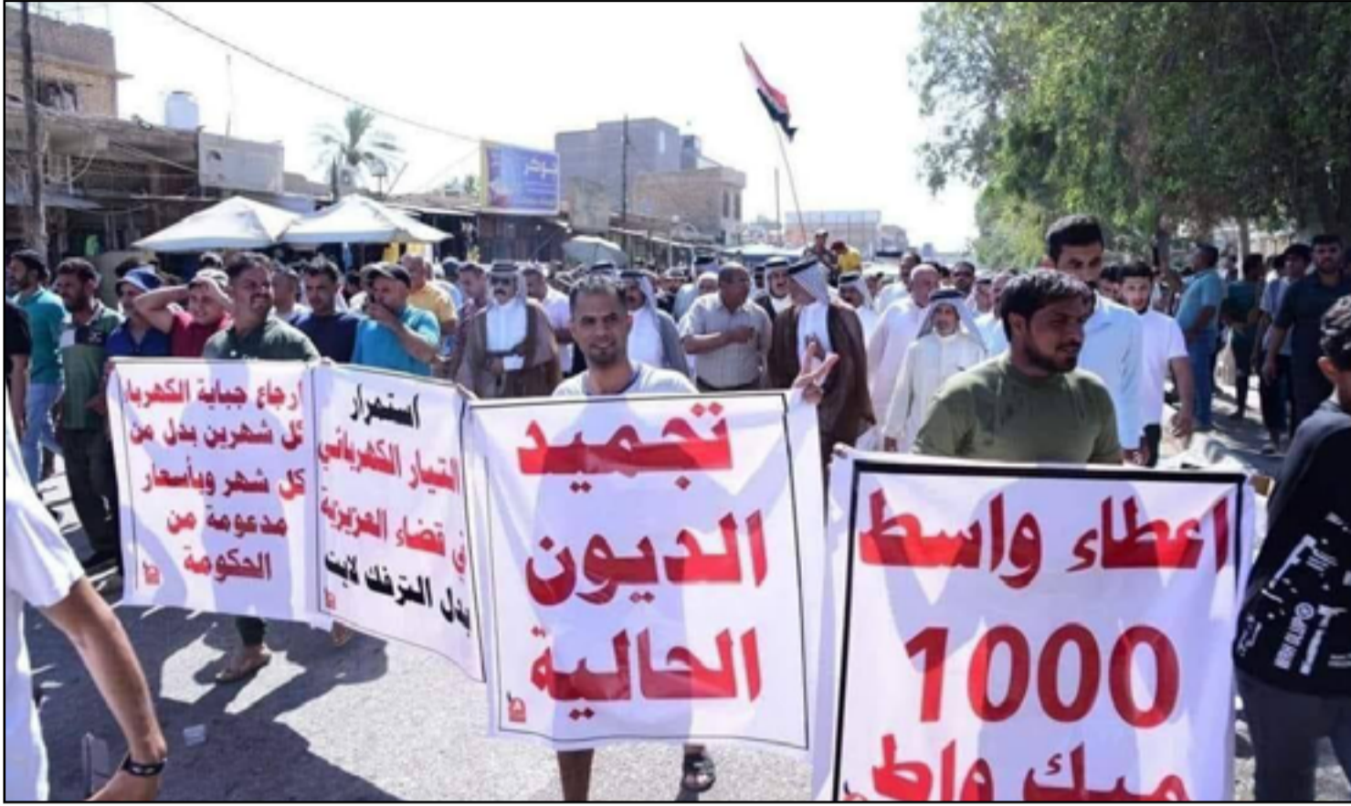
تظاهرة في قضاء العزيزية بمحافظة واسط تطلب بتحسين وضع الكهرباء

■ أهالي بعض المناطق بدأوا يخرجون في احتجاجات على تراجع ساعات التجهيز