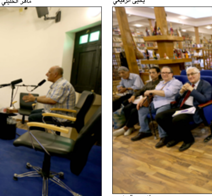
اجتماع بيت المدى في شارع المنتبي، أمس الأول الجمعة، جلسة احتفاء واستذكار لثورة 14 تموز