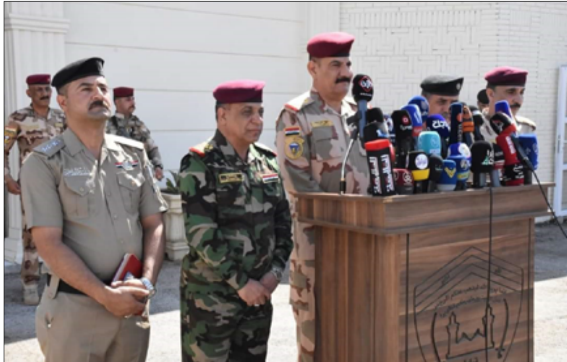
المؤتمر الصحفي للقيادة الأمنية في كربلاء

ولغت زويني، الى أن "هناك فعاليات ستكون لهذه القطاعات، سيقفها عمليات قبل ٥ أيام وتستمر حتى الثامن من شهر محرم الحرام، وحققت نتائج جيدة، وهي