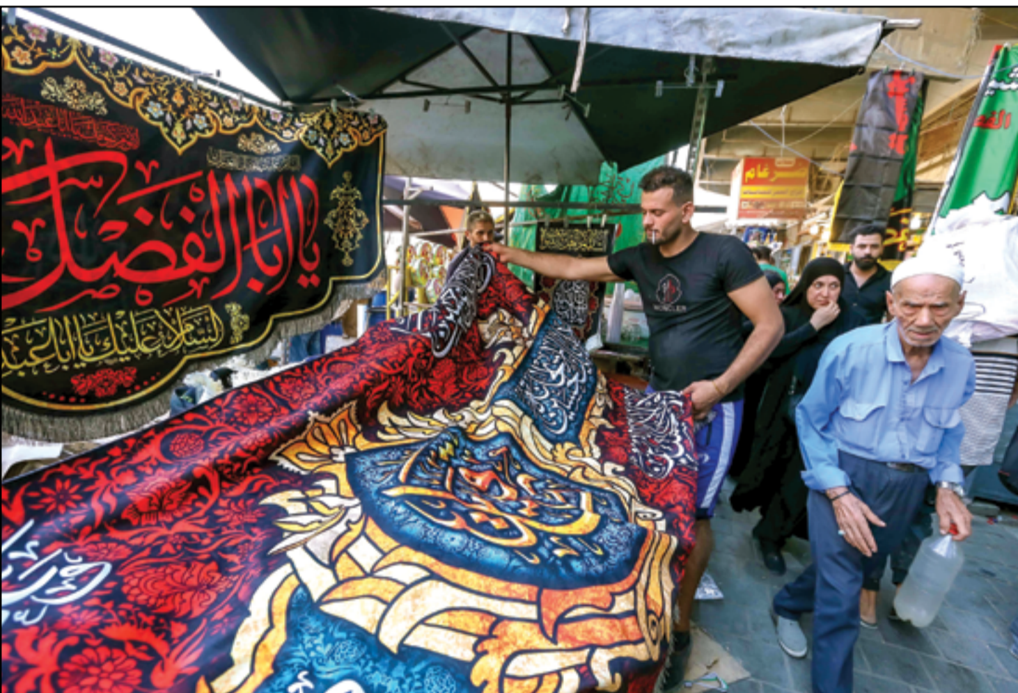
اقبال على شراء الرايات والصور الحسينية استعداداً لشهر محرم الحرام...