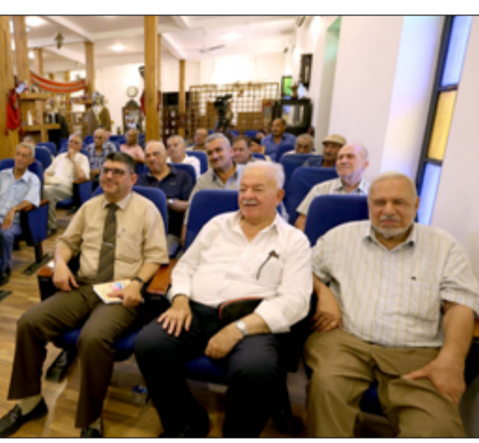
اجتماع بيت المدى في شارع المنتبي، أمس الأول الجمعة، جلسة احتفاء واستذكار لثورة 14 تموز