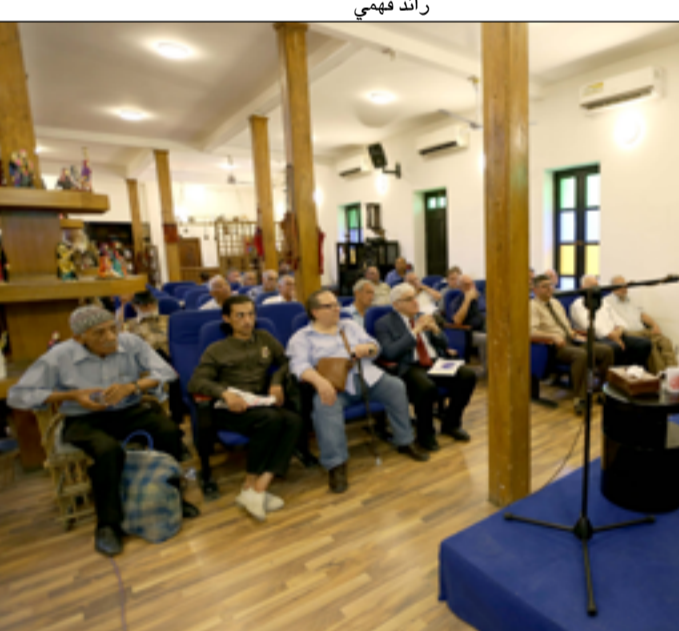
اجتماع بيت المدى في شارع المنتبي، أمس الأول الجمعة، جلسة احتفاء واستذكار لثورة 14 تموز