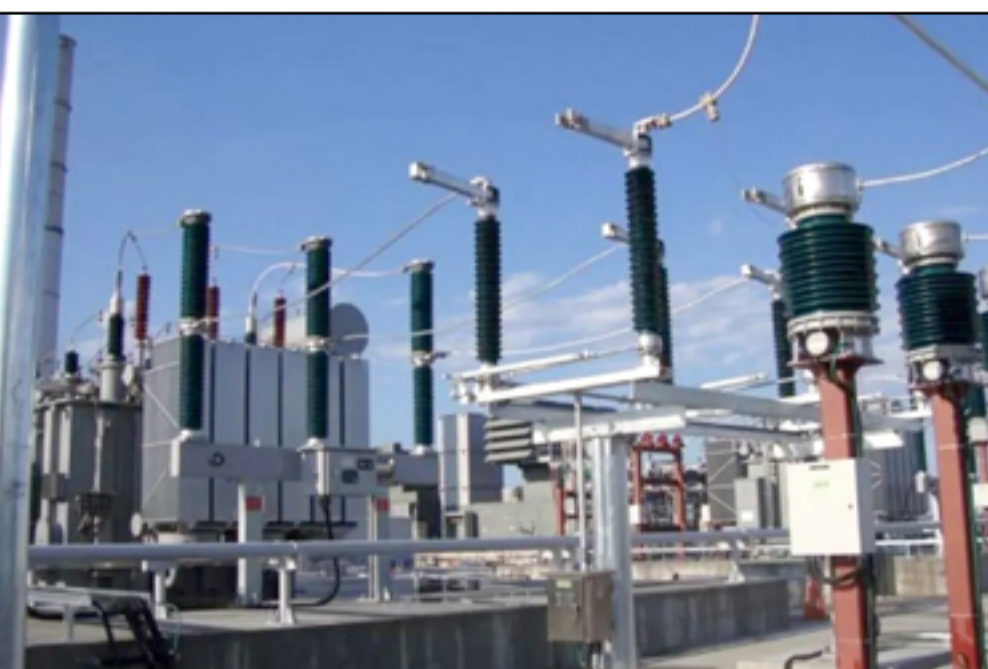
العديد من محطات الكهرباء، متوقفة بسبب نقص الغاز المشغل

في هذه الاثناء تقوم وزيرة الخزانة الأميركية حاليا بزيارة لبكين. وتواجه وزيرة الخزانة، جانيت يلين، مهمة