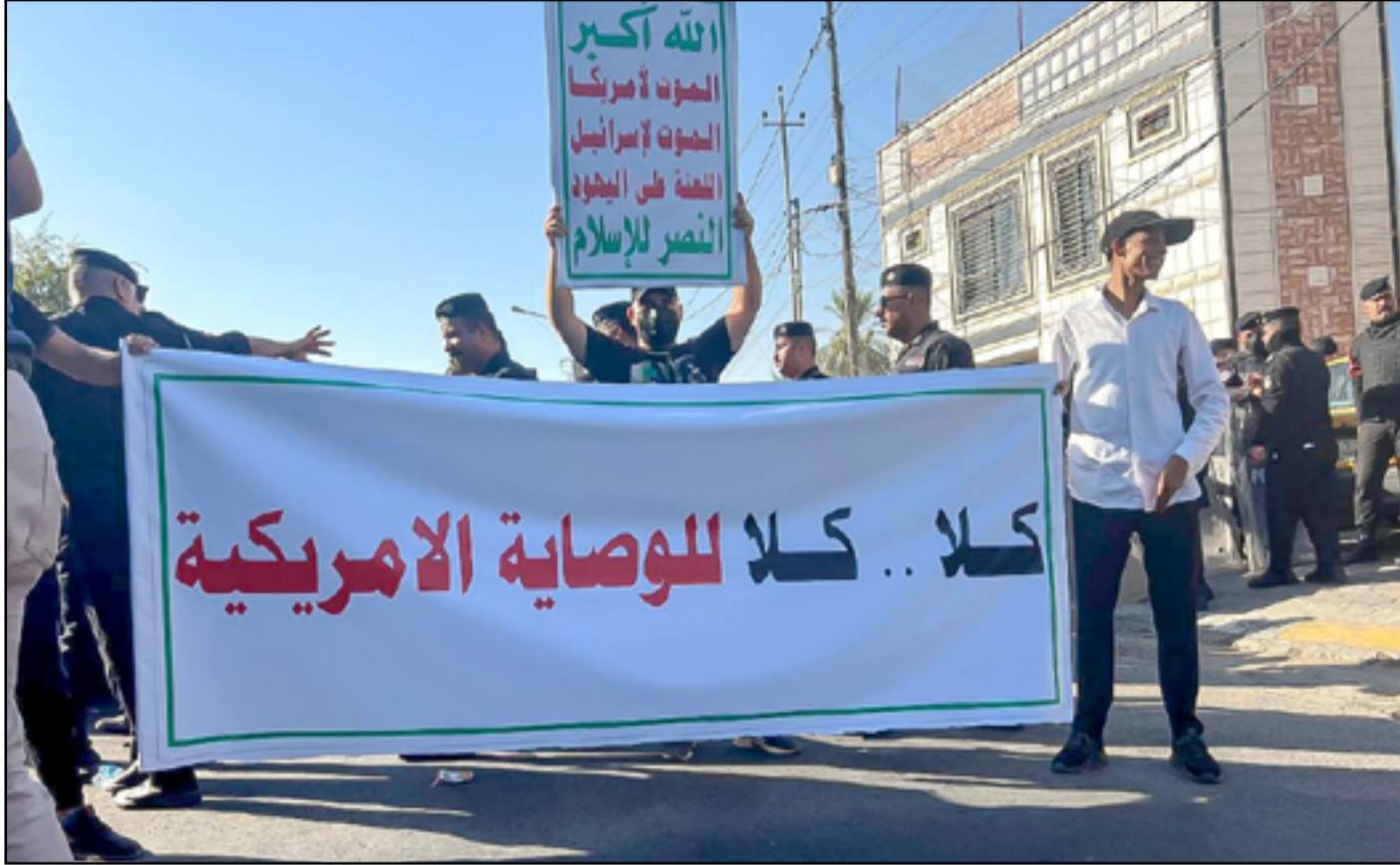
تظاهرات أمام المنطقة الخضراء أمس الأول تندد بالولايات المتحدة الأميركية

وفي هذا الشأن كشفت مفوضية الانتخابات، تسجيل «9 تحالفات» بينها 7 جديدة، حتى الآن، استعدادا للانتخابات. وقالت جمانة غلاي المتحدث باسم