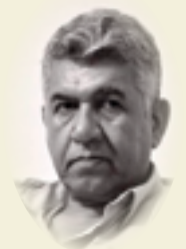
طالب عبد العزيز

حين فقد خورخي لويس بورخيس بصره قال: «الآن يمكنني أن أعيش أحلامي بإلهاء أقل» قال ذلك لأن الحياة لم تعد تملك إلا القليل من المتع له، ففاقد البصر تتشخ أو تنعدم متعّه. أنا، لم أفقد بصري، بعد، ومازلت أرى في السماء الكثير من فسيفساء وزخرف منارة السراجي، وكانني أتفرس بعيني هذه مجلس شيوخ واعيان بيت الملا طه وبيت الحاج صالح العرب (الأول من السنة والثاني من الشيعة) ومن انضم إلى مجلسهم، وصارت المنارة تظللهم، وهم ينفقون تحت حائط المسجد أضحيان وأمسيات أعمارهم، منذ ثلاثة قرون ونيف.