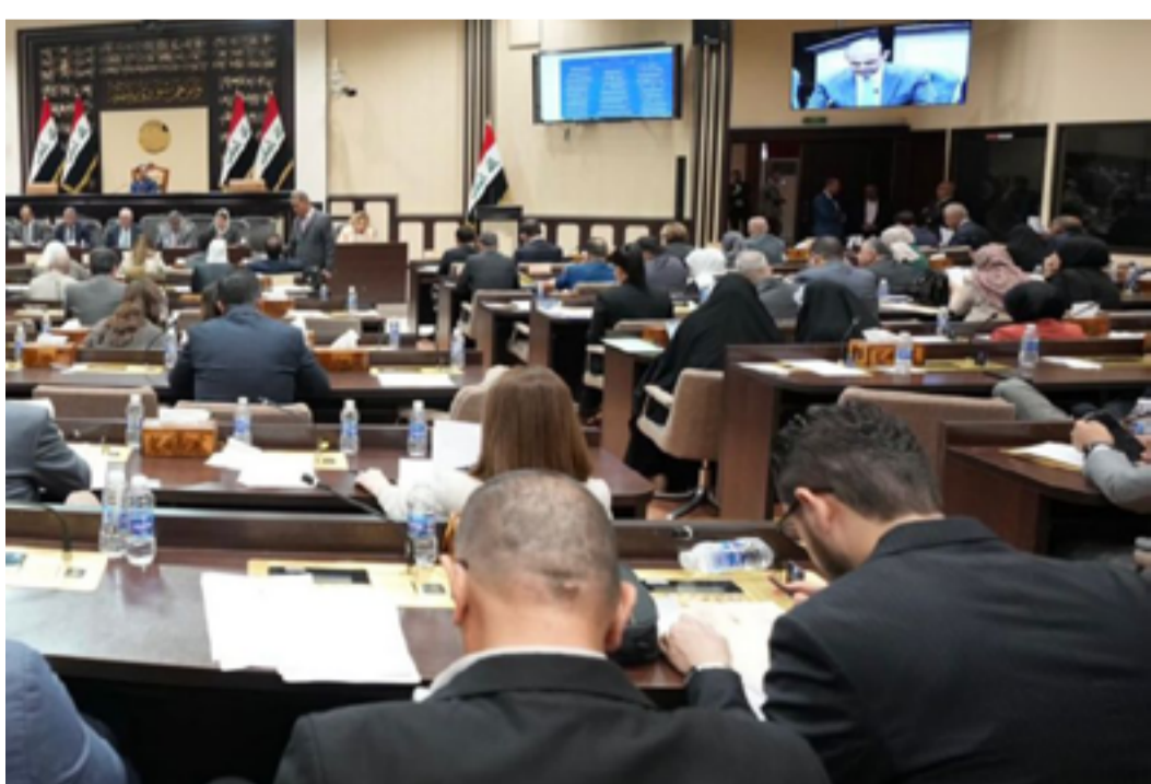
جلسة البرلمان ليوم أمس السبت