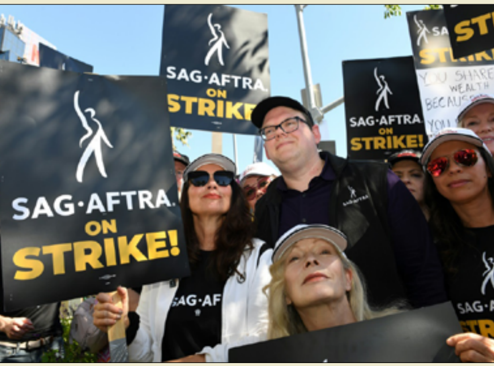
اجتماع بيت المدى في شارع المنتبي، أمس الأول الجمعة، جلسة احتفاء واستذكار لثورة 14 تموز

انطلق الإضراب التاريخي لممثلي هوليوود بزخم أمس الاول الجمعة، ونظم هؤلاء تجمعات أمام استوديوهات لوس أنجلوس، وفيما تركزت حفنة من النجوم على الأرصفة، راحت السيارات المارة تطلق أبواقها تعبيراً عن التضامن، فيما انصب جزء كبير من غضب المحتجين على رئيس «ديزني» بوب أيغر.