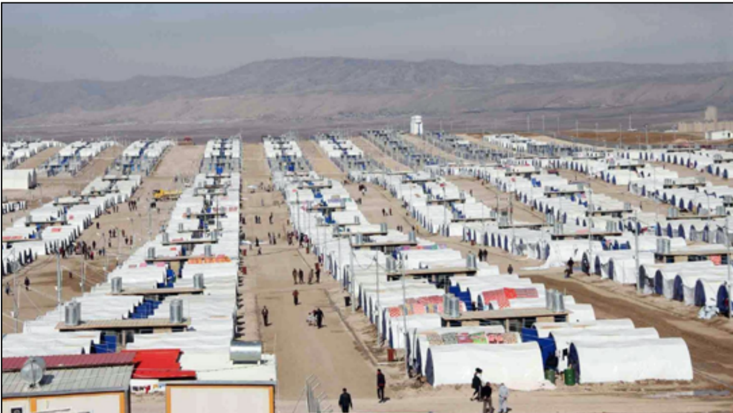
محطات النازحين في اقليم كردستان