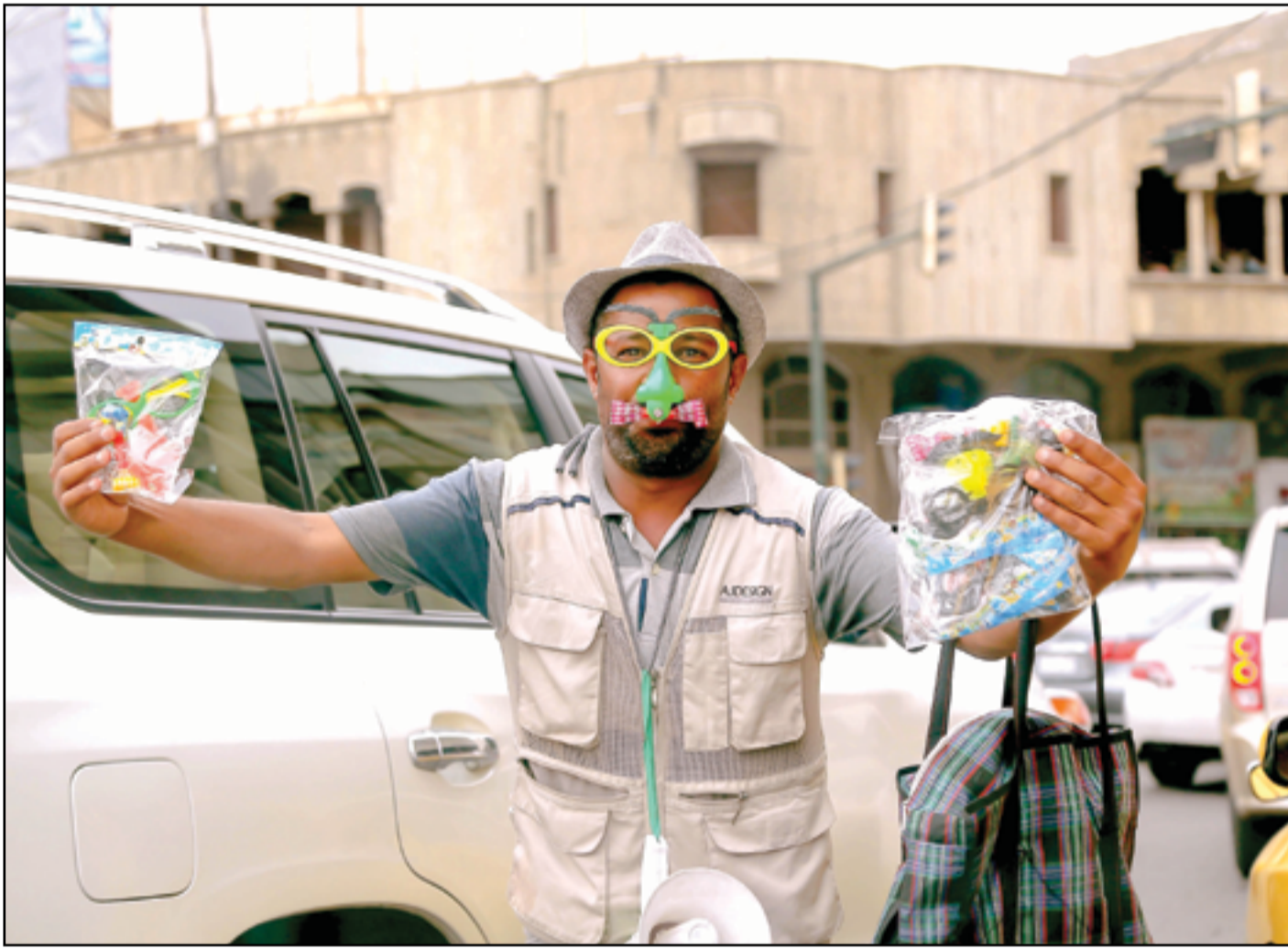
باتع لعب أطفال متجول في بغداد...

الدائم في مختلف القضايا السياسية إضافة إلى الجهود المشتركة في محاربة الإرهاب". وقال السوداني خلال مؤتمر صحفي مشترك مع الأسد، تابعته (المدى)، إن "العراق وسوريا مترابطان تاريخياً واجتماعياً وجغرافياً، والأمن والاستقرار يدفعان بالبلدين نحو المزيد من التعاون والتنسيق لمواجهة كل المخاطر والتحديات". التفاصيل ص 2