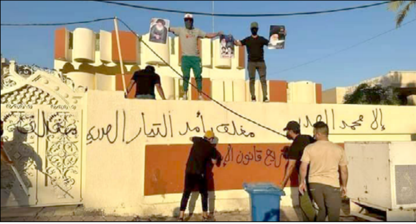
انصار التيار الصدري يغلقون مقرات لحزب الدعوة

وفيما يبدو وكأنه نداء الى جمهوره بعدم الاستمرار في التصعيد، قال الصدر: "أملاً منهم أن يعطوا الفرصة لمن بقي من