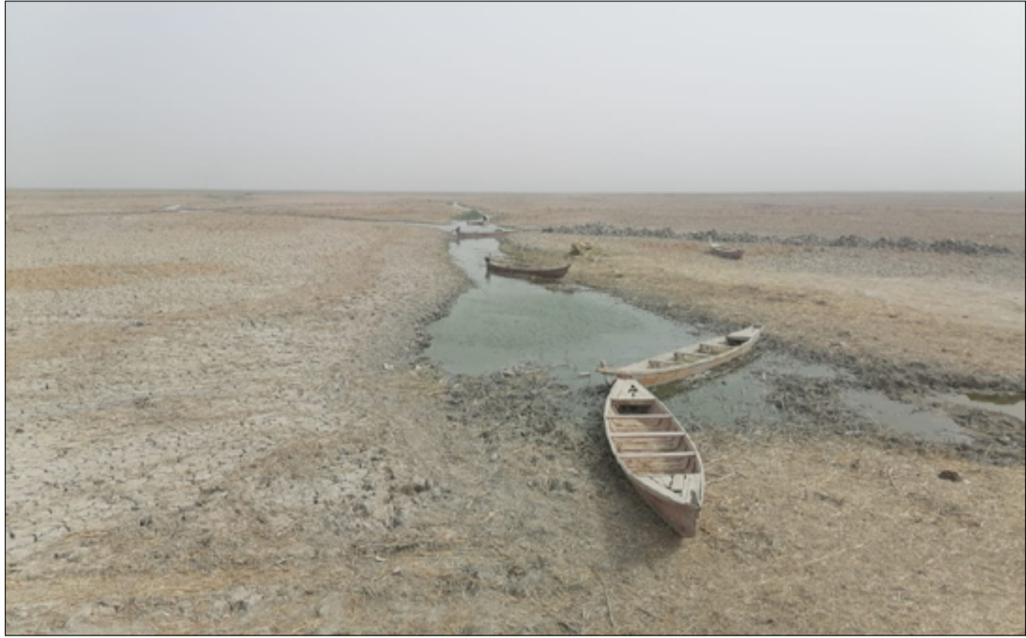
استمرار المخاوف من تفاقم أزمة الجفاف في الاهوار

وتشكل الاهوار خمس مساحة محافظة ذي قار وهي تتوزع على عشر وحدات إدارية من أصل ٢٠ تضمها المحافظة، إذ تقدر مساحة اهوار الناصرية قبل تجفيفها مطلع تسعينيات القرن الماضي، بـ٤٨ ألف دونم، في حين تبلغ المساحة التي أعيد عمرها بالمياه بعد عام ٢٠٠٣ نحو ٥٠ بالمئة من مجمل المساحة الكلية لاهوار الناصرية، إلا أن هذه المساحة المغمورة سرعان ما تقلص بصورة كبيرة بعد كل أزمة مياه تمر بها البلاد.