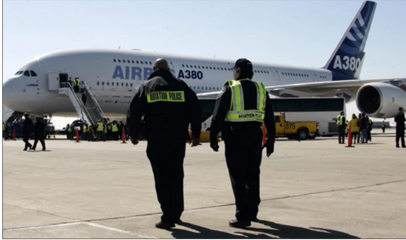
عناصر من شرطة المطارات الأميركية يقفان قرب إحدى الطائرات