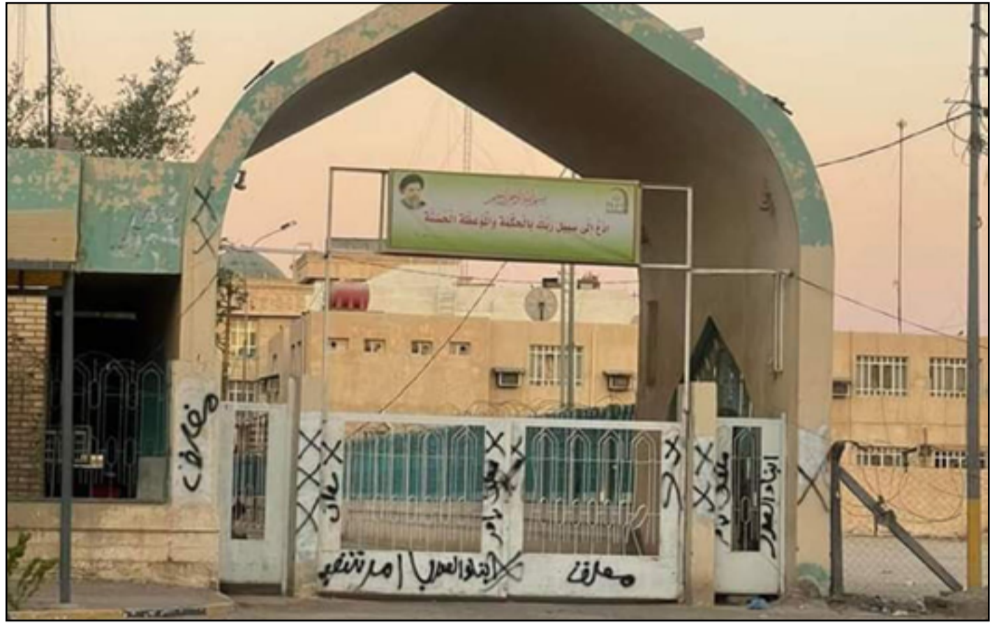
لحد مقرات حزب الدعوة بعد أن اغلقه انصار التيار الصدري