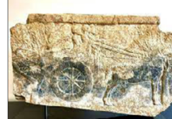
أشخاص محافظين بأشجار النخيل. ووفق البيان، يبلغ طول القطعة ٦٤ سنتيمتراً وارتفاعها ٤١ سنتيمتراً وسُمكها تسعة

سنتيمترات وتقف على قاعدة معدنية. وثمان القائم بالأعمال العراقي الجهود التي تبذلها الهيئة المتخصصة للنقل الدولي للممتلكات الثقافية التابعة للبعثة العراقية، مشيراً إلى أن إعادة القطعة الأثرية تمثل إنجازاً كبيراً له أهمية عميقة لتاريخ العراق وتراثه الحضاري.