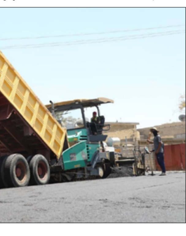
جانب من حملة تليط الشوارع في قضاء الزوراء

ونقل البيان عن العطا قوله إن "الطريق الأول سيبدأ من منطقة مقالع النبايعي وهو مخصص للمركبات المحملة بالمواد الإنشائية". وتابع العطا، ان "الطريق الثاني يبدأ من سامراء (منطقة ناظم الثرثار) للسيارات القادمة من الشمال المحملة بالبضائع الأخرى، وصولاً إلى طرق أخرى بالتنسيق مع الجهات المعنية".