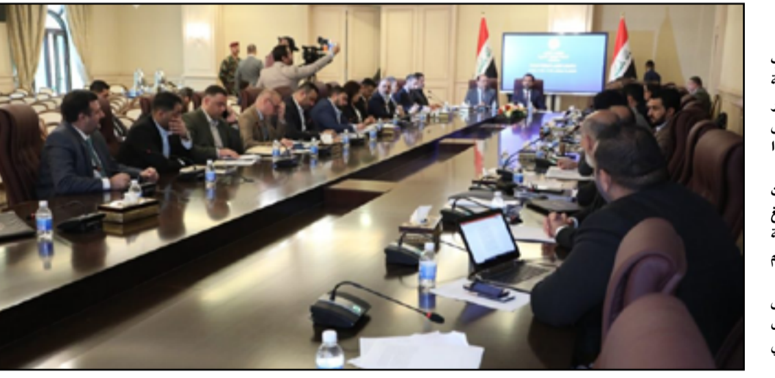
من اجتماعات اللجنة المالية المخصصة للموازنة

أقام أعضاء جمعية، أوقفوا إيداء أبناء الايغور، المدافعة عن حقوق الأقلية المسلمة في الصين والتي تتخذ من المملكة المتحدة مقرا لها حملة احتجاج خارج مبنى السفارة الصينية وذلك بمناسبة الذكرى 14 لمذبحة أورومتشي ضد مسلمي الايغور. وشجب المحتجون استمرار الصين باضطهاد وتعذيب أبناء الايغور من الأقلية المسلمة في الصين. وكتبت جمعية، أوقفوا إيداء أبناء الايغور، في تعليق لها على تويتر بتاريخ 5 تموز أن "الأحداث المأساوية التي انكشفت خلال مجزرة أورومتشي التي وقعت قبل 14 عاما كانت بمثابة نقطة تحول في الاعمال الوحشية المفرطة التي نتجت عنها ضحايا من أبناء اقلية الايغور من المسلمين واستخدام السلطات الصينية سياسات الإبادة الجماعية ضدهم". رحمة محمود، المديرة التنفيذية لجمعية أوقفوا إيداء أبناء الايغور، قالت "اليوم تحل الذكرى السنوية الرابعة عشر للأحداث المأساوية التي وقعت في أورومتشي، حيث ردت الحكومة الصينية على احتجاجات سلمية في حينها بإجراءات قمعية قاسية تخللها استخدام قوة الشرطة وقوات الجيش واستخدام ذخيرة حية".