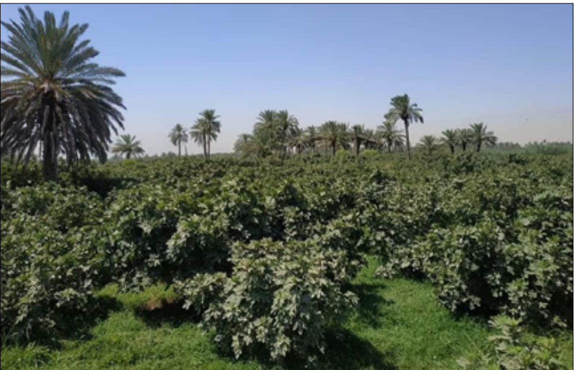
اشجار التين في محافظة بابل

وأضاف، أن "المزارعين يشاهدون نهر الفرات مليئاً بالمياه فيتوقعون أن هذه المياه لبابل فقط في حين أن هناك محافظات تشترك معنا بهذه الكميات ولا يمكن التجاوز عليها".