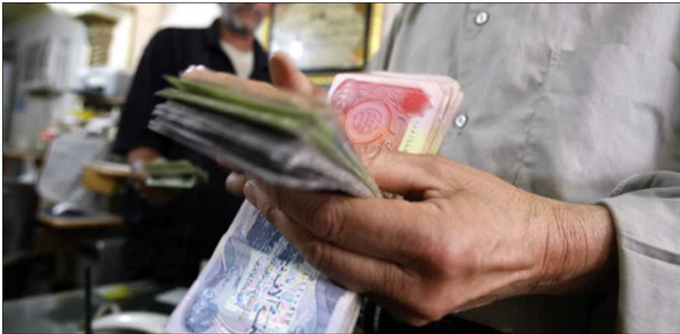
اعداد كبيرة من العراقيين يعتمدون في دخلهم على رواتب الحكومة

وكانت وزارة الخزانة الأميركية منعت أربعة بنوك عراقية أخرى من الوصول إلى الدولار في تشرين الثاني/نوفمبر الماضي، وكذلك فرضت بالتعاون مع البنك المركزي العراقي ضوابط أكثر صرامة على التحويلات المالية في البلاد بشكل عام.