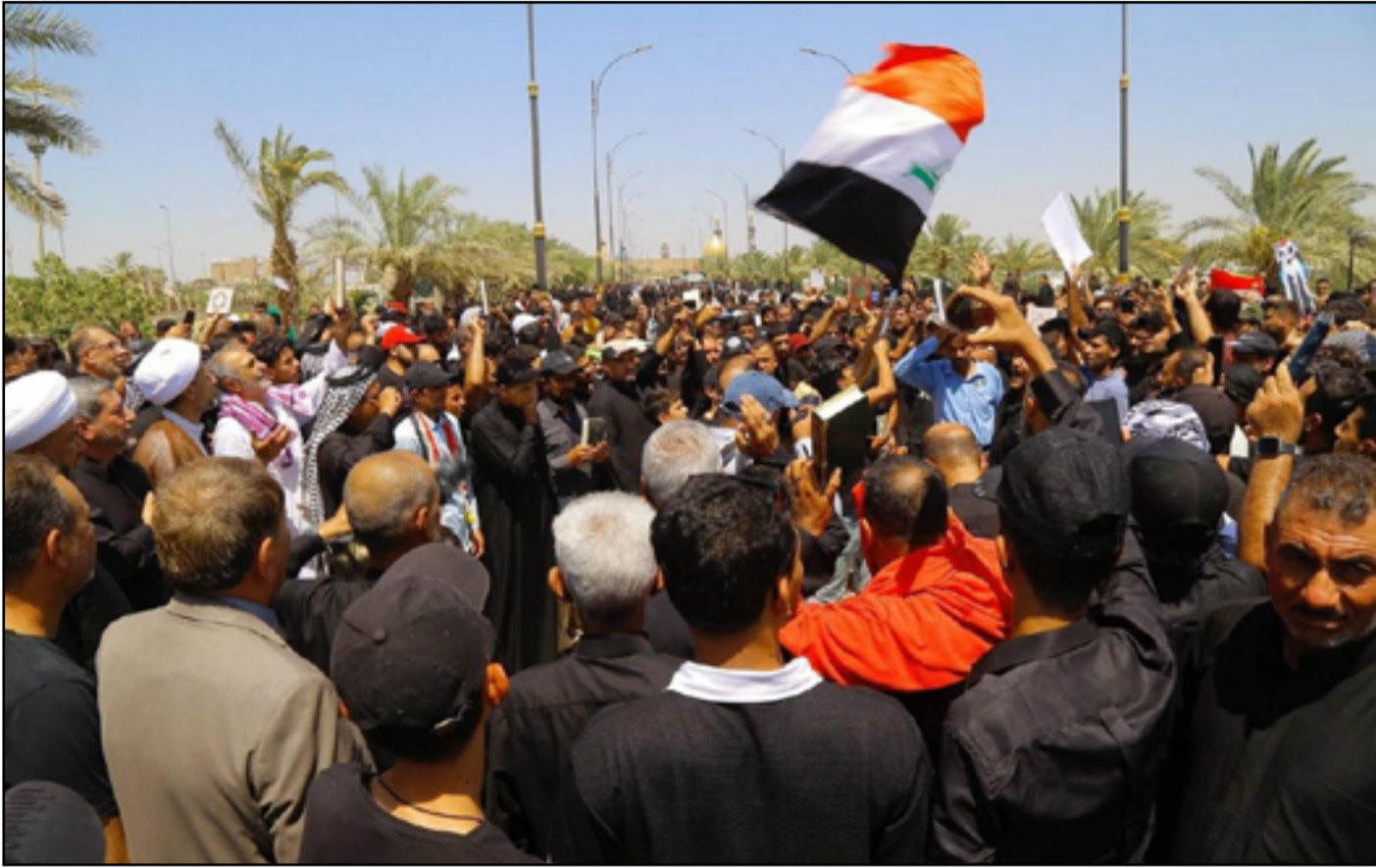
تظاهرات لانصار الصدر في الكوفة تنديداً بالاساءة إلى المصحف الشريف والعلم العراقي