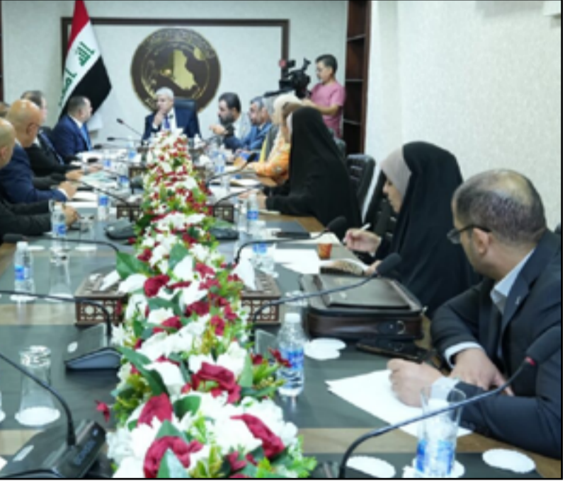
استضافة وزير الكهرباء، في لجنة الطاقة النيابية الاسبوع الماضي