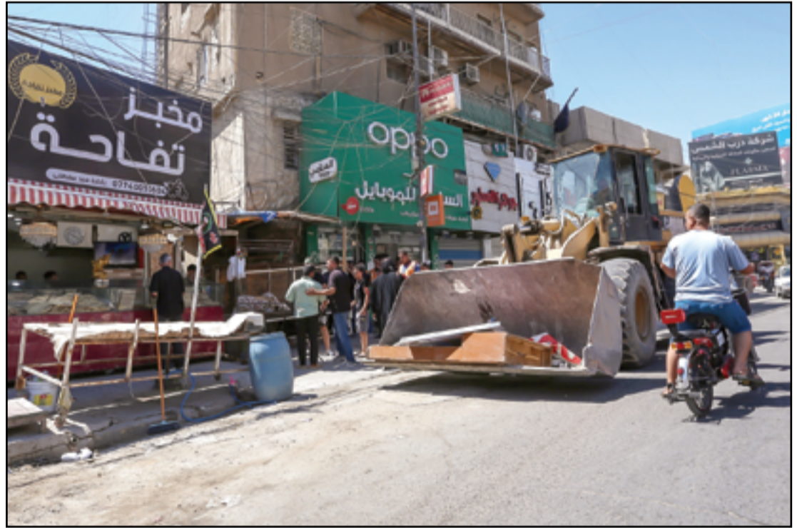
استمرار حملات إزالة التجاوزات في منطقة الكرادة..