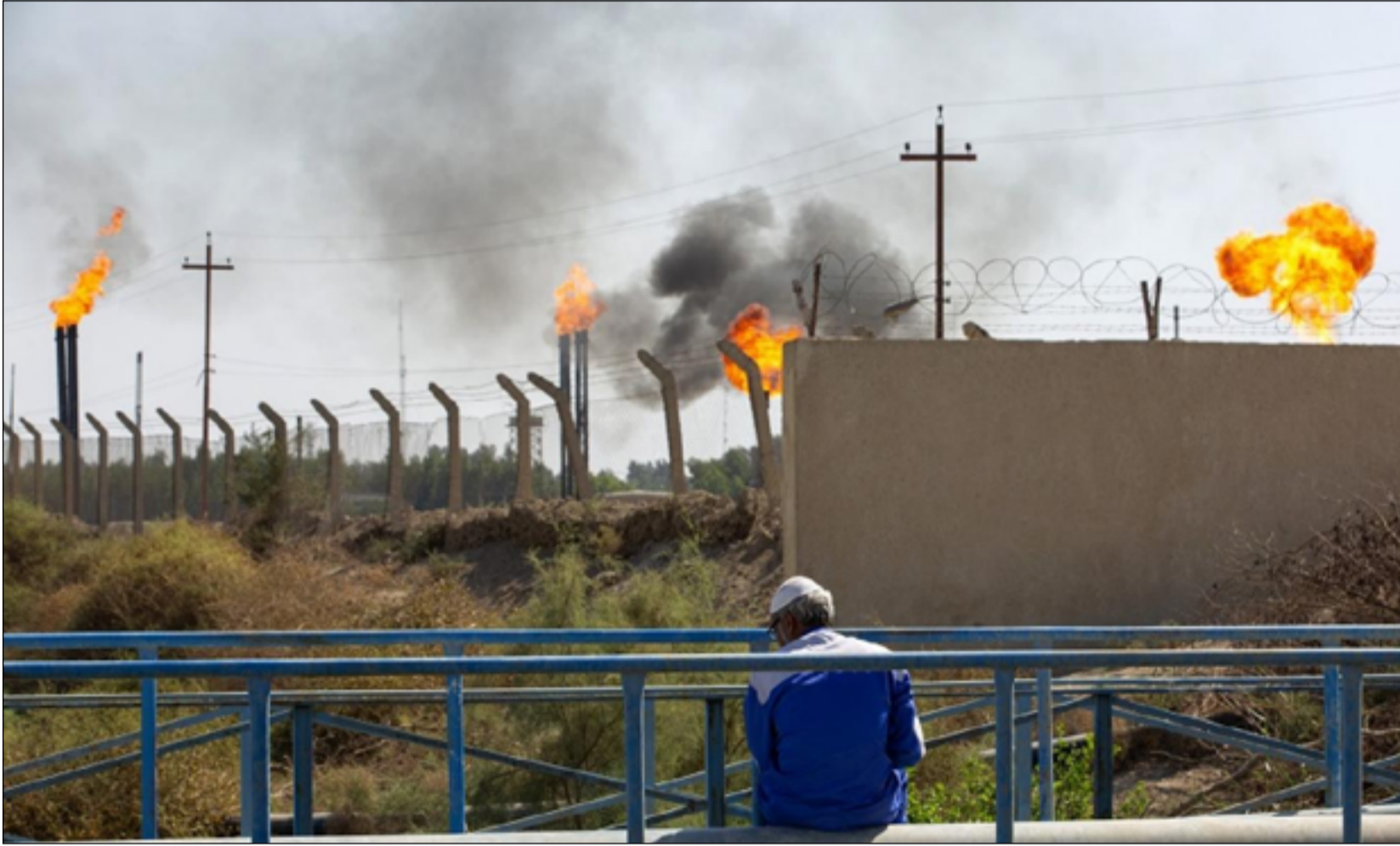
مشاريع إعادة إنتاج الغاز تلوح بالآفاق

وأضاف التقرير، أنه "ورغم الخطط والتقدم السريع الحاصل في توسيع الطاقة الإنتاجية للكهرباء، فإن قدرة العراق الحالية على إنتاج الغاز مضاف لها ما يقارب من ١٢ مليون متر مكعب من الغاز المنتج من إقليم كردستان وما