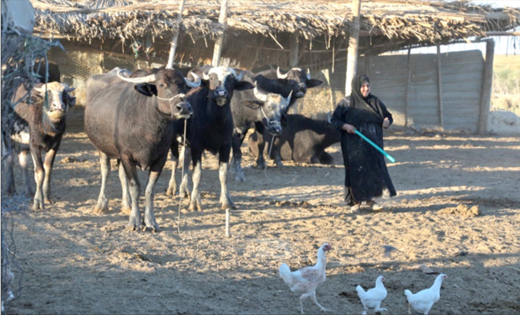
خطر كبير يهدد الجاموس في مناطق الأهوار

ويجد شناوة، أن "مظاهر النزوح من مناطق اهور الجبايش لا تقتصر على