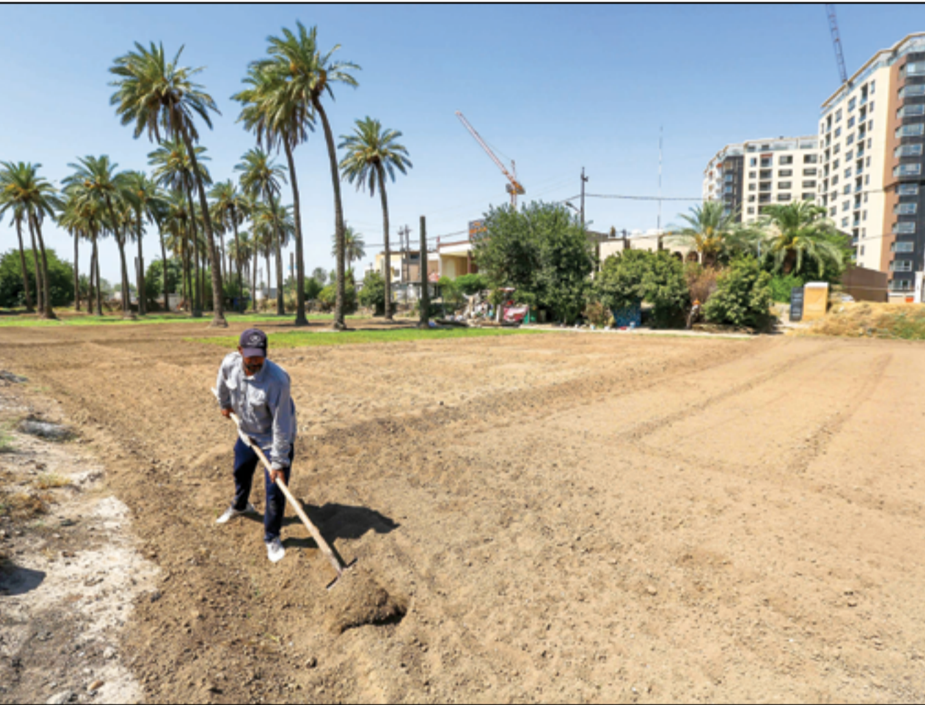
بساتين العاصمة بغداد تواجه الاندثار.