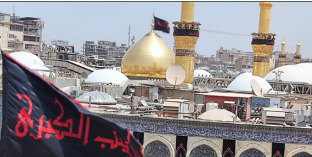
كربلاء تواصل الاستعداد لزيارة العاشر من محرم والربعينية