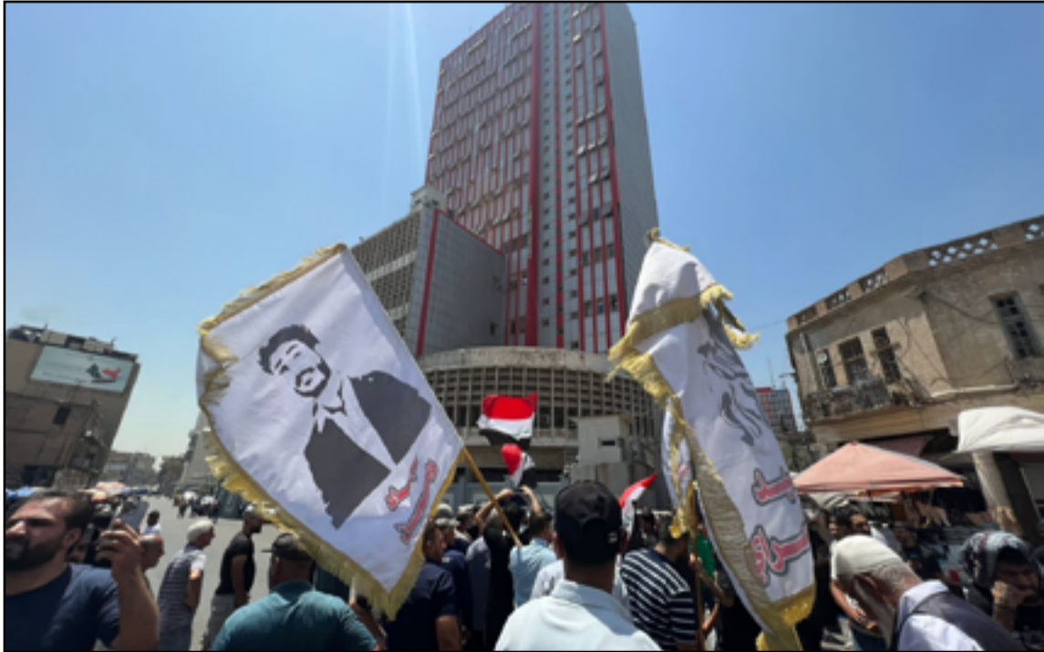
تظاهرات أمام البنك المركزي أمس بسبب ارتفاع سعر الدولار