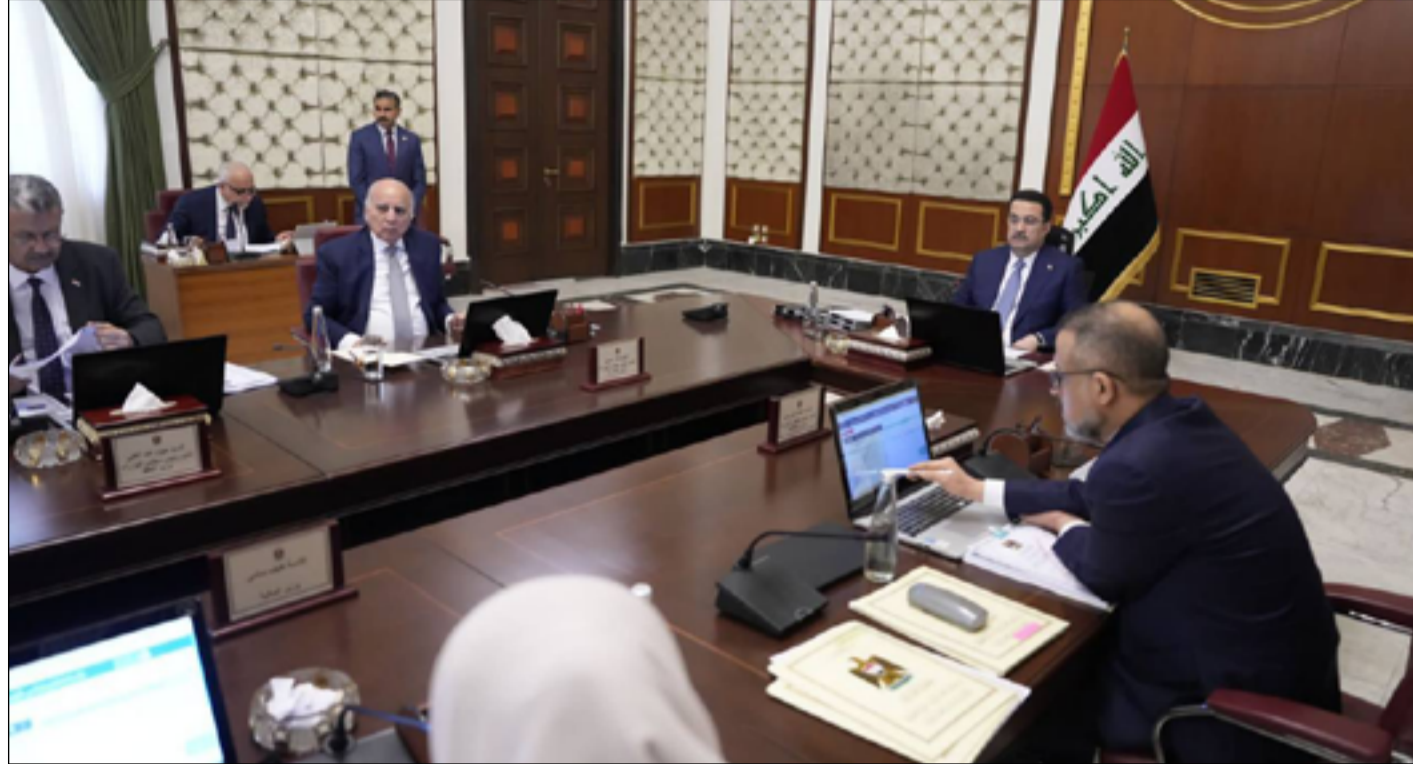
اجتماع مجلس الوزراء أمس الأول

ويسترد التقرير، أن "أحد الأسباب الرئيسية التي دعت بغداد لتعزيز العلاقات مع العربية السعودية هو حاجة العراق لاستثمارات عربية، من بينها مساعدته