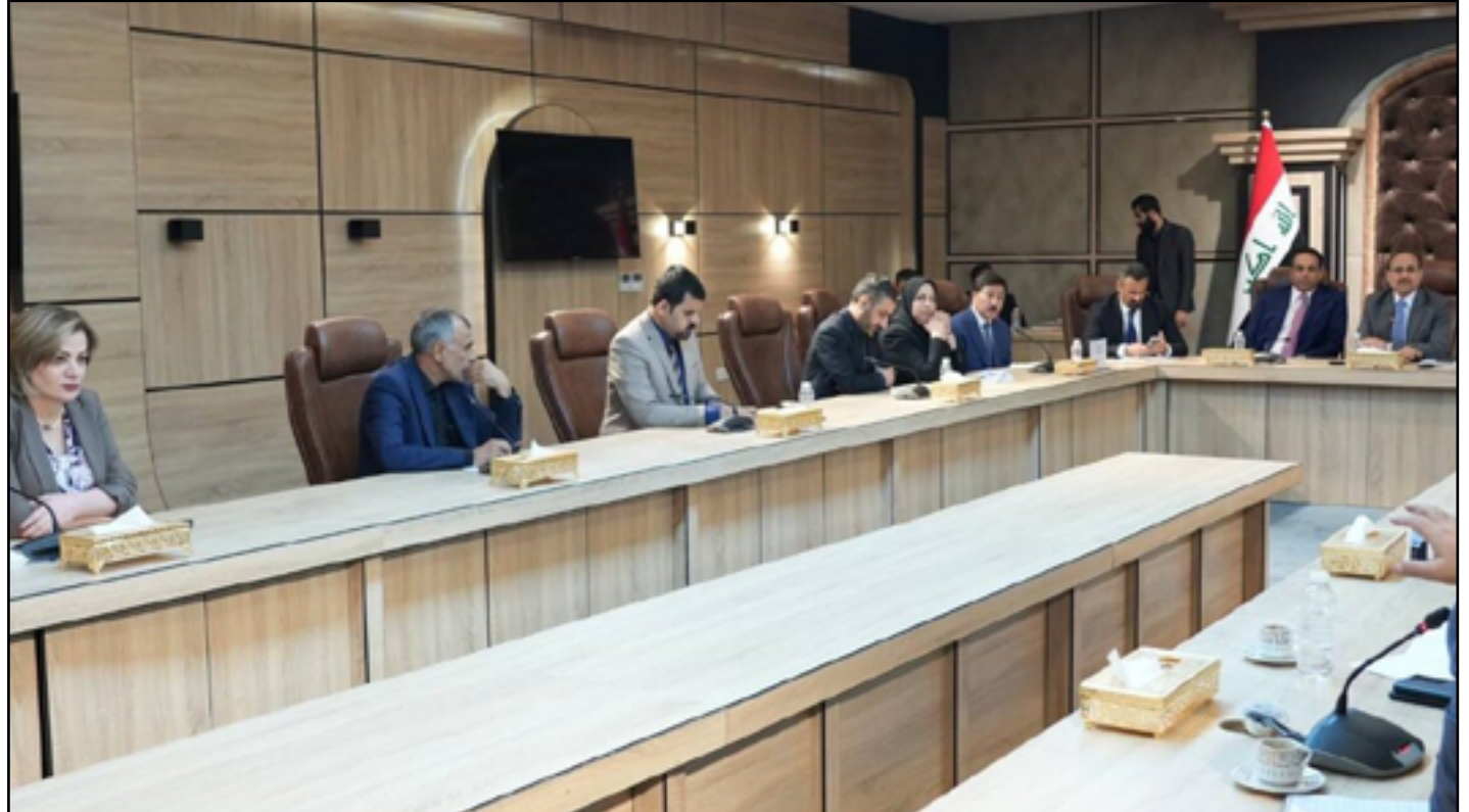
لقاء اللجنة المالية مع محافظ البنك المركزي قبل أيام

وأوضحت، أن "هذه العقوبات جاءت لعدم التزام تلك المصارف بالقواعد والإجراءات المفروضة من قبل البنك المركزي العراقي بشأن التعامل بالدولار وتحويله"، مشددة على أن "البرلمان يتابع مع البنك المركزي والحكومة