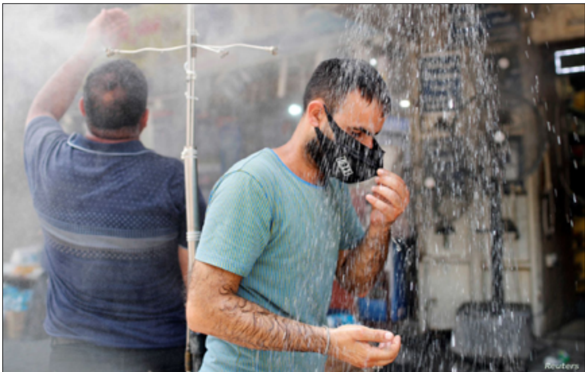
الحرارة تبلغ أعلى مستوياتها خلال الأسبوع الحالي

تكون درجات الحرارة التي تسجل هي التي تقع تحت الظل وليس تحت أشعة الشمس حيث تكون هناك الحرارة أشد. ويواصل عطية، ان ذروة الحرارة تكون بين الساعة ١١ صباحاً لغاية الساعة ٤ عصرًا، وهنا تكون أمام أشعة فوق البنفسجية التي لها مضار كبيرة على الانسان وتسبب سرطانات الجلد وحالات الاعياء الحراري. وجدد الدعوة، لمعالجة "أضرار البيئة والاكتسار من المزروعات والمساحات الخضراء"، وانتهى إلى أن هذه المعدلات من الحرارة قد تم تسجيلها في السنوات الأخيرة مثل البصرة التي وصلت فيها الحرارة في عام ٢٠١٦ لنحو ٥٣ درجة واعتبرت حينها أعلى درجة في منطقة مأهولة بالسكان.