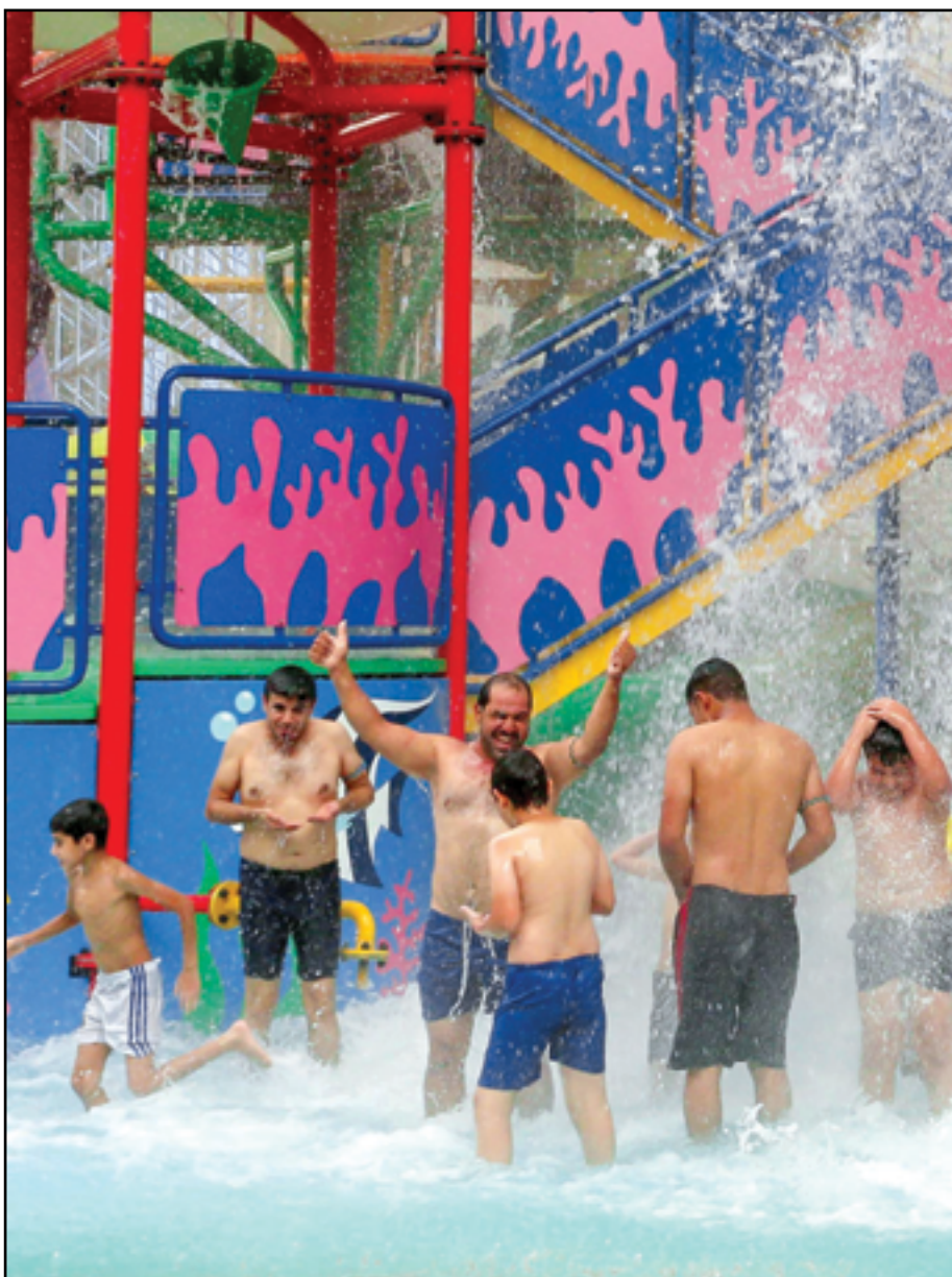
شباب يرحون في مدينة مائة هريا من حرارة الصيف في بغداد..

داخل الاراضي العراقية، ازمة تصدير نفط كردستان. كما ان الزيارة، تأتي بعد 5 أشهر على اخر تعهد قطعه انقرة على نفسها لحل ازمة المياه مع العراق والتي ادت الى تراجع تهديد الفصائل للجار. وكان اردوغان الذي فاز قريبا بالانتخابات الرئاسية محققا اكثر من 52% من اجمالي الاصوات، زار بغداد مرتين في عام 2008