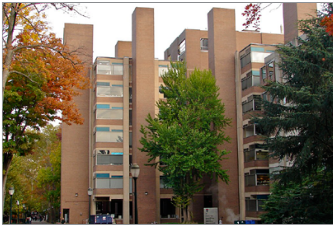
مبنى "مختبرات ريجاردس" (1957 – 1960)، جامعة بنسلفانيا/ فيلادلفيا، امريكا/ منظر عام.

بصدها لاحقاً)، واستخدامه الاشكال الهندسية الاساسية الصافية مع تأكيده على واقعة حضور "الاختلافات الطيفية" Nuance كقيمة تكوينية، بالإضافة الى طروخته حول تفرقي العناصر "الخادمة" عن "المخدومة" تصميمياً، والاهم استرجاع دلالات المفاهيم "الصرحية" و"الرمائية" للبنى المصممة، كل ذلك جعل من ذلك الاستاذ الجامعي المغفور، يوماً ما، "نجماً" ساطعاً في سماء العمارة الامريكية والعالية على حد سواء؛ وقبل ان انهي هذا الاستطراء، أود أن اعود مرة أخرى، الى علاقة "لويس كان" بالعمارة الاسلامية التي عرفها بعق واطلع علي نماذجها المبنية ميدانياً أثناء زيارته لمصر، ومن ثم تأثر بها وأثرت على مقاربتة التصميمية بتأثيرا بليغا، بحيث وصل انبهاره بمخططات منتج العمارة الاسلامية الحضيف، الى اصطفاة بعض مفرادتها التكوينية وتوظيفها، بعد تأويل مجتهد، في احدى مبانيه. وانا، هنا فقط، أنكر القراء الكرام وأحبلهم لمراجعة مخططات <الكتيبة الموحدة> (1959 1062-) في "روجستير" Rochester / نيويورك، لتجيبان ذلك التأثير. نشر "لويس كان" مقالاً في مجلة Ar- chitectural Design، عدد نيسان/ ابريل لسنة 1961 عن مفاهيمه فيما يخص <الشكل والتصميم> Form and Design. وفيه يتعاطى مع مفهوم "الشكل" كما صاغه "ارسطو" (384 322-ق. م.) من قبل، <فالشكل" لديه شئء> <يمثل بالاختلافات المرئية الجوهرية، مثلما يتحدد عبر خصائصه البنوية. يكتب كان" عن ذلك في ذلك المقال (& يترجمتي ما يلي: .. ينطوي <الشكل" على سلسلة من الانظمة الداخلية المنسجمة اضافة الى الاحساس بـ "النظام"، والى كل ما يميز ظاهرة عن أخرى. فالشكل ليس له