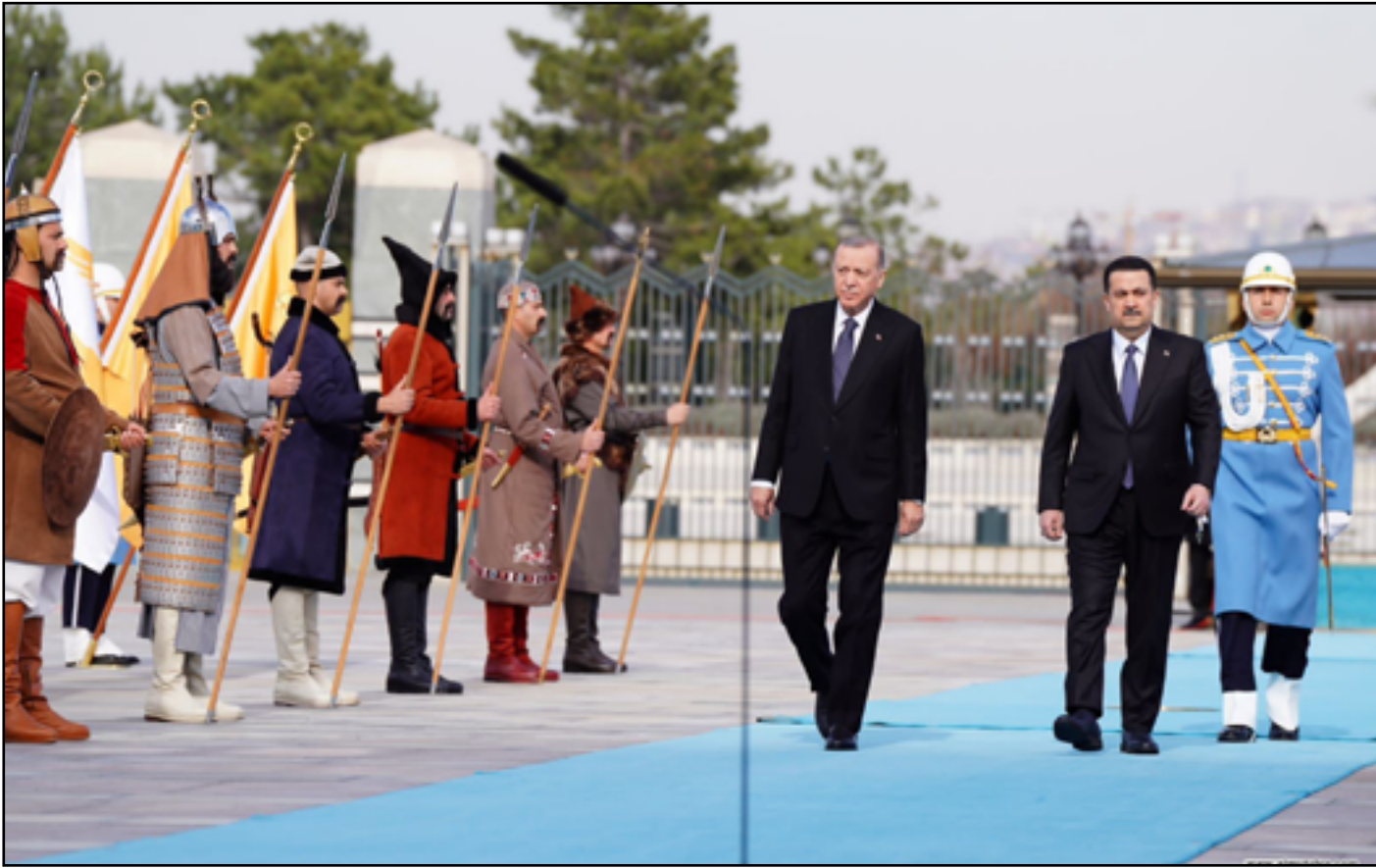
استقبال اردوغان للسوداني في قصره بانقرة في شهر اذار الماضي

بالمقابل تتداول في الاوساط السياسية انباء خلاف ذلك تماما، والتي تشير الى احتمال الغاء اردوغان زيارته بسبب صفقة بغداد الاخيرة مع طهران بشأن