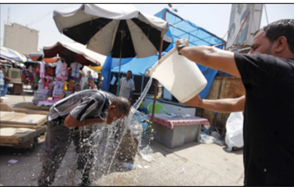
اضرار صحية كبيرة يتسبب بها الارتفاع المستمر في درجات الحرارة

وانتهى الجابري، إلى "التأثير السلبي للانبعاثات الغازية من آبار النفط والموالدات الأهلية لذا نحن نحتاج إلى الطاقة البديلة المستدامة من أجل تقليل آثار ما يتعرض له العراق".