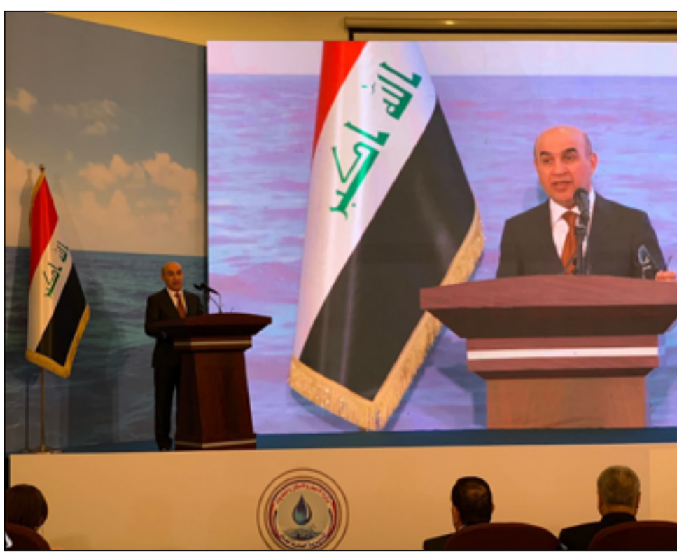
المؤتمر الوطني لإدارة المياه الآمنة في العراق المنعقد أمس

وعبر عن أمه، بأن "يكون المؤتمر بداية لإدارة سليمة لقطاع المياه"، داعياً الإعلام وكل الفعاليات الاجتماعية، إلى "المساهمة في زيادة الوعي وترشيد استهلاك المياه في البلد". ووضي ريكاني، إلى أن "هناك جهوداً حكومية لتسريع من مشروع تحلية مياه البحر في محافظة البصرة، وفي المرحلة الأولى سيكون معدل الإنتاج مليون متر مكعب يومياً، مما سيغطي جزءاً كبيراً من الحاجة، وربما نحتاج أيضاً التوسعة لهذا المشروع".