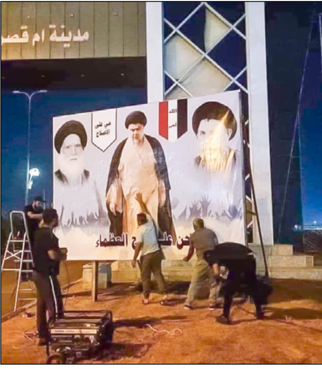
انصار الصدر يرفعون صورة له عند بوابة مدينة ام قصر

كما تقيد تلك الالبياء عن "حراك داخل الإطار التنسيقي للحصول على منصب المحافظ اوقفه الصدر قبل عدة اشهر". العيداني يحاول ان يحصل على تأييد التيار في الانتخابات المحلية.