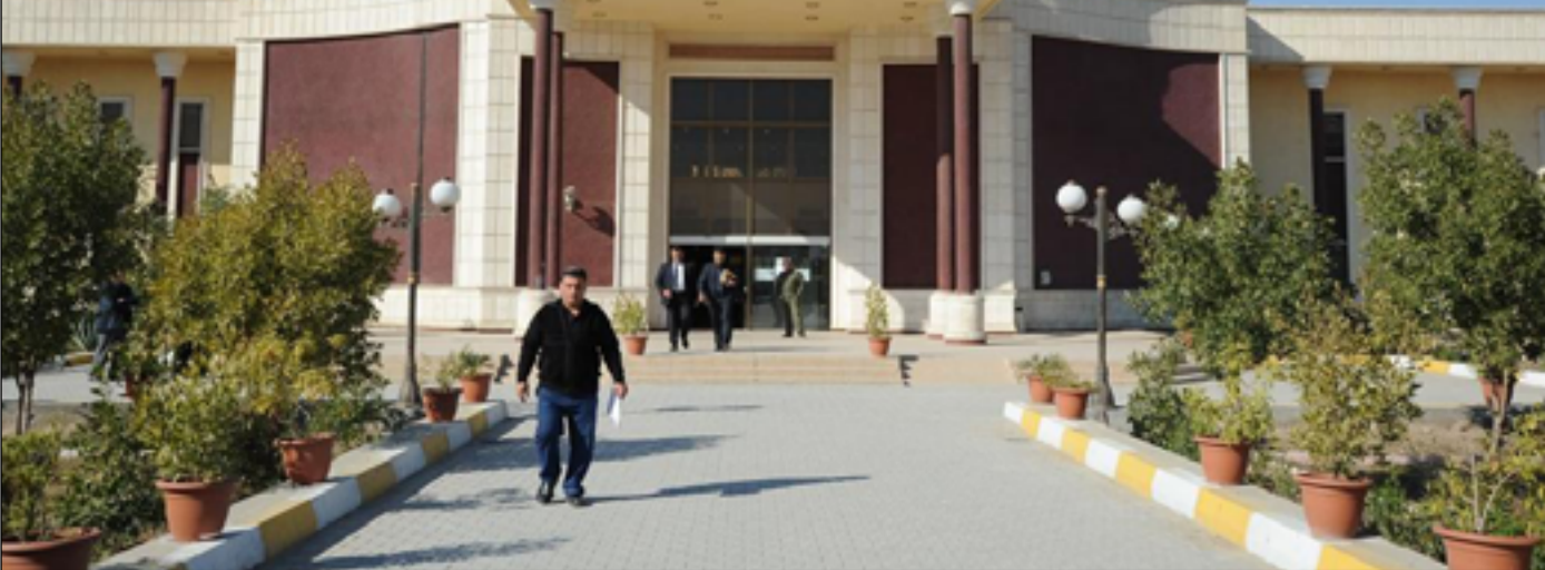
محكمة جنائيات الرصافة في بغداد

وأشار، إلى أن "الفريق، وبعد التأكد من صحة المعلومات عبر عمليات التقصي والتدقيق التي أجراها، انتقل إلى كمرك أم قصر الشمالي، وتمكن من