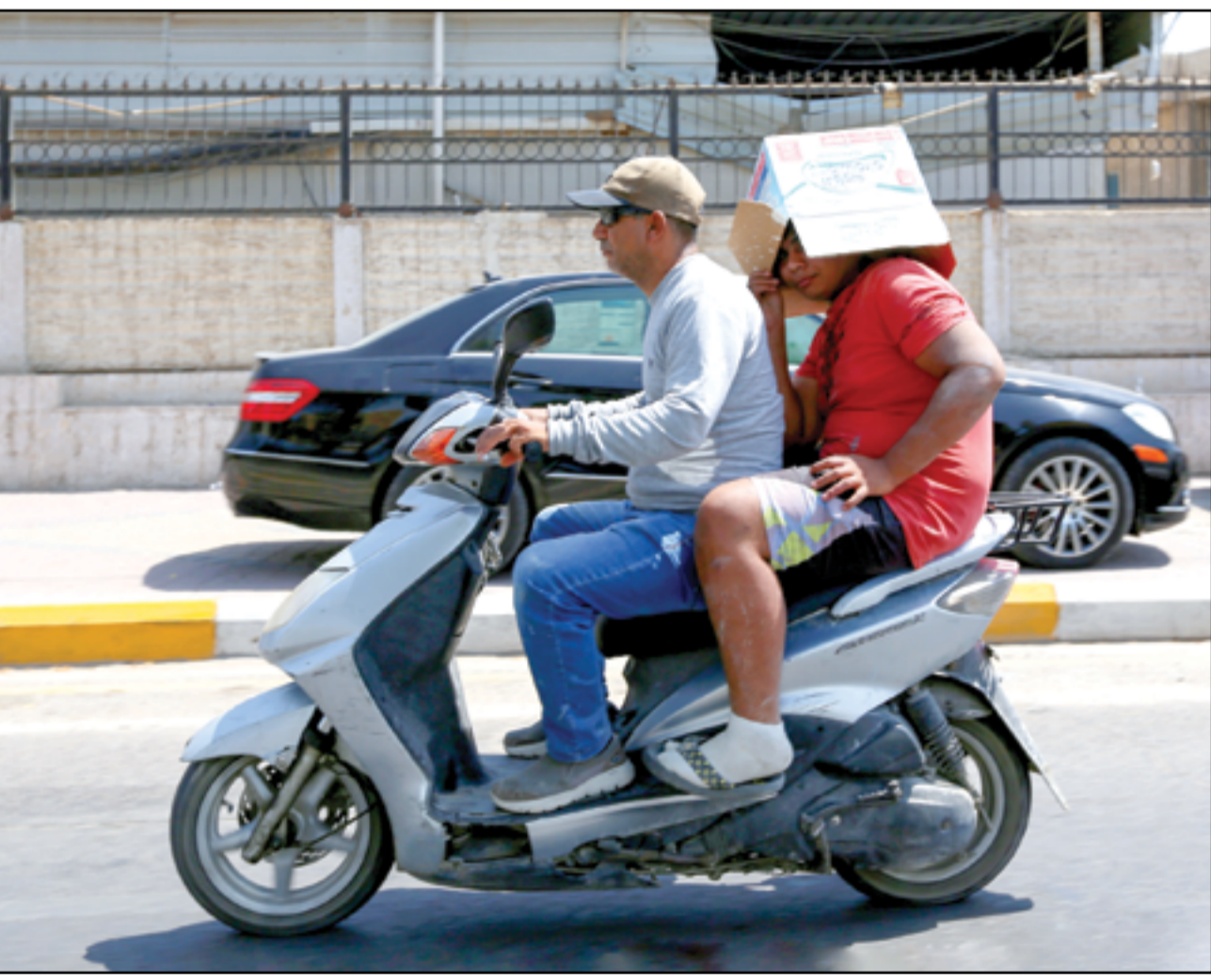
العراقيون يبتكرون طرق مختلفة للوقاية من أشعة الشمس الحارقة..

■ بغداد/ المدى أعلنت دائرة الإعلام والمعلومات في حكومة إقليم كردستان، أمس الأربعاء، أن الحكومة الاتحادية أرسلت قرابة 600 مليار دينار لتمويل المرتبات الشهرية للموظفين والعاملين بالقطاع العام في الإقليم. وقالت الدائرة في بيان مقتضب أمس، تلقتة (المدى) إن الحكومة الاتحادية أرسلت مبلغاً مالياً مقدراً بـ 598 مليار دينار إلى إقليم كردستان. من جانبه قال المتحدث الرسمي باسم حكومة إقليم