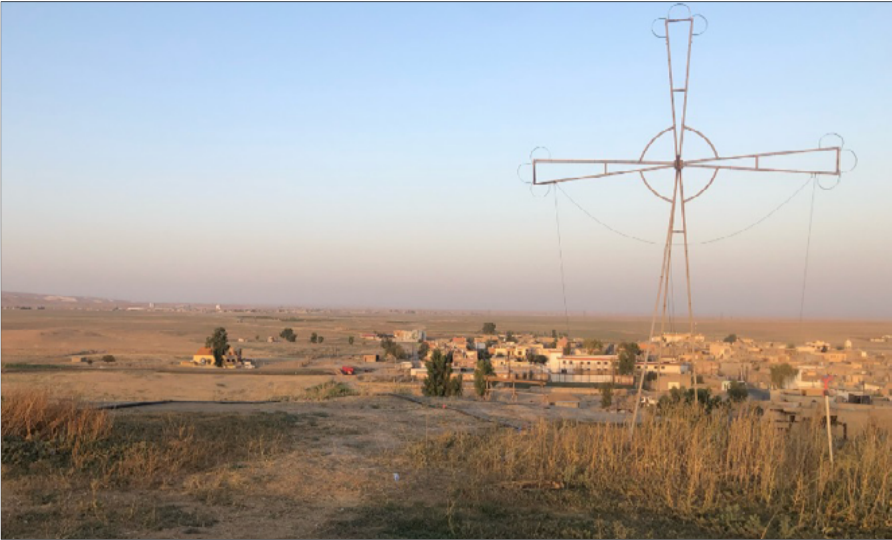
مدينة سهل نينوى تحمل في ذكرياتها الأم عن حقبة داعش

قال أحد سكان قره قوش مستذكراً ما حصل في ذلك اليوم، "الطريق كان كثير من الناس يهربون مذعورين من سهل نينوى بحيث ان الطريق الخارجي أصبح مكتظاً بالمارة والسيارات ما أدى إلى بطء حركة السيارات في رحلتهم للهروب وأصبحت المسافة في هذا الزخم المروري التي تقطع في ساعة واحدة أو ساعتين كحد أقصى بحثاً عن الأمان، أصبحت تستغرق ٧ ساعات أو أكثر.