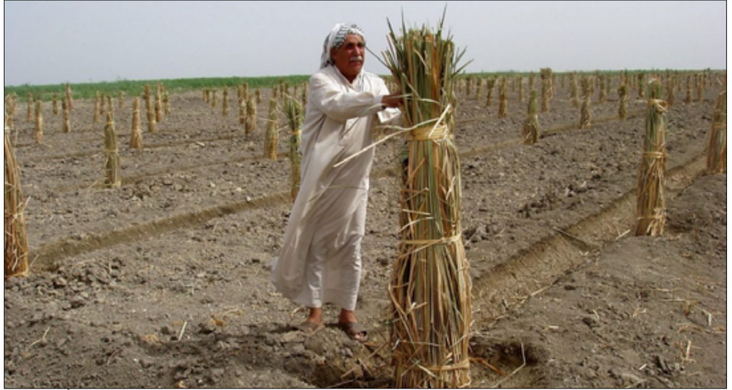
الاراضي الزراعية في الديوانية تعاني كثيرا بسبب شح المياه

زراعة المحاصيل الزراعية الاستراتيجية ومنها محصول الشلب الذي يعد رافدا مهما للبطاقة التموينية، فضلا عن محاصيل الخضر الأخرى"، مشيرا الى ان "هذه الخسارة نتيجة الشحة المائية التي اثرت سلبا على الواقع الزراعي لمحافظة الديوانية".