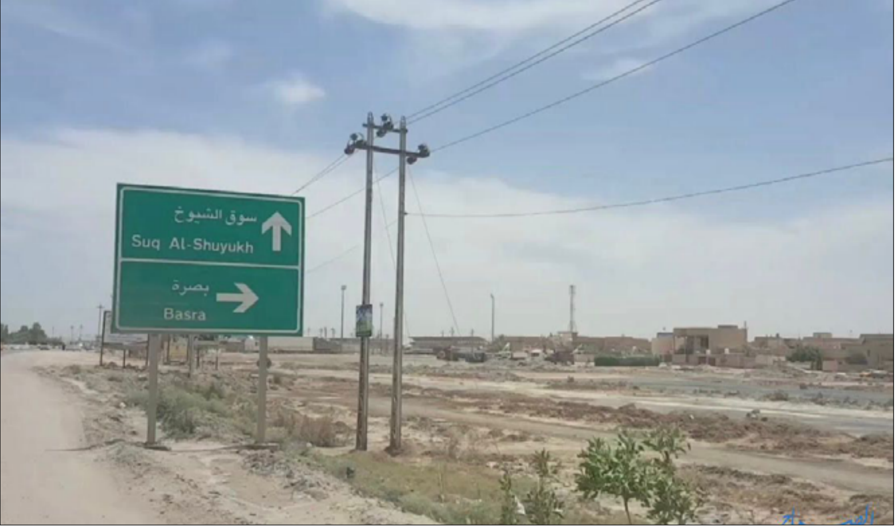
سوق الشيوخ تعاني من مشكلات خدمية متزايدة

وتحدث، عن "عجز كبير في الابنية المدرسية وتفاقم عمر الابنية الأخرى، لافتاً الى ان "المستشفى الوحيد في القضاء يعود انشاؤه الى ستينيات القرن الماضي وهو في وضع متردي جداً وبسعة سريرية محدودة لا