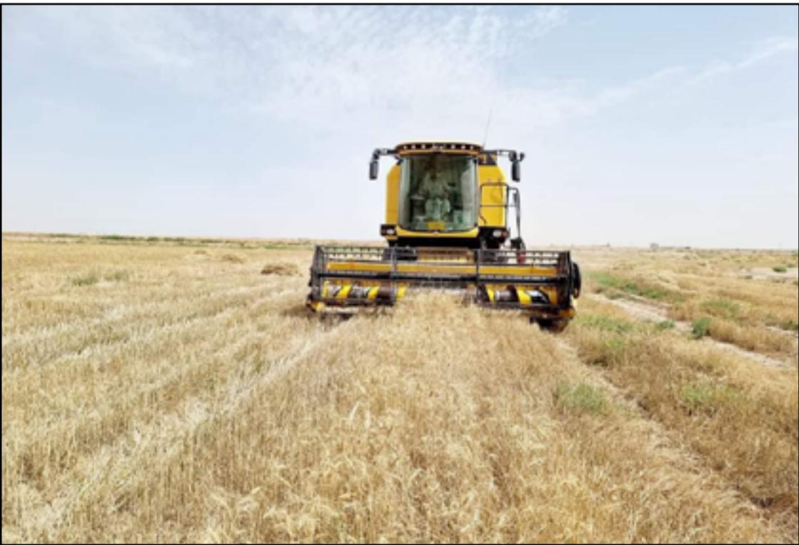
تراجع الخطط الزراعية الى ادنى مستوياتها في العراق بسبب الشح

وأردف الخزعلي، أن "العراق يأمل من زيارة اردوغان إلى بغداد بأن تتمخض عن اتفاق ملزم للجانب التركي في تأمين حصّة عادلة من المياه للعراق في جميع مواسم السنة".