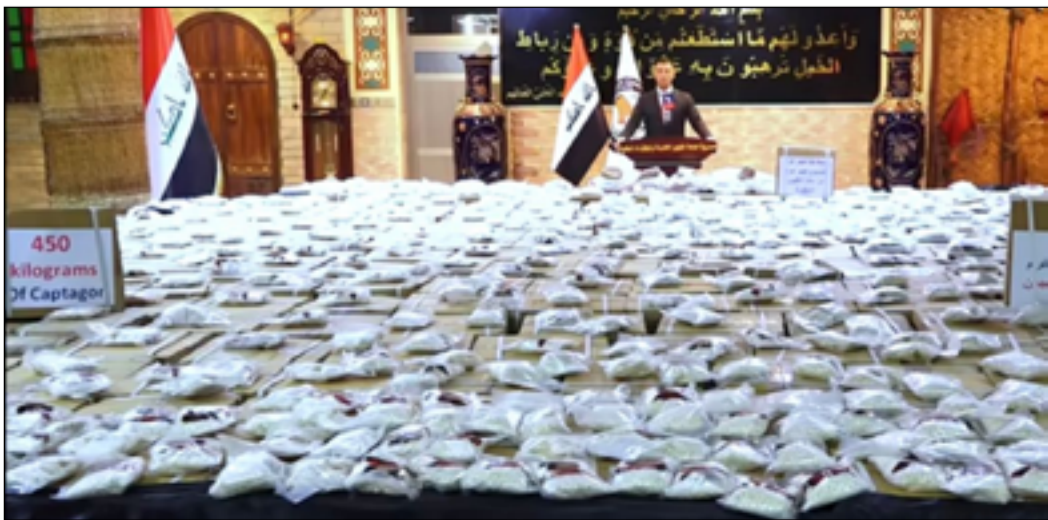
كمية كبيرة من المخدرات المضبوطة أعلنت عنها وزارة الداخلية أمس

وانتهى البيان، إلى أن "المتهمين تم إيداعهم للتوقيف عن جريمة المتاجرة بالمخدرات لنبالوا جزاءهم العادل". وفي غضون ذلك، أصدرت حكماً جنائياً الرصافة، أمس الأحد، حكماً بالإعدام بحق تاجر مخدرات قام