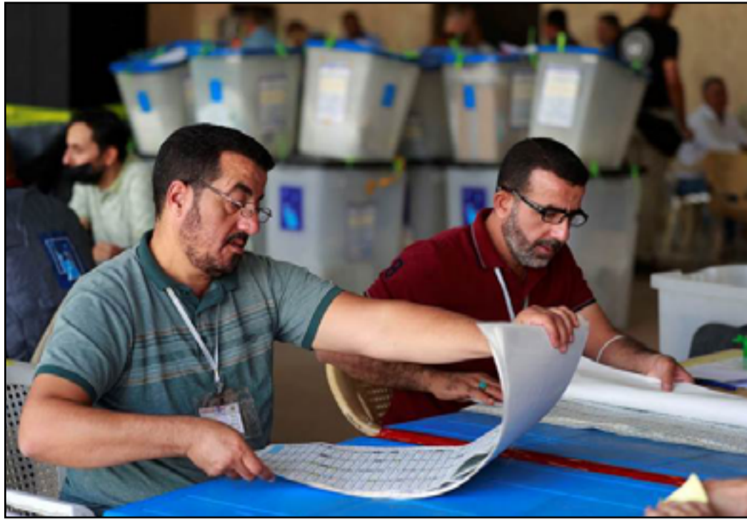
المفوضية تواصل الاستعداد لاكمال متطلبات انتخابات مجالس المحافظات

وكشفت (المدى) في وقت مبكر من الاسبوع الماضي، عن الترتيبات الجديدة التي ينوي "الإطار" من