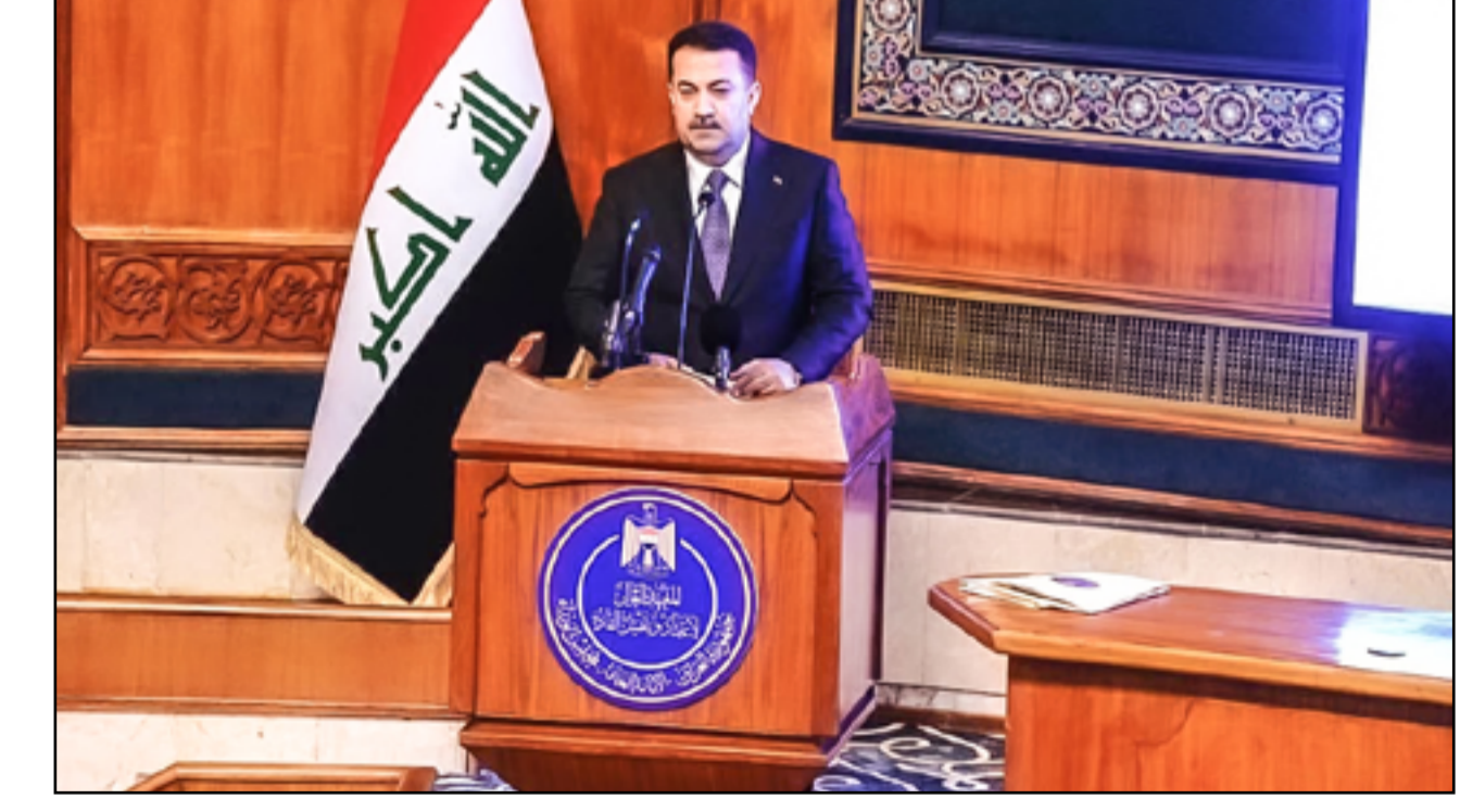
السوداني أثناء كلمته في حفل افتتاح المعهد العالي لاعداد القادة

السوداني أثناء كلمته في حفل افتتاح المعهد العالي لاعداد القادة السوداني أثناء كلمته في حفل افتتاح المعهد العالي لاعداد القادة