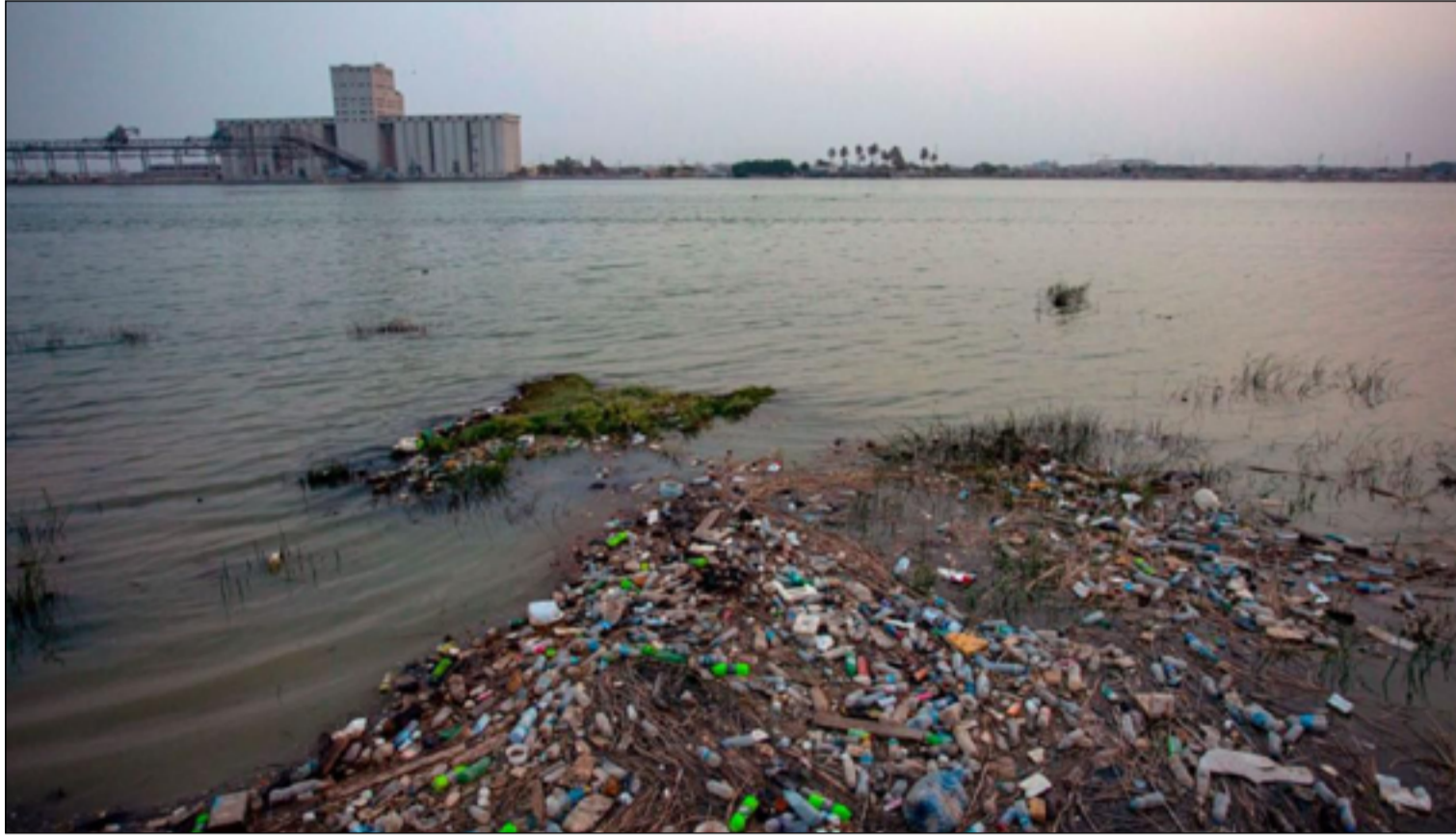
اضرار بيئية كبيرة تواجه العراق وسط غياب المعالجات