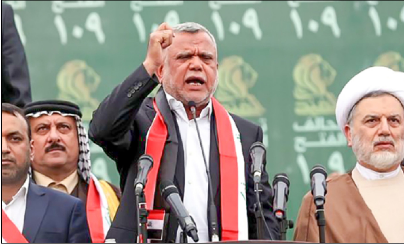
الامر حسم بانتها تحالف الفتح

في تحالف واحد عقب ظهور نتائج الانتخابات. وبحسب احاديث الكوالميس ان تمديد المفوضية للمرة الثانية لاجراءات تسجيل التحالفات كان بسبب تعثر مفاوضات التحالف الشيعي. وكشفت الوكالة الرسمية مساء الاحد عن اقرار المفوضية "تمديد فترة تسجيل التحالفات السياسية الراغبة بالمشاركة في الانتخابات المحلية، لغاية يوم غد الاثنين (امس) الموافق السابع من آب الحالي". وكان من المفترض ان ينتهي التمديد الاول الذي اعلنت عنه المفوضية الاسبوع الماضي، مساء الاحد الماضي، والذي قالت حينها بأنه سيكون "تمديد لمرة واحدة". ووصل عدد التحالفات المسجلة في