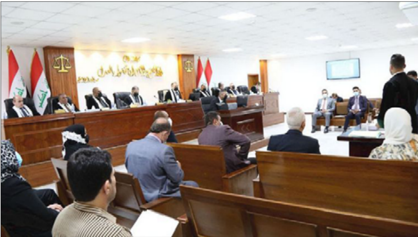
القضاء العراقي ينفي الطعون الحكومية على الموازنة خلال شهر