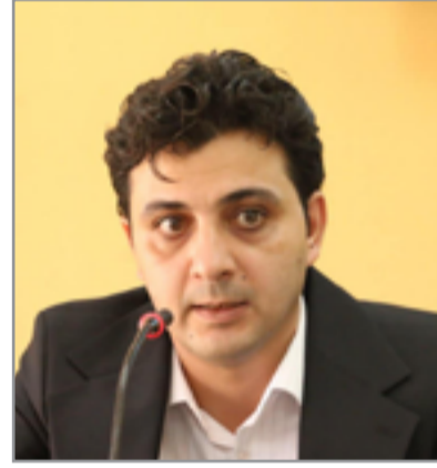
الشاعر علي سرمد