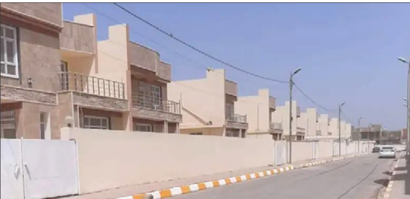
أحد المجمعات السكنية في بابل

وأوضح أن "الموضوع يجب أن يكون تخدم شريحة الفقراء ومحدودي الدخل ليتسنى لهم الاستفادة من المجمعات السكنية، لافتاً إلى ضرورة أن تنفذ مشاريع السكن خارج المدن بسبب