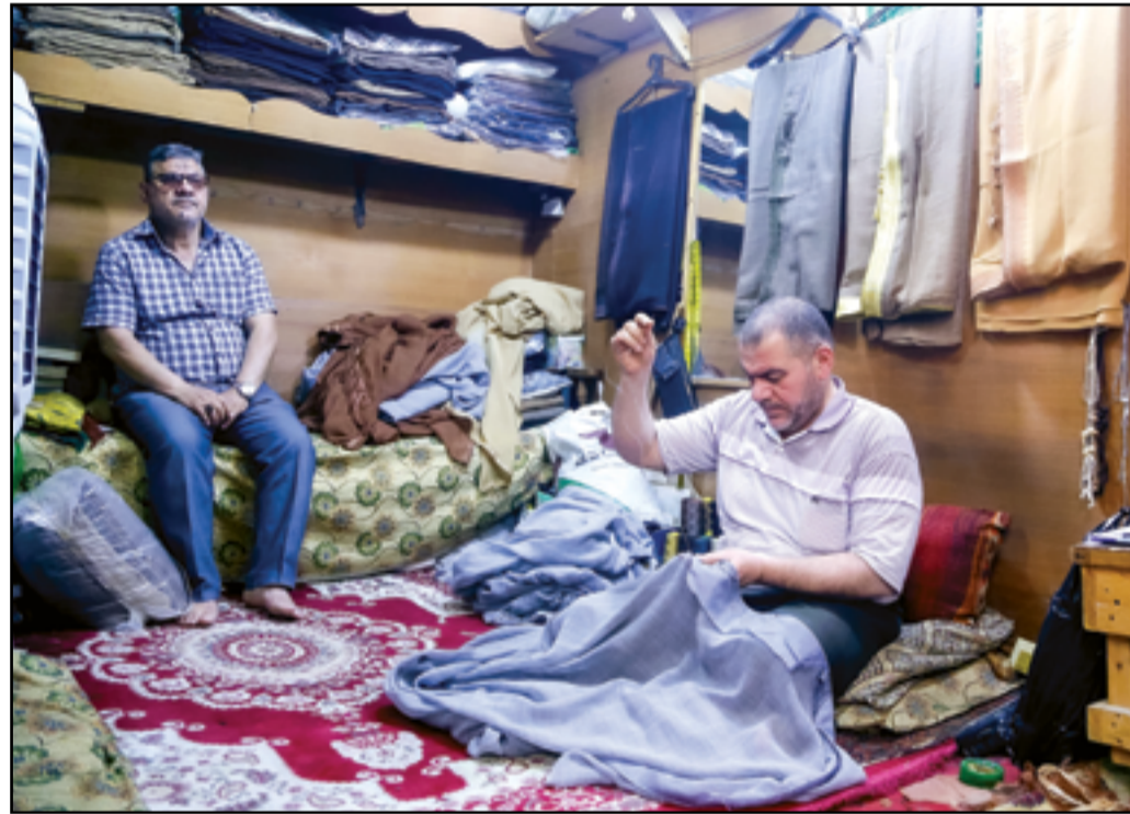
حرفة خياطة وتطريز العباة الرجالية العراقية فن لايندر...

وزارة الكهرباء باشرت فوراً بإعادة ما تضرر من استهداف لإبراج نقل الطاقة، مشيراً إلى أن القائد العام للقوات المسلحة وجه بتسيير أفواج طوارئ لنصب مرابطات على طول مسارات خطوط وأبراج نقل الطاقة بالإضافة إلى نصب كاميرات حرارية تراقب أي عمل تخريبي". وتابع، أن "رئيس الوزراء محمد شياع السوداني وجه كذلك بفتح منافذ استخبارية مع المواطنين وشيوخ العشائر؛ لرصد أي جهد يشبته به كعمل تخريبي، ويعامل معاملة الإرهابي كل من أقدم على العبث بخطوط نقل الطاقة". وأوضح موسى، أن "القوات الأمنية ومن خلال جهودها الاستخباري أحبطت الكثير من العمليات التخريبية التي كادت تطال أبراج نقل الطاقة، وجميع الأبراج عولجت بعد وقت قصير على الاستهداف". وفيما يخص اتفاق النفط العراقي مقابل الغاز الإيراني، بين المتحدث باسم وزارة الكهرباء، أن الحكومة حققت نجاحاً خلال خطوة مفاوضات الغاز الإيراني مقابل النفط العراقي، إذ عادت ساعات