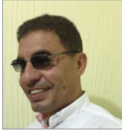
الشاعر ماجد موجد