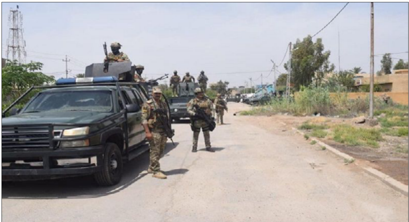
مجموعة من منتسبي شرطة محافظة ذي قار يمارسون نشاطات أمنية

القبض عليهم بقضايا مخدرات بلغ ٢٨ متهمًا فيما بلغ عدد الحكوميين بقضايا مخدرات ١٥ مداناً". وكانت قيادة شرطة ذي قار اعلنت في الثاني من حزيران الماضي حصيلة نصف شهرية بما حققته من عمليات أمنية في المحافظة من ١٦ - ٣١ ايار، تمثلت بـ"القبض ٣٢٩ مخالفاً و٤٠١ متهم، وحجز ٥٢٠ عجلة و٤٤٧ دراجة مخالفتها التعليمات والجراءات القانونية وتسجيل ١٥٩٩ غرامة مرورية".