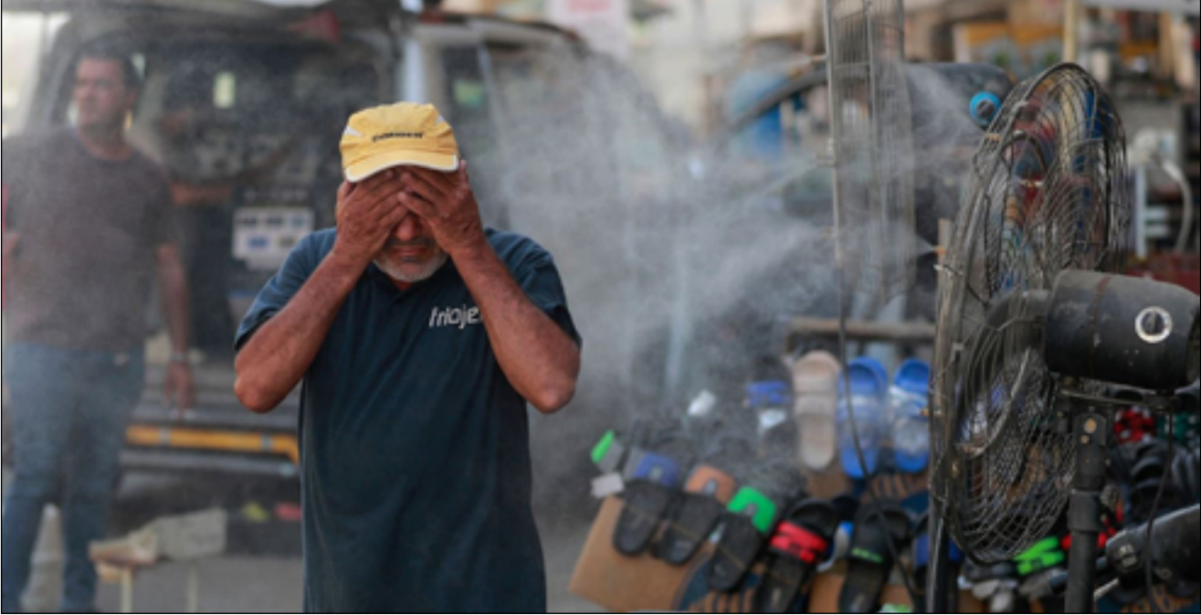
موجة شديدة من الحرارة تسجلها البلاد خلال الاسبوع الحالي

يشار إلى ان الارتفاع الملحوظ بدرجات الحرارة وقللة هطول الأمطار أدت إلى جفاف قوي في العراق، لاسيما للمناطق المكتشوفة، وهي ممتدة إلى دول تحد البلاد، مما يتطلب جهداً مع الدول المجاورة لمكافحة لتقليل هذه المشاكل. يذكر ان ارتفاع درجة حرارة كوكب الأرض تسبب أيضاً في ارتفاع مستوى سطح البحر، فمن ٠,٦ ملم إلى ٢,١ ملم في الفترة الممتدة من ١٩٠١ إلى ١٩٧١، أصبح مقدار الارتفاع ما بين ٠,٨ إلى ٢,٩ ملم بين عامي ١٩٧١ و ٢٠٠٦. كما تسببت التغيرات المناخية في زيادة نفشي الأمراض النفسية والتفسيية وزيادة انتشار بعض الأمراض المعدية وتقلص مساحات بعض الجزر التي أصبح بعضها مهدداً بالاختفاء في المستقبل البعيد.