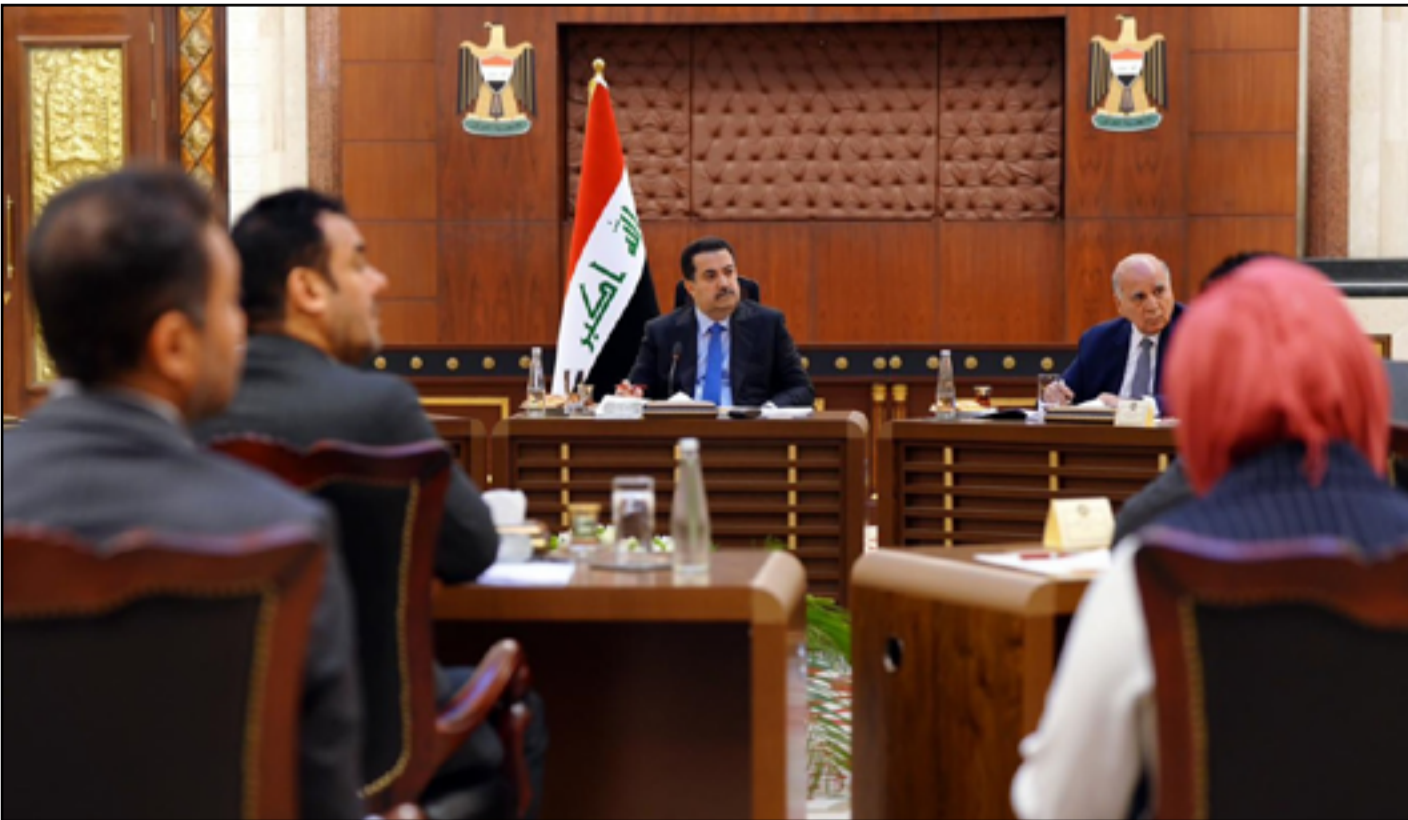
اجتماع ناقش قانون النفط والغاز برئاسة السوداني قبل أيام

ونكر بيان لمجلس الوزراء في إقليم كردستان الأسبوع الماضي، أن مجلس وزراء إقليم كردستان عقد، اجتماعاً الأسبوعي برئاسة مسرور بارزاني وحضور نائب رئيس المجلس قويد طالباني، وتناول عدداً من الموضوعات المدرجة ضمن جدول أعماله. واستعرض مجلس الوزراء "نتائج زيارة وفد حكومة إقليم كردستان إلى بغداد، المتعلقة بإعداد مسودة قانون النفط والغاز الاتحادي بشكل مشترك بين الحكومة الاتحادية وإقليم كردستان والمحافظات العراقية المنتجة للنفط والغاز، وذلك استناداً إلى المواد الدستورية ذات الصلة بقطاع النفط والغاز". ونقل البيان عن رئيس مجلس الوزراء تأكيداً على "ضرورة إعداد مسودة قانون النفط والغاز على مستوى العراق الاتحادي، بما يستند إلى أحكام الدستور المتعلقة بقطاع النفط والغاز، ويجب أن تشكل هذه المواد الدستورية الركيزة الأساسية لذلك، وفق ما نص عليه الدستور بوضوح، وينبغي أن يحظى مشروع القانون بموافقة الحكومة الاتحادية وإقليم كردستان والمحافظات المنتجة للنفط في العراق، بما يعكس مبادئ النظام الاتحادي في البلاد، حسبما منبث في الدستور". وشدد رئيس مجلس الوزراء على "ضرورة احترام الاتفاقات المبرمة بين إقليم كردستان والحكومة الاتحادية بشأن الحقوق المكفولة دستورياً للإقليم". إلى ذلك، أكد مجلس الوزراء على أهمية وجود قانون ينظم قطاع النفط والغاز على مستوى العراق، شريطة أن يتوافق مع مبادئ تنظيم هذا القطاع ومع النظام الاتحادي للدولة العراقية، كما جاء في الدستور.