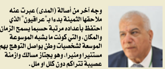
ورجح مراقبون ان تركه من أصالة (المدى) عبرت عنه ملاحظها الثمينة بدءاً بـ "عراقيون" الذي احتفظ بأعداده مرتبة حسبما يسمح الزمان والمكان، والتي كونت ما يشبه الموسوعة الموسعة لشخصيات وطن يواصل التوهج بهم، مستنيراً ومثيراً، وهو يجتاز مسالك وازمنة عصيبة تتراكم دون كلل أو ملل.

تبنية حارة لصحيفتنا (المدى) في عيدها العشرين وتمينات لها بمزيد من النجاح والأزهار، وتحية اعتران لكل محرريها وكتابها وادارتها والعاملين فيها، وأيضاً لاصرارهم الثابت على ان تظل (المدى) فضاء رحباً ونقياً لمبدعي العراق ومثقفيه الاصرار دون استثناء.