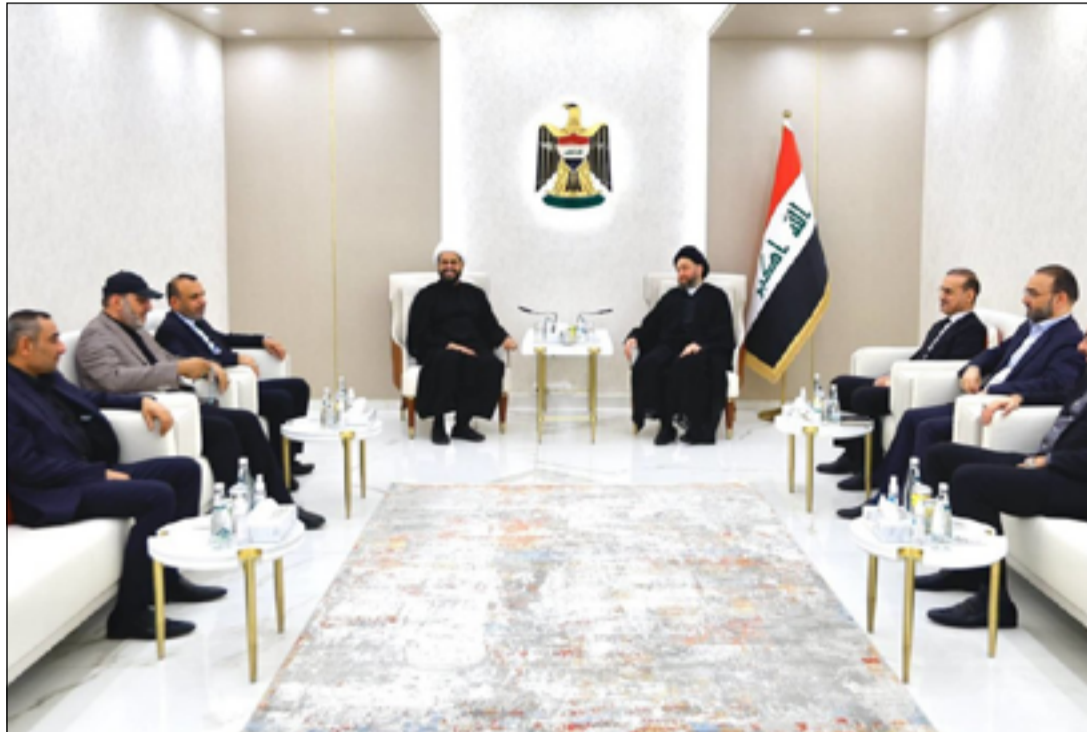
قادة الأطار التنسيقي يؤكدون عزمهم التحالف مجدداً في ضوء نتائج الانتخابات

ورجح مراقبون ان تركه من أصالة (المدى) عبرت عنه ملاحظها الثمينة بدءاً بـ "عراقيون" الذي احتفظ بأعداده مرتبة حسبما يسمح الزمان والمكان، والتي كونت ما يشبه الموسوعة الموسعة لشخصيات وطن يواصل التوهج بهم، مستنيراً ومثيراً، وهو يجتاز مسالك وازمنة عصيبة تتراكم دون كلل أو ملل.