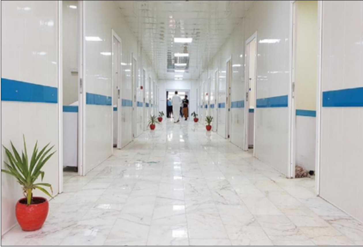
مستشفى قلعة سكر في ذي قار