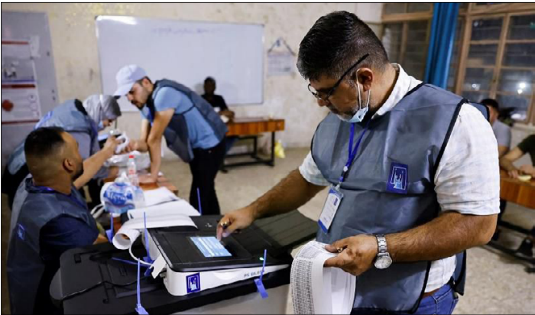
الانتخابات المحلية.. صراع متواصل بين القوائم والمرشحين

كبيرة في الانتخابات التشريعية الاخيرة قبل ان يحصل على مقعد واحد عقب استقالة التيار الصدري من البرلمان في صيف 2022. كما يعود فواز الجريبا، زعيم قبيلة شمر الى قيادة تحالف جديد تحت اسم "القوى المدنية" ويضم 9 تيارات وينوي التنافس في 9 محافظات منها مدينة الموصل. الجريبا هو ضابط سابق وابن عم اول رئيس جمهورية في الحكومة المؤقتة بعد 2003، غازي عجبل الجاور. والجريبا كان قريبا من الحصول على منصب رئيس الجمعية الوطنية في