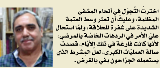
اخترتُ التّجوّل في أنحاء المشفى المظلمة، وعليك أن تعثر وسط العتمة الشديدة على شفرة للحلاقة، ولما استحلت علي الأمر في الردهات الخاصّة بالمرضى، لأنّها كانت فارغة في تلك الأيّام، قصدت صالة العمليّات الكبرى، لعل المشرط الذي يستعمله الجراحون يفي بالفرض.

في كتابها "الاعتراف بالقصّة القصيرة" تقرّر أستاذة الأدب الإنكليزي (سوزان لوهافر) أنّنا جميعاً نستطيع أن نُؤلّف قصّة واحدة، قوامها الأحداث التي مرّت بنا، ومنها ولدنا أو كان من الممكن أن نفنسى. من يراجع مقالات المجلة الطبيّة التي ذكرتها يكتشف أنّ حياتنا تتألّف من ومضات يأتيها القدر ويغيرها دون سابق إنذار إلى الأحسن أو الأسوأ، أو ما نظنه نحن أسوأ وأحسن، لأنّ تقدير ذلك في الأخير ليس في متناول أيدينا، مع الأسف الشديد.