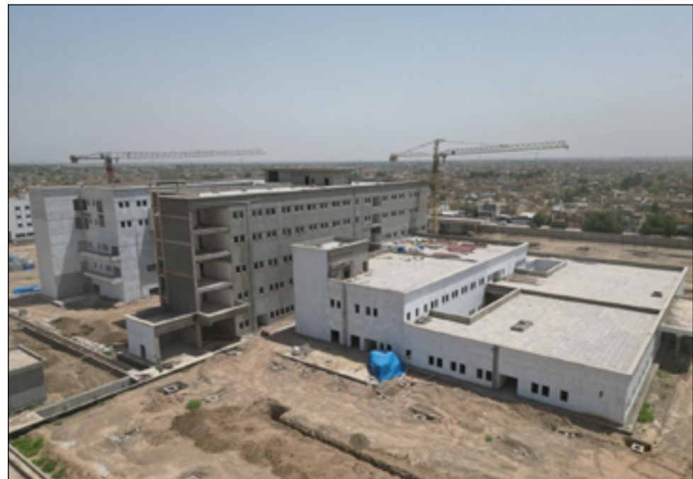
مشروع مستشفى الحسينية العام في بغداد

وحدات متعددة من جميع الاختصاصات منها وحدات حروق وتأهيل طبي ووحدة نفسية وغسيل الكلى ووحدة قلبية مع رعاية الخدج بشكل متطور جدا وأجهزة تشخيصية مختلفة سواء في العيادة الاستشارية أو في داخل المستشفى إضافة الى دار أطباء بسعة ١٤٠ غرفة بجميع الخدمات وعبادة استشارية متكاملة". وأشار، إلى أن "المستشفى كان متكئاً للكثير من الأسباب، إلا أن البرنامج الحكومي لحكومة رئيس الوزراء محمد شياع السوداني، الإسراع في إكمال المشاريع المتلكئة وحل جميع المشاكل وتسهيل العراقيل". وخلال فترة وأوضح الحسناوي، "خلال فترة الحكومة تم افتتاح مستشفى السياب في البصرة ومستشفى