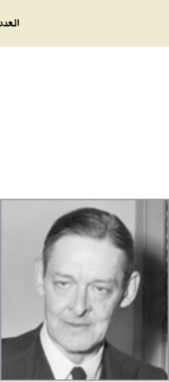
ت. س. البيوت

ليتعالى صراخه، عندها يشعر بالعجبة، متلذذًا بعذاب شتاوة، وهو يرى كمية الألم التي تجتاحُ جسده المنهك، يتعاطف معه البعض محاولا أن يمنعه من الإساءة اليه، لكن ذلك لا يعني انه في مأمن من أولئك الذين لفظتهم آفية البؤس وولدوا في ليل قانظ بخصومٍ كل البؤس وشياطين الجن ليكفونا مسوخًا آدمية! يتقافزون مهلين غارقين في