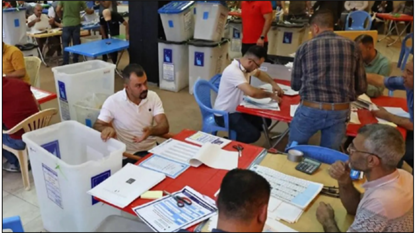
المفوضية تقول إنها مستمرة في جدول عملياتها وصولاً إلى يوم الاقتراع

ويضم قادة التحالفات وأحزاب منضوية فيها 4 وزراء في الحكومة الحالية، و 6 محافظين مستمرين في المنصب. إضافة إلى 18 نائباً، إلى جانب رئيس ونائب رئيس البرلمان، ومستشارين حاليين في الحكومة، وقادة الحشد. ويمنع على تلك الشخصيات - حسب القانون- استخدام المال العام أو المناصب في إدارة الحملة الانتخابية أو الترويج للقوائم. لكن مراقبين وأحزاب قاطعت بشكل مبكر الانتخابات المحلية المقبلية، تفترض أن مهمة منع أحزاب وشخصيات السلطة من استخدام المال السياسي "شبه مستحيلة". وشهدت آخر عمليتي انتخابات تشريعية في 2018 و 2021، خروقات واسعة في استخدام إمكانيات وموارد الدولة. وانتقد مرشحون في 2018 رئيس الوزراء آنذاك حيدر العبادي لاستخدامه طائرات رئاسية في التنقل بين