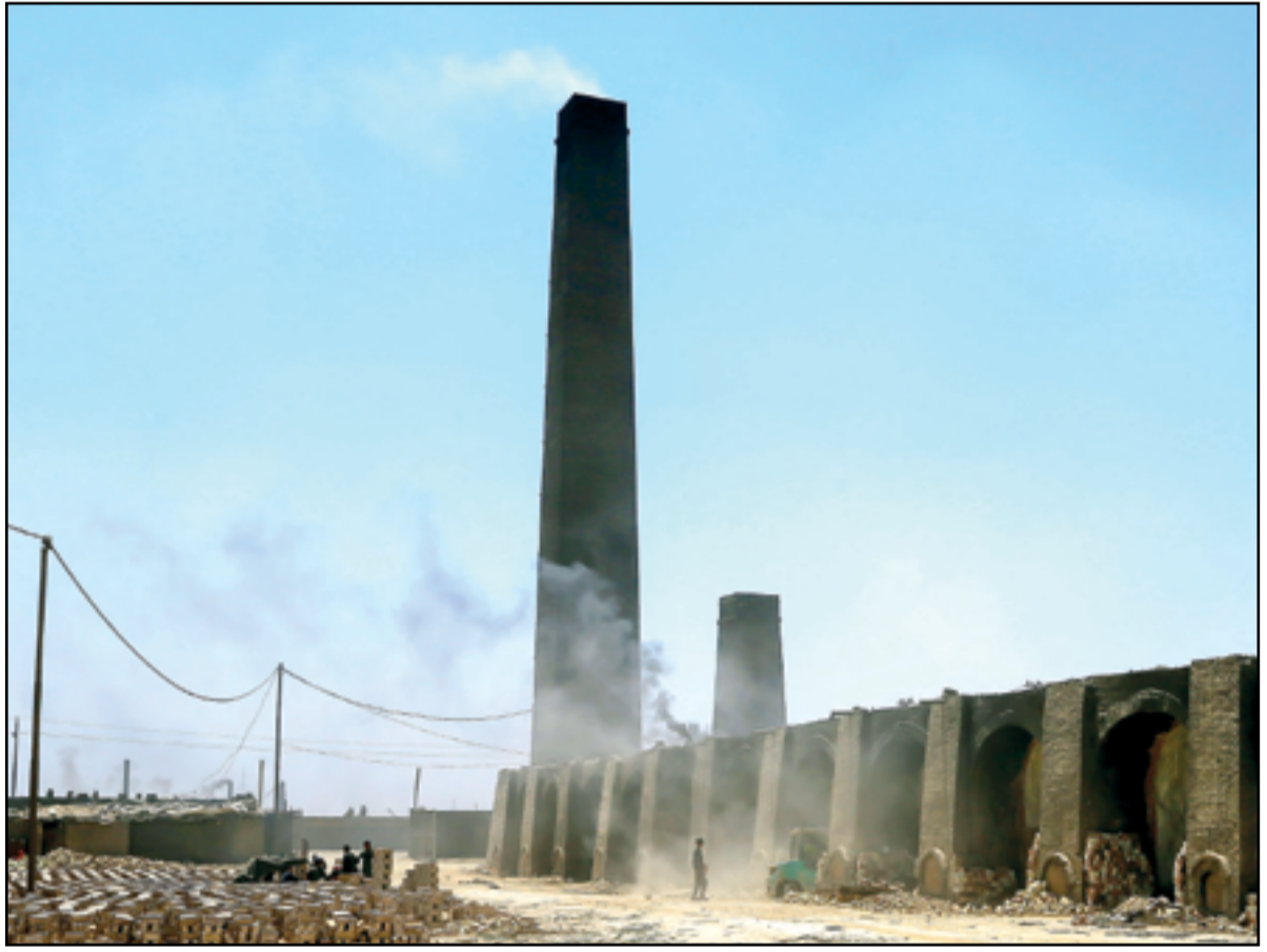
معامل الطابوق في مناطق حزام بغداد...

وجاء في بيان صادر عن مجموعة مؤلفة من ثلاث منظمات دولية غير حكومية معنية بالشؤون الإنسانية وشؤون النازحين في العراق اشتملت على المجلس الترويجي للاجئين والمجلس الدنماركي للاجئين ولجنة الإنقاذ الدولية، تم ارساله الى موقع (ذي هيومانيتريان)، الاخباري ما نصه "في الوقت الذي كان قرار الحكومة يغلق مخيم الجدعة 5 قراراً وشيكاً ومتوقفاً، فان مواعيد الإغلاق لم تكن معروفة وواضحة على نحو واسع، وهذا يعني ان معلومات الإغلاق لم يتم نقلها من الوكالات الإنسانية للعوائل المقيمة ليكونوا مستعدين". التفاصيل ص2