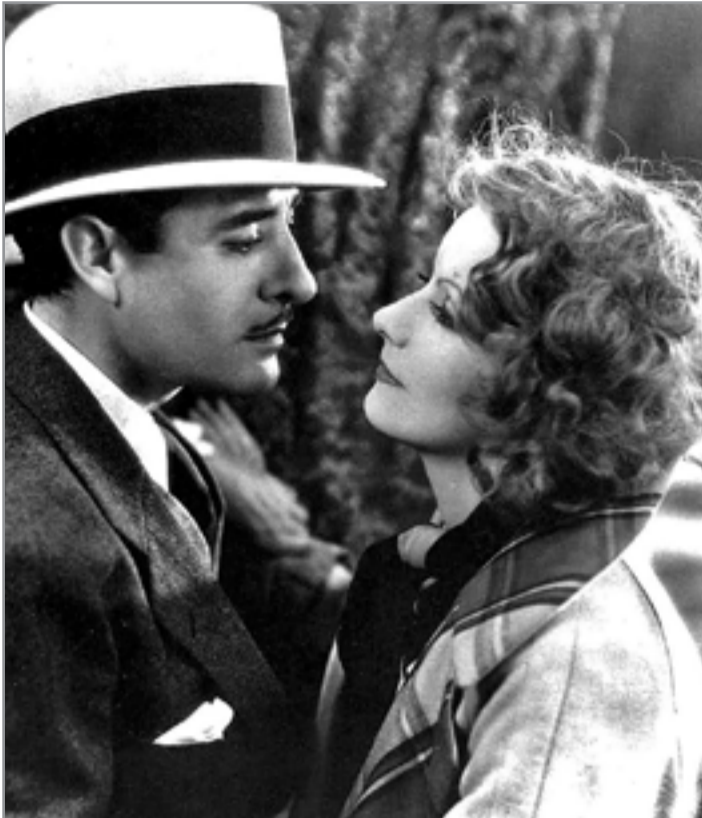
غريتا غاربو في مشهد سينمائي

المرأة الأولى التي ألقت فيها غريتا غاربو عبارتها الأكثر شهرة، كانت في فيلم "غراند هوتيل" (1932): ((أريد أن أكون وحيدة... أنا فقط أريد أن أكون وحيدة)) عبارة ضربت على الوتر الحساس، وكانت تتردد بتنوع في عدد من أفلامها اللاحقة - في نينوتشكا (1939)، على سبيل المثال، يسألها واحد من المراسلين الصحفيين السوفييت، ((هل ترغبين أن تكوني وحيدة، رفيقة؟)) - لأنها كانت مفهومة في تعريف شخصيتها. لم يكن هذا يعني أنها كانت منعزلة، بل لأنها - وهذا ليس مستغرباً في ممثل - كانت خجولة. كانت تتمنى أن تترك وحيدة: من المعجبين، الصحفيين وكتاب السيرة. هذه الخصوصية الشديدة كانت تعّد تحدياً. أعدت شبكة امتازون قائمة باكثر من 500 كتاب عنها، الأخير منها كتبه ديفيد بریت، الذي أنتج على نحو مسرف، وعلى مدى عقدين، أكثر من سيرة مفيرة عن شخصيات مثل دايانا دوريس، باربارا سترايسند وتالولا بانكهد. ((ولدت)) قالت غاربو ذات مرة. ((كبرت. عشت حياتي مثل أي شخص آخر. هذا كل ما هناك عن قصة حياة أي شخص. ليس كذلك؟)) قد يكون لنا اعتراض طفيف على عبارة ((مثل أي شخص آخر))، لكن على أي حال قصتها معروفة جيداً. كانت