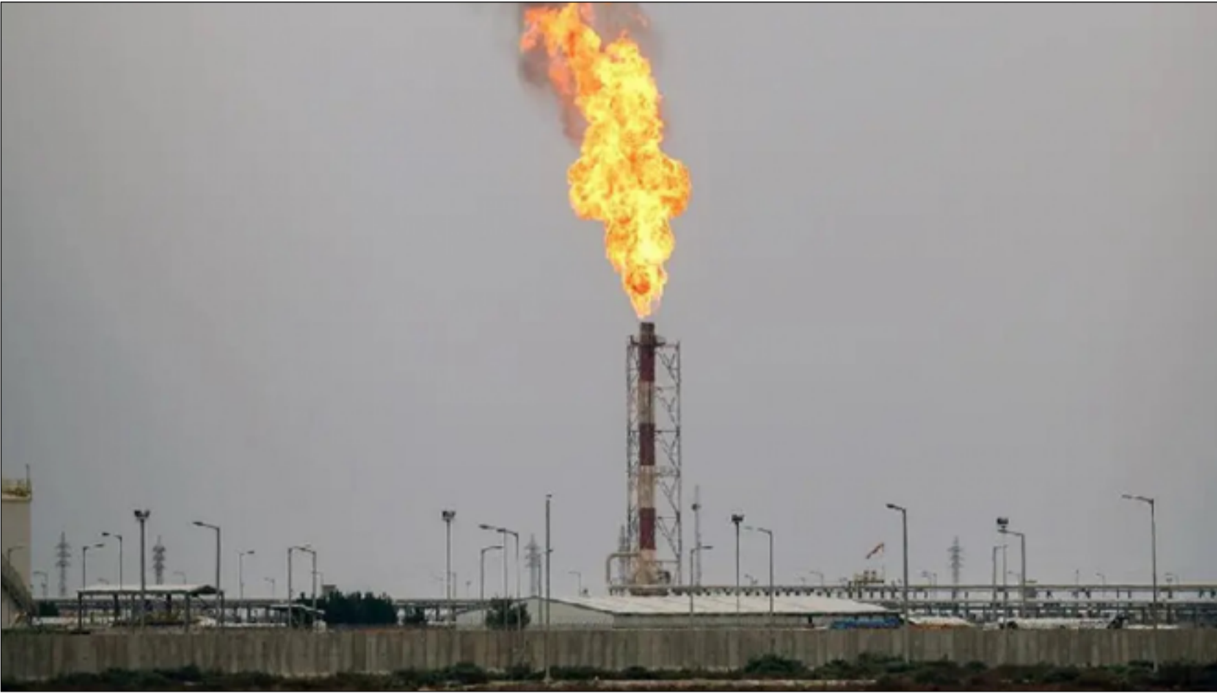
مشاريع واعدة تنتظر العراقيين في استثمار الغاز الطبيعي والمصاحب

واستنادا لمراجعة (شركة برتشي بتروليم) الاحصائية لعام ٢٠٢٢، فان العراق أنتج في العام ٢٠٢١ ما يقارب من ٩,٤ مليار متر مكعب من الغاز واستهلك ١٧,١ مليار متر مكعب. وتقدر كمية ما يمتلكه العراق من احتياطي مخزون من الغاز الطبيعي بحدود ٣,٥ تريليون متر مكعب. ويذكر انه منذ تسديد الديون، فان إيران قد عرضت زيادة صادراتها من الغاز للعراق. وطالما ان العراق غير قادر على توفير ما يكفي لسد حاجته المحلية من الغاز،