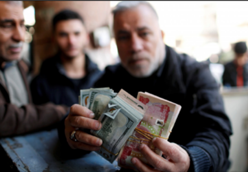
الاجراءات الحكومية لم تنجح في معالجة الفرق بين سعر الدولار في السوق الموازي وسعره الرسمي