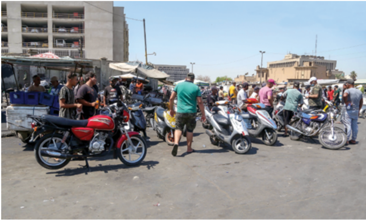
المرور تلاحق أصحاب الدراجات المخالفين لاجراءات التسجيل...

عباس المرزجي يكتب: غريتا غاربو المرأة التي رغبت أن تكون وحيدة