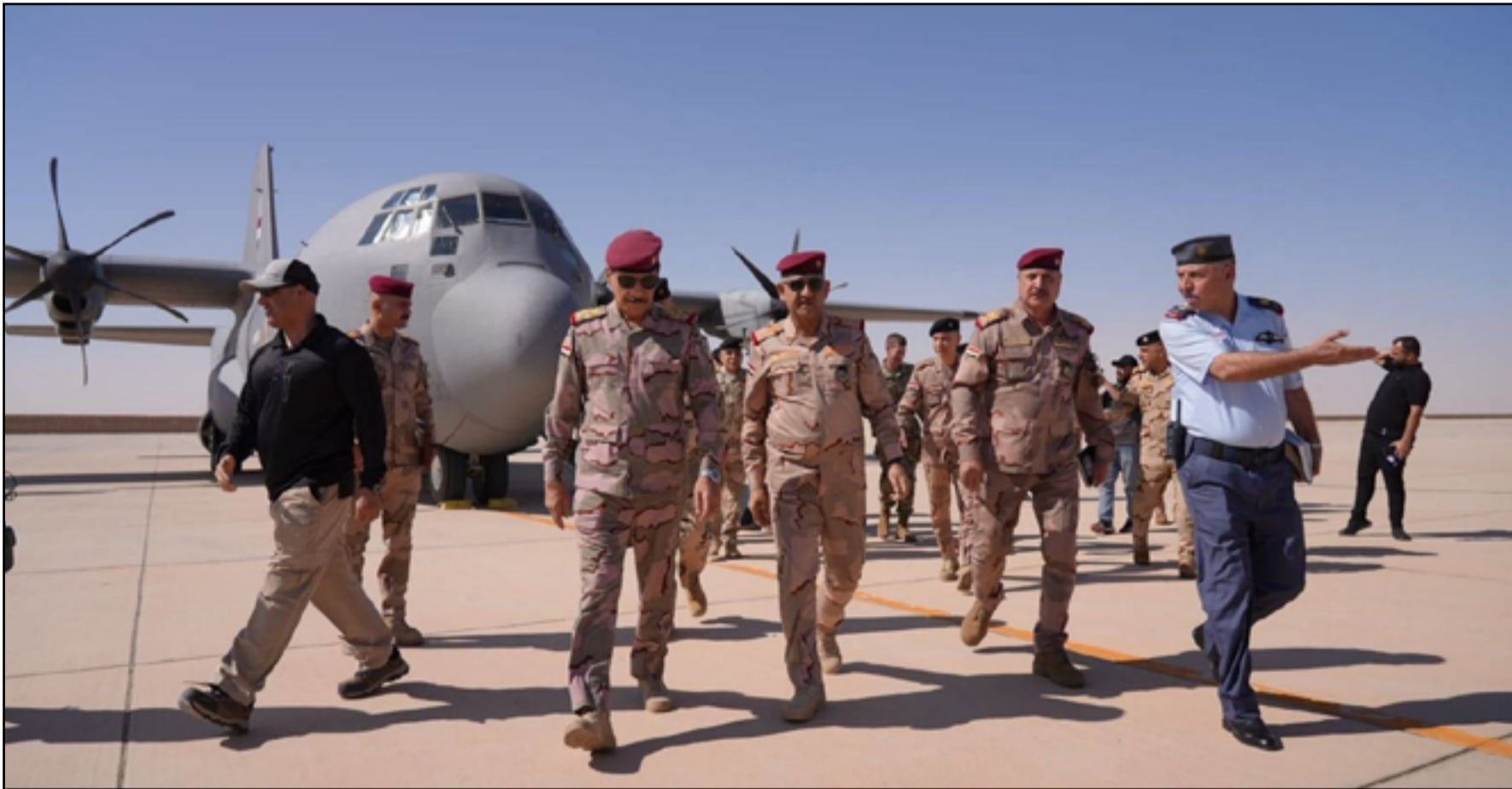
وفد عسكري رفيع أجرى زيارة إلى قاعدة عين الأسد بداية الأسبوع الحالي