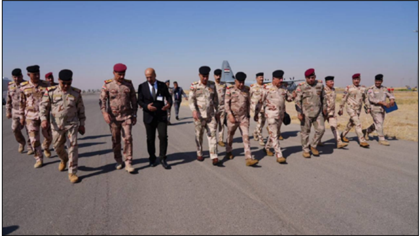
وفد عسكري رفيع المستوى يصل إلى كركوك أمس