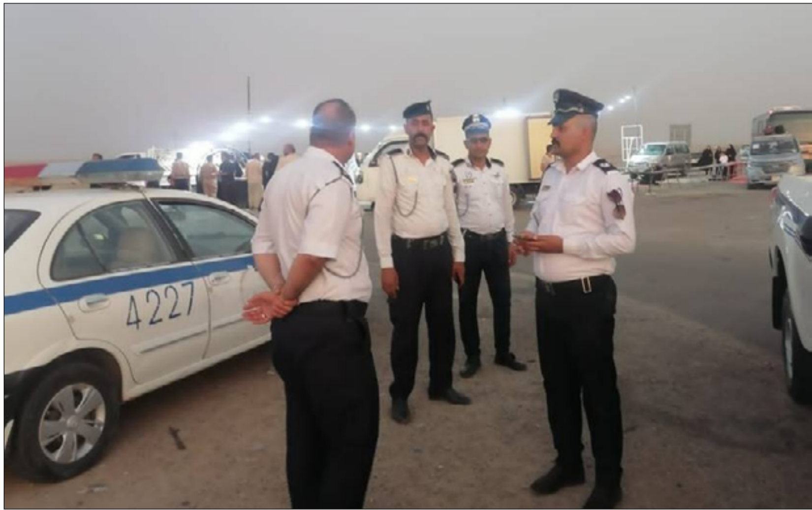
مديرية المرور تشر مفاوزها على طريق الزائرين في ذي قار لحمايةهم من الحوادث

وفي ذات السياق أعلنت قيادة الشرطة عن نشر المزيد من القوات الامنية على الطريق الدولي من حدود محافظة البصرة باتجاه محافظة البصرة لحماية الزائرين.