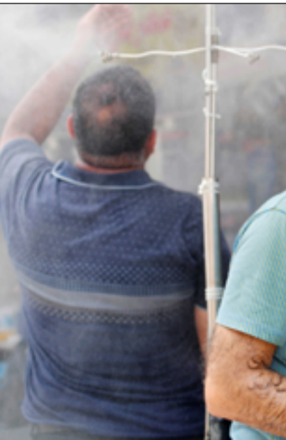
العراقيون يودعون موسمًا صيفيًا قاسياً

يشار إلى أن العراق قد شهد خلال الموسم الصيفي الحالي ارتفاعاً كبيراً في درجات الحرارة بوصولها إلى معدلات قياسية تجاوزت الخمسين درجة، وسجلت بعض المدن أعلى نسب للحرارة على مستوى العالم، فيما اضطرت بعض المحافظات إلى تعطيل الدوام الرسمي لأيام، فيما قررت الأخرى تقليص ساعاته.