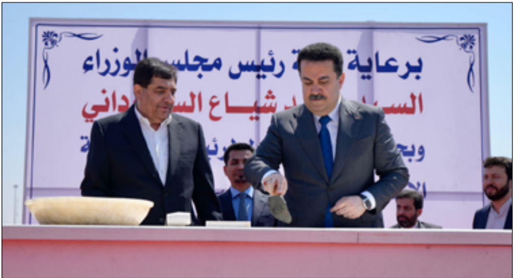
السوداني يضع الحجر الأساس لمشروع الربط السككي بحضور نائب الرئيس الإيراني

وأشار إلى أن "تركيا تنزع الأساليب التشغيل المواطنين في الزيارة الاربعينية مقصود". ووصف عبد الجبار، الربط السككي بين العراق وإيران بأنه "رصاصة الرحمة على ميناء الفاو".