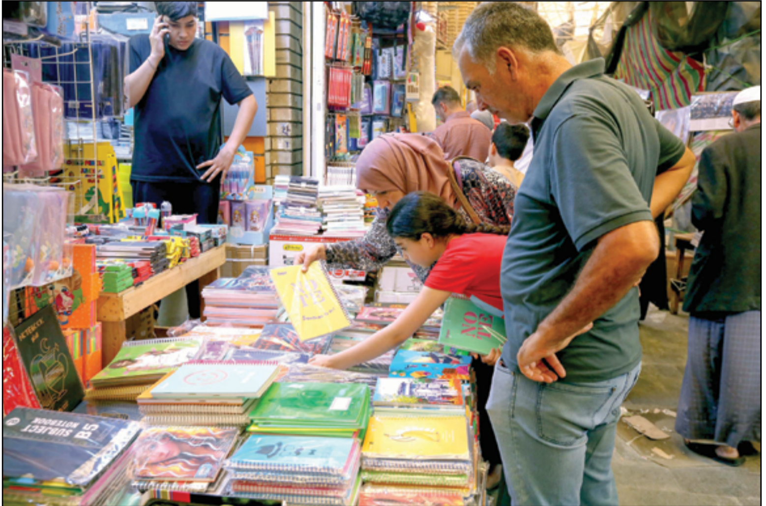
انتعاش بيع القرطاسية في سوق السراي مع بدء العام الدراسي الجديد..

ويقع المواطن العراقي في فخ القروض المصرفية بسبب انه لم يعتد عليها سابقا، فالنظرة للبنوك عند غالبية العراقيين هي أماكن لتأمين أموالهم، وإن