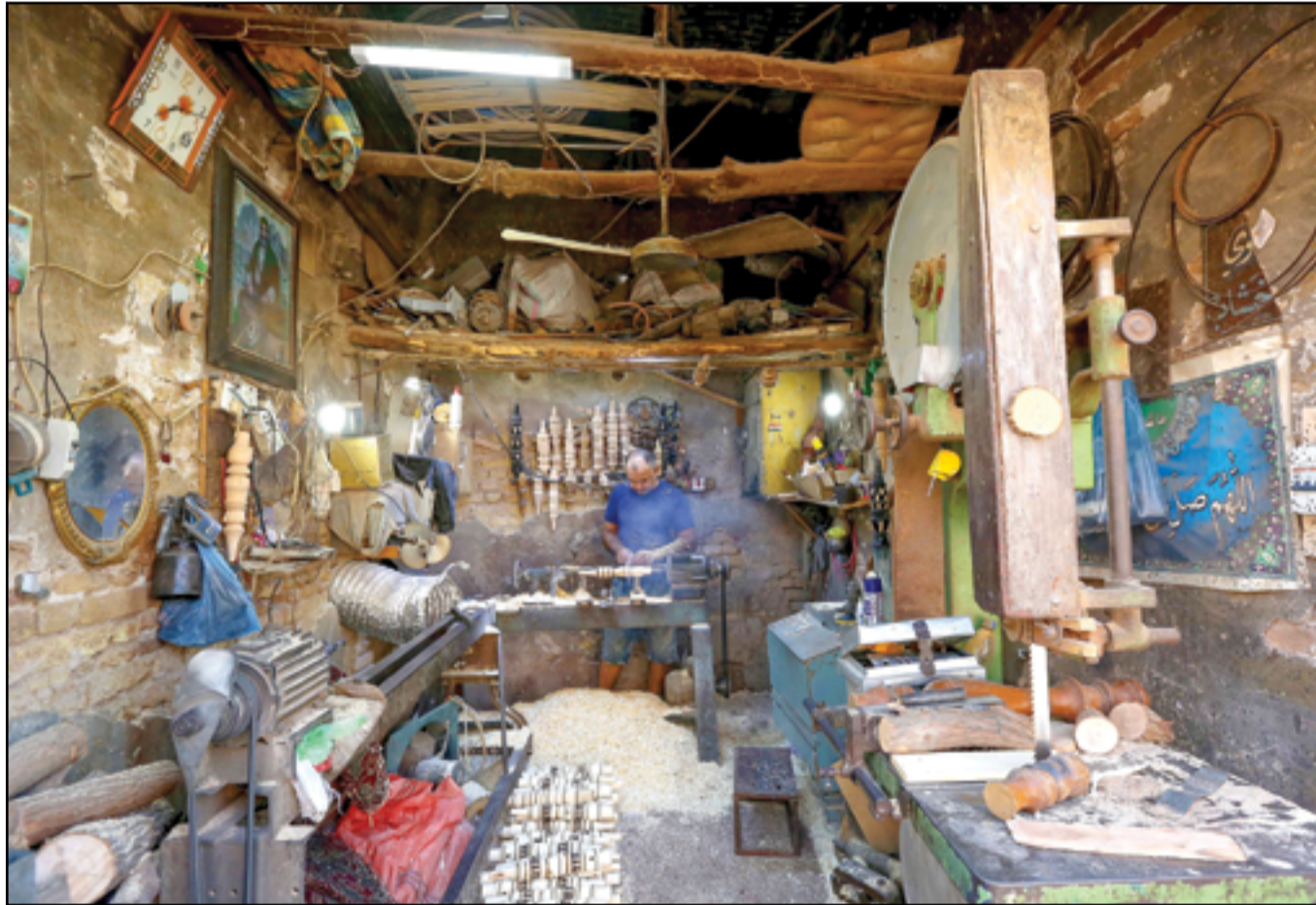
سوق أيوب في الشوكة ببغداد...