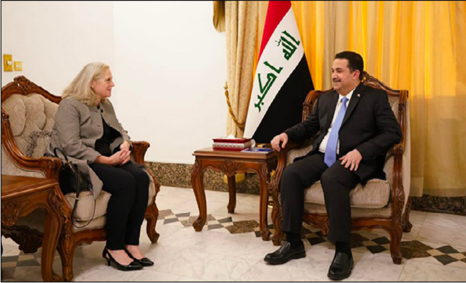
لقاء سابق بين السوداني والسفيرة الأمريكية في بغداد

اللقاء الموسع كان سيأتي بنتائج ايجابية للبلاد