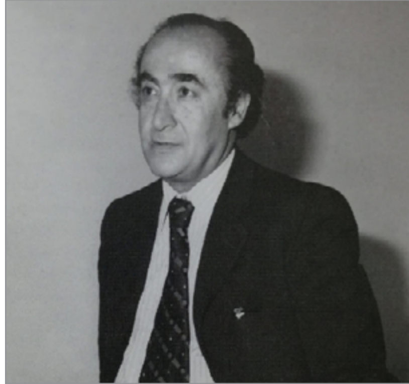
جبرا ابراهيم جبرا