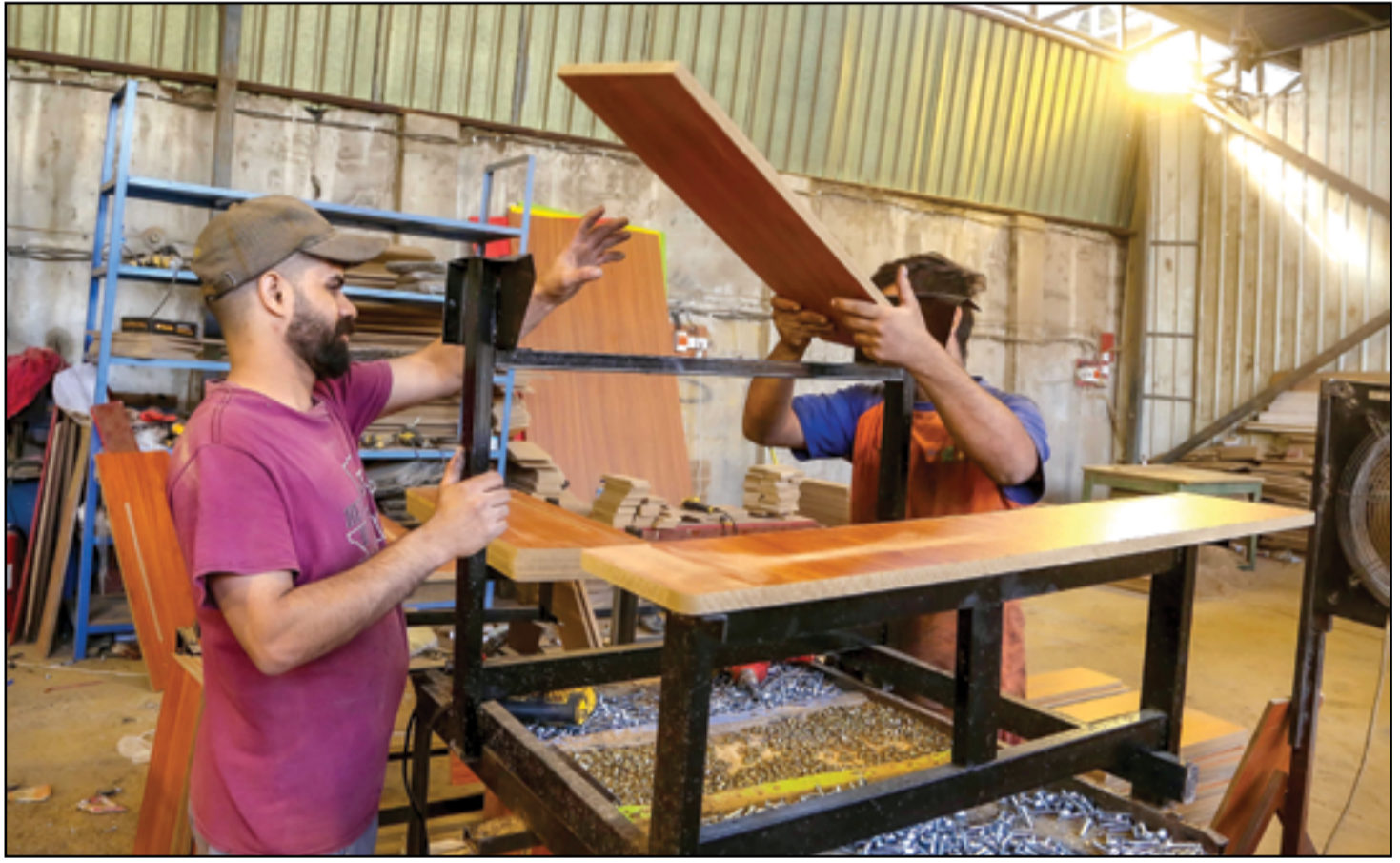
مع بدء العام الدراسي، معمل لتصنيع الرُّحلات المدرسية..

وأضاف: «خلال زيارتي الى بغداد قبل أيام سألني احدكم، هل انتم ملتزمون بالعراق؟ فأجبت ان ذلك يتوقف على سلوككم، الالتزام والولاء للبلد لن يكون بالتخويف والتجويع والكرهية بل يجب ان يكون على أساس المساواة