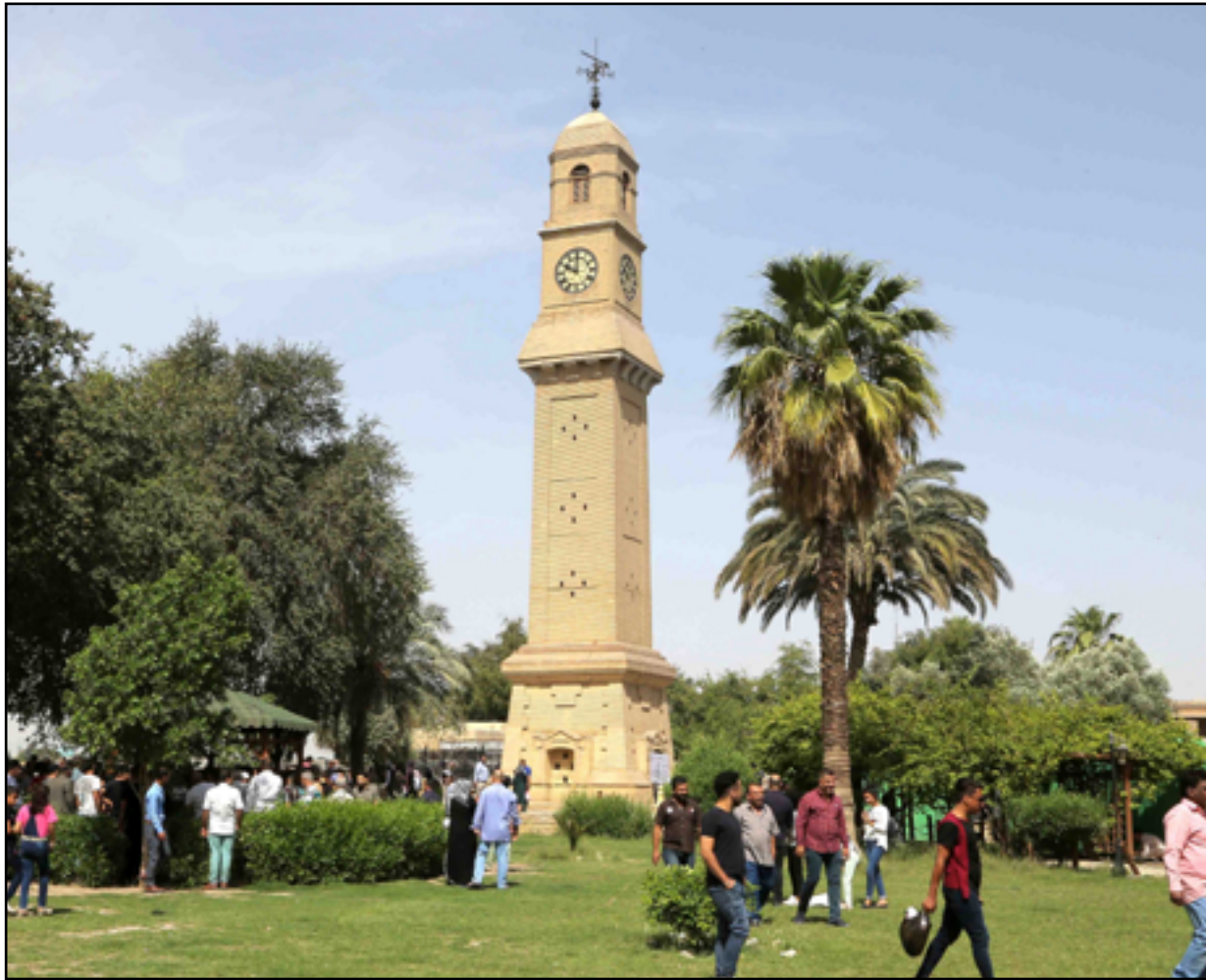
ساحة القشلة إحدى معالم بغداد...

الأكثر شهرة في المنطقة والعالم. ويرى خبراء أن سبب اختراق مقاتلي حماس لحواجر أمنية إسرائيلية، وإطلاق وإبل من الصواريخ من غزة فجر السبت خلال عطلة عيد يهودي، كان عامل التكتك الذي حال دون تسرب تفاصيل الهجوم لإسرائيل وعملائها الفلسطينيين. الخشية من جبهات أخرى وتخشي إسرائيل التي يبدو ان قياداتها حتى الآن، لم تفق من الصدمة المهولة، من فتح جبهات معارك أخرى، لا سيما في الشمال مع حزب الله اللبناني. غير أن الأخير أعلن صباح الأحد، أنه أطلق أعداداً كبيرة من قذائف المدفعية والصواريخ الموجهة، على مواقع إسرائيلية في منطقة حدودية متنازع عليها. جاء ذلك في ما أكد الجيش الإسرائيلي أنه نفذ قصفاً مدفعياً على جنوب لبنان، رداً على إطلاق نار من المنطقة، وفق بيان. وقال الجيش اللبناني أنه ينفذ اعتباراً من أمس السبت، انتشاراً في المناطق الحدودية ويقوم بتسيير دوريات، كما يتابع الوضع عن كثب بالتنسيق مع قوة الأمم المتحدة المؤقتة في لبنان».