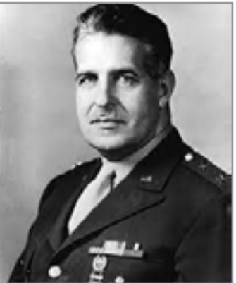
الجنرال ليزلي غروفز

عقب التفجير الأول في التاريخ البشري لقتيلة ذرية بتاريخ 16 تموز (يوليو) 1945 قريبا من منطقة سوكورو بولاية نيومكسيكو إستشهد روبرت أوبنهايمر Robert Oppenheimer، المدير العلمي لمختبر لوس الاموس الذي صُنعت فيه القنبلة، بعبارة من الكتاب للهنودسي المقدس باغافاد غيتا Bhagaavad Gita: "الآن أصبحت الموت، مدمر العوالم". بعد أقل من شهر على ذلك التاريخ تمّت إيداع أرواح ربّيع مليون إنسان بسبب التقنية (الإشارة إلى القنبلة الذرية) التي خلّقت في مشروع مانهاتن: تبحّر البشر، والبنيايات إستحالَت عِبارا، ومَنْ لم يتبحّر من البشر فور إلقاء القنبلة ظل يكابد عناء الإحتضار لأسابيع أو شهور ثمّ مات. ثمة حقيقة لم تتلذّبوا بها وإشهارا مثل الحقائق السابقة: مات مايكرب من خمسين ألفا من الاسرى الكوريين لدى اليابان الإمبريالية بسبب القنابل الذرية الأمريكية.