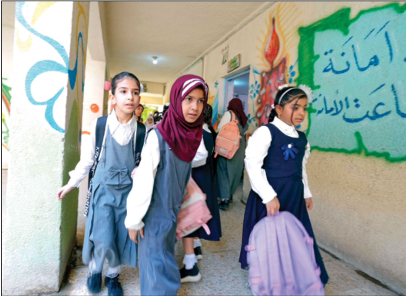
بدء العام الدراسي في عموم البلاد..