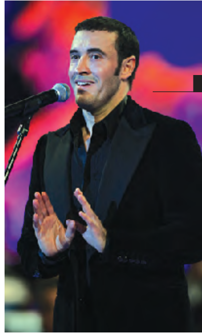
كازم الساهر كان حاضراً في مهرجانات الدوحة للاغنية .