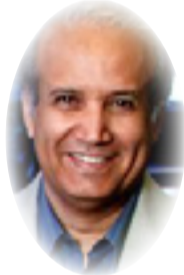
عبد الرحمن الراشد

كذلك، بانفتاح الرياض عليهما معاً في الوقت نفسه. لا بد أن إيران تدرك أهمية الرياض لها، فهي تبع نحو مليون برمبل نطف يومياً إضافي، ويسعر نحو ضعف ما كانت تبع به قبل عام تقريباً، مستفيدة من نجاح التفاهم السعودي الروسي في سوق النفط، ومستفيدة من تساهل إدارة بايدين بعدم تطبيق عقوباتها على صادراتها..