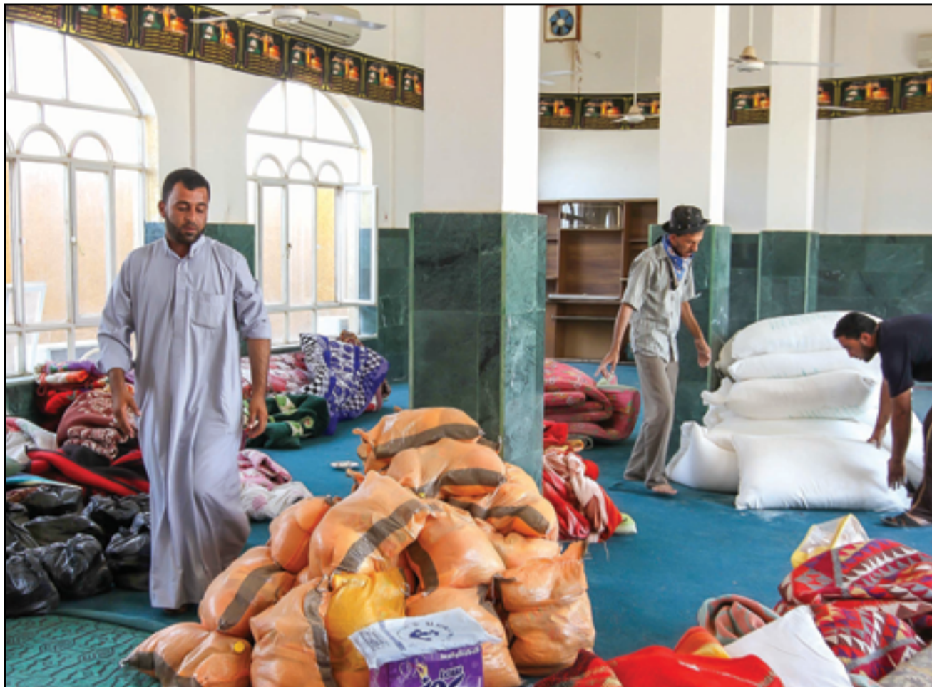
حملة لجمع المساعدات للوائل في غزة.

وتقصف إسرائيل شمالي قطاع غزة قبل عملية برية مرجحة في القطاع. ويرى محللون أن القصف الجوي المكثف الذي تقوم به إسرائيل منذ عملية "حماس" هو تحضير لهجوم بري كبير. من جانب آخر، مع تصاعد التوتر على الحدود الشمالية مع لبنان، قال وزير دفاع الاحتلال الإسرائيلي يوف غالانت إن إسرائيل "لا تريد تصعيداً" مع لبنان حيث ترتفع حدة التوتر ومعها المخاوف من توسع نطاق الحرب. وفي وقت مبكر من صباح الامس، أعلن جيش الاحتلال الإسرائيلي، الحدود مع لبنان منطقة عسكرية مغلقة، مع تكرار الاشتباكات والقصف المتبادل مع فصائل فلسطينية وحزب الله اللبناني. من جانب آخر أكد جيك سوليفان، مستشار الأمن القومي الأمريكي، في لقاءات تلفزيونية، أن إدارة بايدن تتواصل مع جميع الأطراف، لضمان عدم تصعيد الصراع، مبدياً القلق الأميركي من انخراط أطراف أخرى في الصراع، مثل كلاً إيران، وبصفة خاصة "حزب الله" في لبنان. وقال مستشار الأمن القومي الأميركي: "لا يمكن استبعاد أن تختار