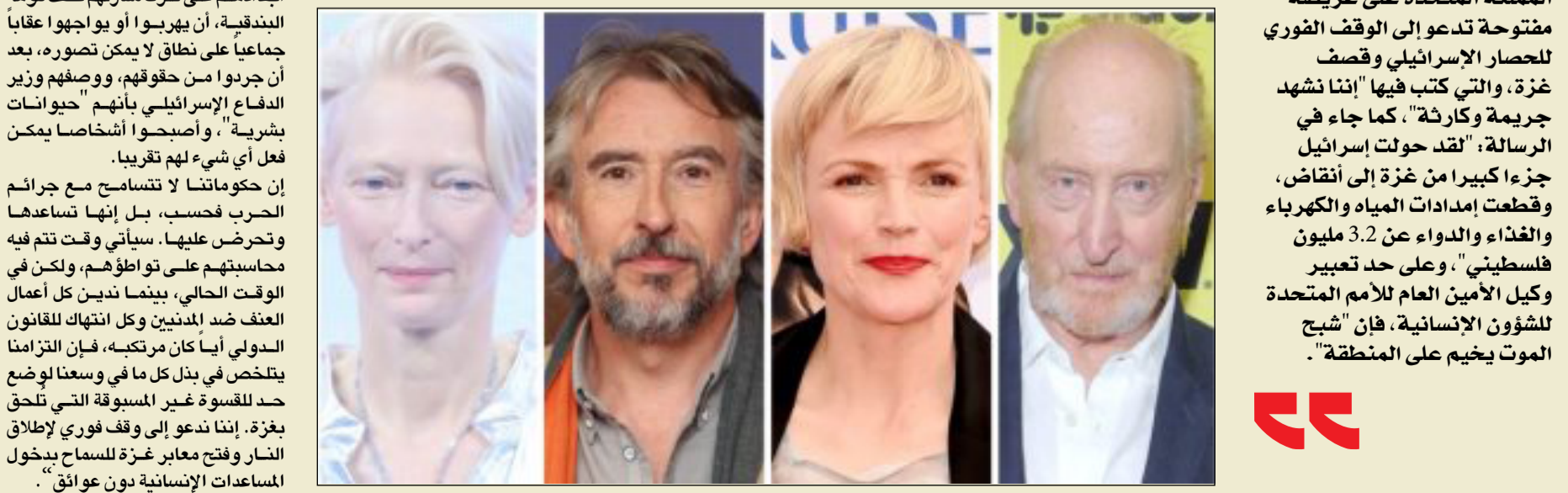
وقطعت إمدادات المياه والكهرباء والغذاء والدواء عن 3.2 مليون فلسطيني، وعلى حد تعبير وكيل الأمين العام للأمم المتحدة للشؤون الإنسانية، فإن "شبح الموت يخيم على المنطقة".

ومن بين الموقعين على العريضة نجوم التمثيل تيلدا سوينتون، وتشارلز دانسر، وستيف كوجان، وميريام مارجوليس، وبيتر مولان، وماكسين بيك. ومن بين الموقعين الآخرين المخرجون مايكل وينتروبوتوم، ومايك لي وأصف كاباديا، والكوميديان فرانكي بويل وجوزي لونغ، والمؤلفون مارينا وارنر، وجاكلين روز، وجيليان سلوفو، وكورتيا نيولاند، والكتاب المسرحيون تانيجا جويتا وأبي سبالين، والشاعر أنتوني أناكساجورو، بالإضافة إلى الفنانين التشكيليين تاي شاني،