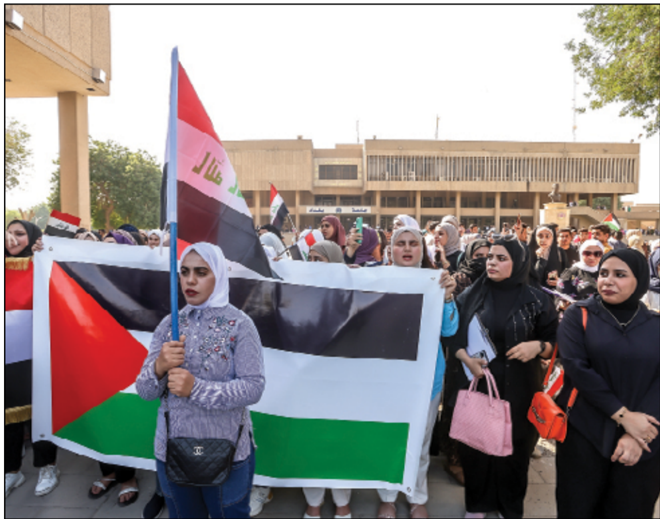
مظاهرات طلابية في جامعة بغداد مناصرة لمأساة غزة..

الخاص، بلغ مركزاً، منها 11 في دهوك و12 في أربيل و15 في السليمانية، بينما بلغ عدد محطات الاقتراع الخاص 2367 منها، 35 محطة بدهوك و36 في السليمانية، 56 للتصويت الخاص». وتابعت الغلاي أن «عدد مراكز اقتراع الناظرين بلغ 35 مركزاً اقتراع، منها 23 بدهوك و7 في أربيل و5 مركزاً بالسليمانية». وفي (14 تشرين الأول 2023)، وجهت