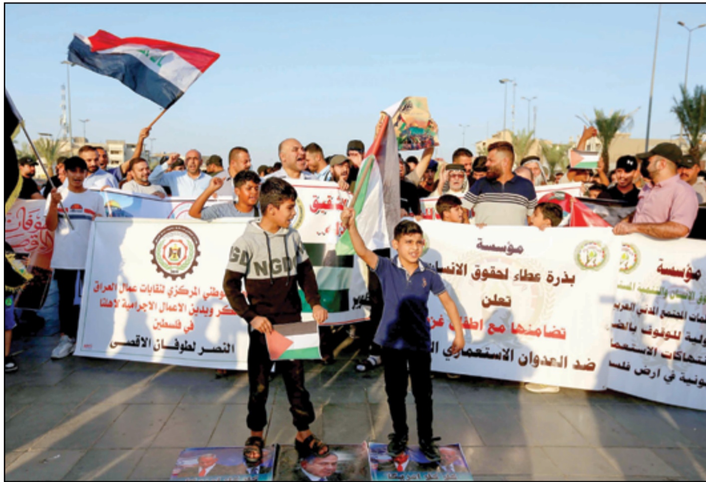
تظاهرات في ساحة التحرير لنصرة القضية الفلسطينية..