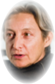
جوديث بتلر ×