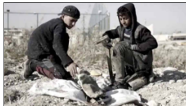
متابعة / المدى

ذكرت قناة "نويتشه فيله" الألمانية أنها ستعرض فيلماً يسجل يوميات ثلاثة أطفال من مدينة الموصل العراقية التي لحقها دمار كبير بسبب احتلال تنظيم داعش لها، حيث يعملون يومياً في جمع البلاستيك والخردة من بين الأنقاض والركام، ما يشكل خطراً على حياتهم.