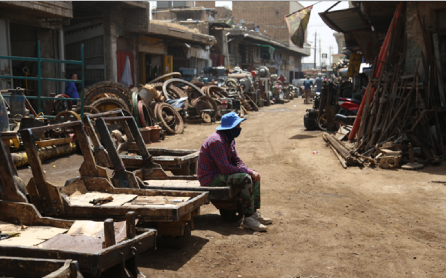
كساد في سوق العمل وارتفاع في الأسعار..