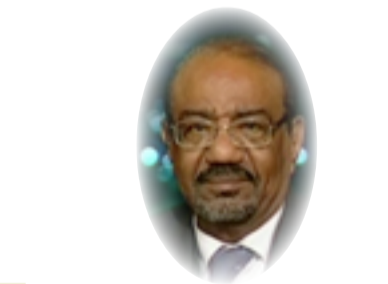
بقلم: نبيل عبد الفتاح

وفي اول انتخابات جرت في العراق ووفق امر سلطة الائتلاف المؤقتة رقم 96(قانون الانتخابات رقم 2004) الذي اشترط ان تكون نسبة تمثيل النساء لا تقل عن 25% وهذا الحد الأدنى أي ربع عدد اعضاء مجلس النواب وقتها حصلت النساء على 87 مقعد من اصل 275 ما نسبته 31.6%. وهذا ما يعني ان نسبة الكوتا التي حددها القانون هي الحد الأدنى أي انه يمكن ان تتجاوز نسبة النساء ال 25% لتصل حتى الى النصف من عدد اعضاء مجلس النواب. ترجحت نسبة مشاركة النساء وتمثيلها في مجلس النواب في الانتخابات التي تلتها لتتذبذب بين صعود ونزول وحسب الظروف المرافقة لكل انتخابات الا انها في انتخابات 2021 كانت الأفضل اذ حصدت النساء 97 مقعدا بفارق 14 مقعد عن الحصة المخصصة " الكوتا" اذ اظهرت النتائج فوز 57 امرأة بوقتئهن التصويتية فيما حصدت البعض منهن اصوات اكثر بكثير من الرجال.