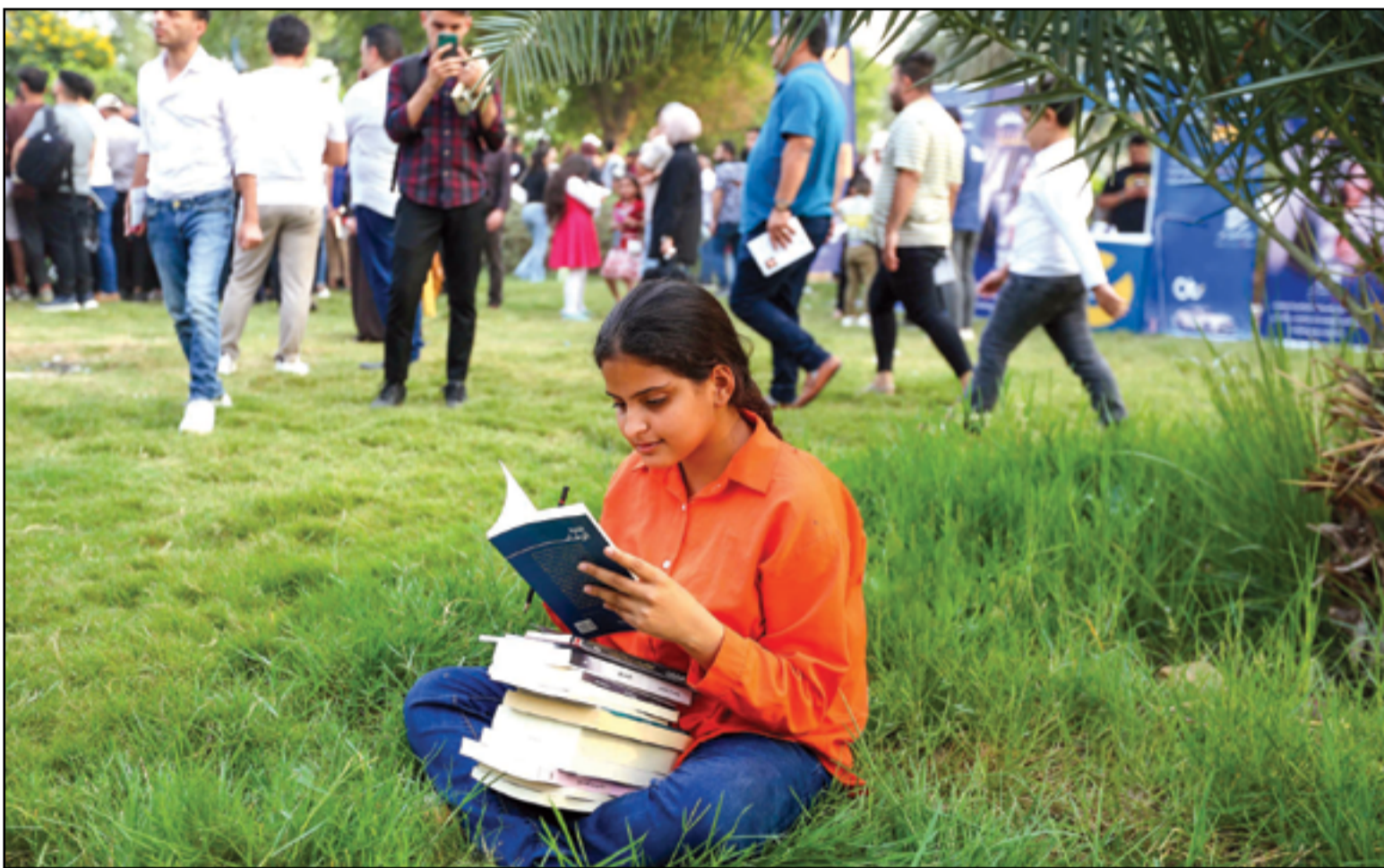
مهرجان أنا عراقي أنا اقرأ...

الإغاثة والأطفال والنساء وحتى الشيوخ في غزة"، موضحا ان "حل الدولتين هو السبيل الوحيد لإنهاء معاناة الشعب الفلسطيني وحل الأزمة المستمرة منذ عقود". وتابع "لا يمكن السكوت على ما يواجه قطاع غزة من أوضاع كارثية تخنق الحياة، ويجب أن تبقى الممرات الإنسانية في غزة آمنة ومفتوحة لإيصال المساعدات بشكل دائم". وأشار الى ان "منع إسرائيل دخول الماء والغذاء إلى سكان غزة جريمة حرب"، مضيفا ان "العلماء سيدين ثمن الفشل في حل القضية الفلسطينية". بدوره قال الرئيس المصري عبد الفتاح السيسي، إن "أهالي غزة يتعرضون للقتل والحصار وممارسات لا إنسانية تستوجب وقفة جادة من المجتمع الدولي"، مطالباً "بوقف فوري لإطلاق النار بلا قيد أو شرط ويجب منع تهجير الفلسطينيين إلى خارج أرضهم". وحذر الرئيس المصري من أن "التخالف عن وقف الحرب في غزة ينذر بتوسعها في المنطقة". من جهته قال الرئيس التركي رجب طيب اردوغان، "استهداف المستشفيات ودور العبادة والمدارس بشكل وحشي". وأضاف ان "إسرائيل تحاول أن تنتقم لأحداث 7 أكتوبر بقتل الأبرياء والأطفال والنساء". من جانبه قال الرئيس الإيراني إبراهيم رئيسي، إن "كل مشاكلنا تحل بالوحدة ونريد أن نتخذ قرارا تاريخيا وحاسما بشأن ما يحدث في الأراضي الفلسطينية". وأضاف ان "من شأن منظمة التعاون الإسلامي أداء دور صحيح يجسد معاني الوحدة والإنسجام وأن اليوم هو يوم انتصار الدم على السيف".