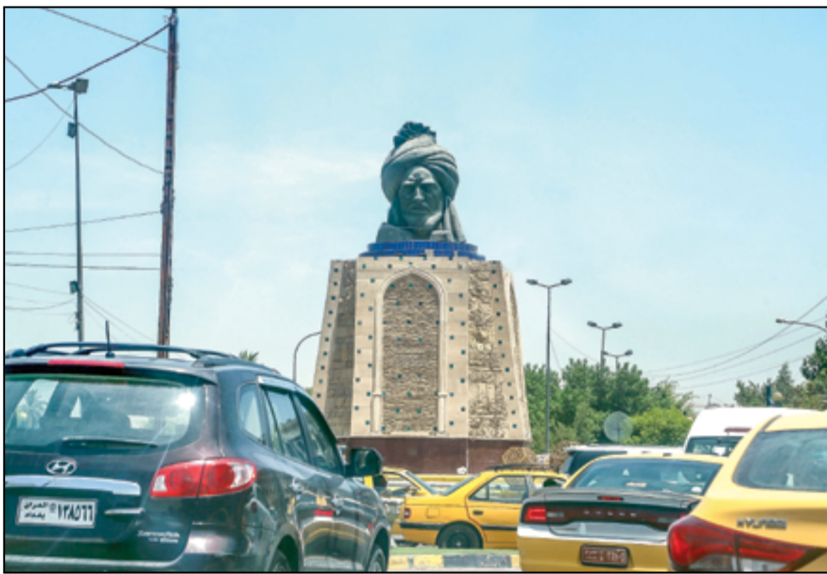
الازدحامات تشل شوارع بغداد...