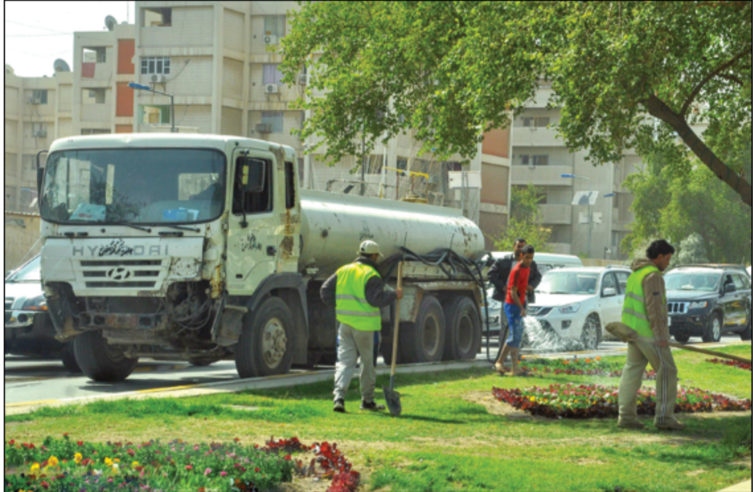
أمانة بغداد تنفذ حملة لزيادة المناطق الخضراء.. عسة: محمود رؤوف

وسّع جيش الاحتلال الإسرائيلي، أمس الاثنين، عملياته في قطاع غزة حيث يزداد عدد القتلى المدنيين الفلسطينيين وسط مؤشرات جديدة على تمدد النزاع في المنطقة. وقال المتحدث باسم الجيش دنائال هاغاري، مساء أمس الاوّل، إن «الجيش الإسرائيلي يواصل توسيع عملياته البرية ضد حماس في كل أنحاء قطاع غزة»، مضيفاً «الجيش يعمل في كل مكان توجد فيه معازل لحماس». من جانبها قالت وزارة الصحة في قطاع غزة، أمس الاثنين، إن ما لا يقل عن 15 ألفاً و899 فلسطينياً، 70 في المائة منهم نساء وأطفال، كانوا ضحايا في الغارات الإسرائيلية على غزة منذ 7 تشرين الأول الماضي، فيما أعلنت «كتائب القسام»، الجناح العسكري لحركة حماس، أمس الاثنين، قصف تل