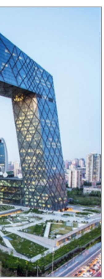
منظر عام OMA، مبنى التلفزيون الصيني، بكين (2008)، المعمار: ريم كولهااس مع فريق مكتب

(بالاشتراك مع مؤلف آخر)، كتابه الذي لاقى ترحيباً واسعاً من قبل جمهوره من النقاد والقراء وهو كتاب "الصغير، المتوسط، الكبير، والاكبر" S. M. L. XL،. (الذي بيع كل نسخه في غضون شهر قليلة)، وجاء بـ 1376 صفحة من القطع الكبير. وقد تضمن الكتاب مجموعة من المقالات ومقترحات من المذكرات وقصص الرحلات والصور الفوتوغرافية والخطط المعمارية والرسومات التي انتجها المكتب طيلة عقدين من السنين السابقة لنشر الكتاب. ويظهر هذا الكتاب الذي طبع مرات عديدة، عزز "ريم كولهااس" حضوره المميز في المشهد المعماري، وكصحفي قديم، وكمنظر لامع، ومعمار قدير عرف جيداً كيف يثير اشكاليات المهنة المعمارية ويسعى الي طرح حلوله غير العادية التي لاطلما ما لغت الانتباه