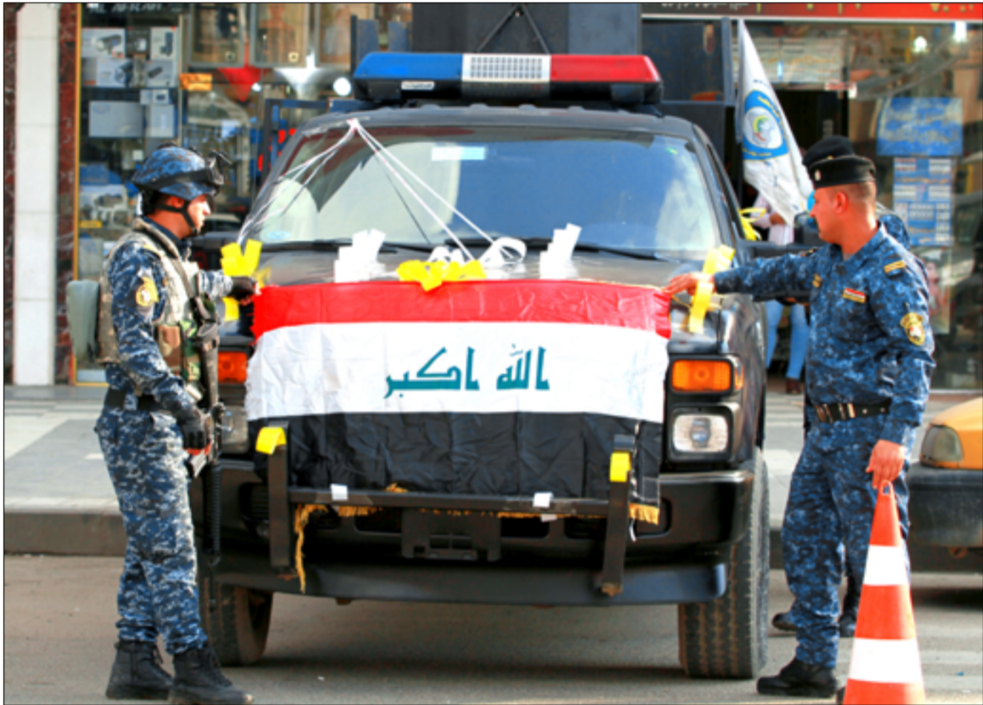
احتفالات بيوم النصر..

"انا تم اتهام كل قوى المقاومة بالهجوم فانها جميعها ستكون مستهدفة، وحينها ستكون ازمة حقيقية وتدخل البلاد في حرب، وفق القيادي الشيعي.