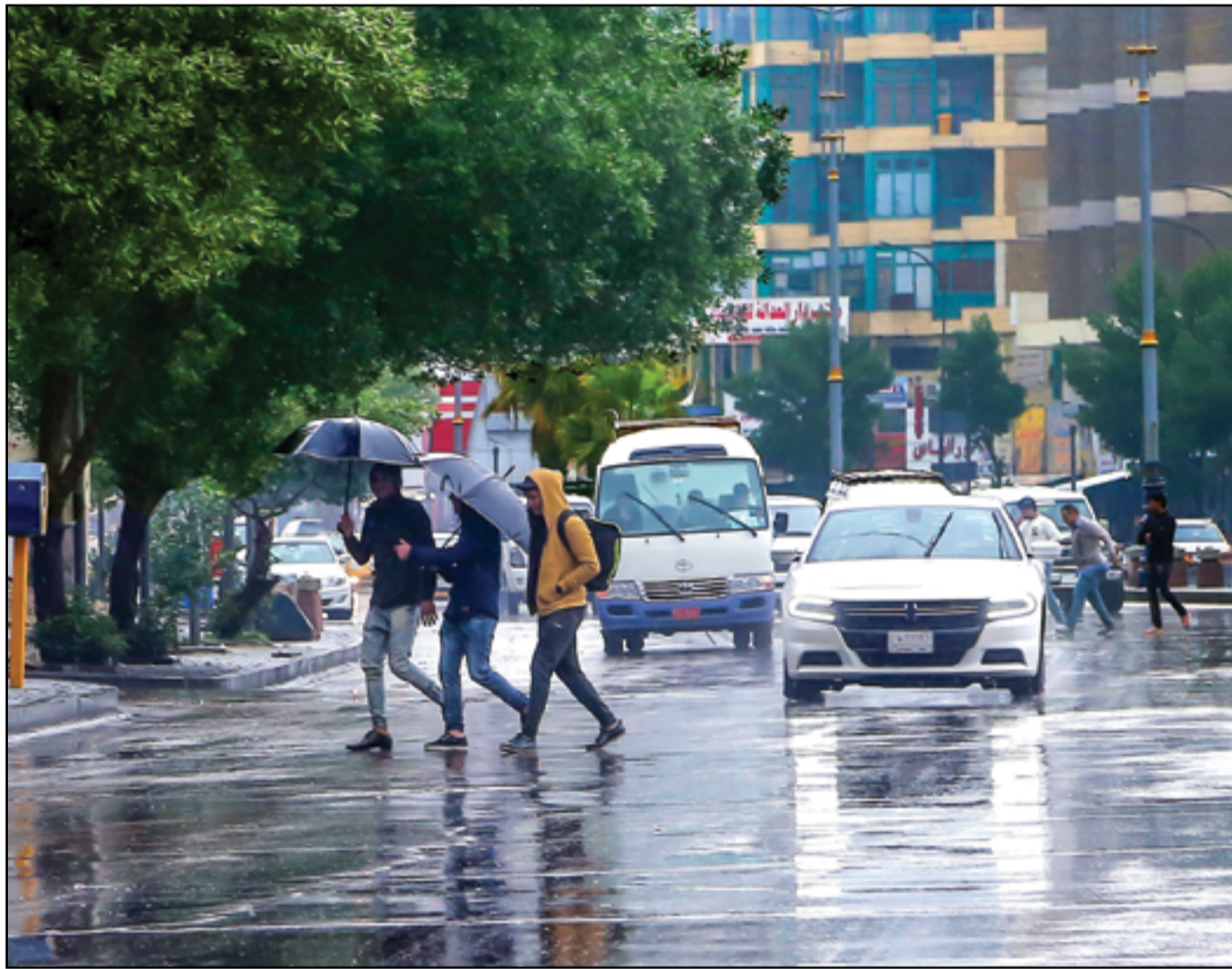
بغداد على موعد مع موسم الأمطار.. عدسة: محمود رؤوف