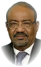
بقلم: نبيل عبد الفتاح

المصرية، ومبدأ مصر للمصريين بدءاً من العرايين حتى حركة 1919 الوطنية الكبرى، والحياة شبه الليبرالية حول المدن الكبرى والانفتاح النسبي على الفكر الأوروبي، مع تشكل جماعية المحامين، والقضاة، وفئة الأفندية، وحركة الأحزاب السياسية لاسيما، حزبي الوفد، والأحرار الدستوريين. من هنا كان الوعي الدستوري والقانوني حول دولة القانون، ومفهوم الأمة، مدخلا للنخبة القانونية –والسياسية-