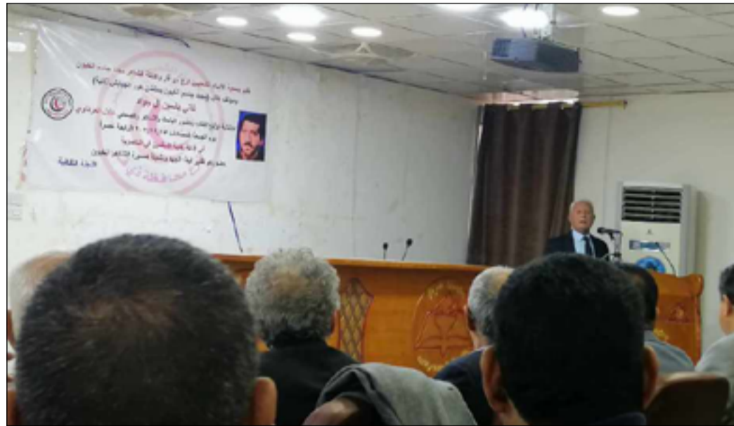
كريم . وبدوره قال الدكتور سعيد الجعفر في ورقة ثقافية قدمها عن الشاعر المحفّي

ويجد الجعفر الذي يعد واحدا من أبرز المختصين باللسانيات ان "مجموع مجيد الخيون وصوره وتشبيهاته ومجازه كلها مأخوذة من دفاء الارض والماء في هذه البقعة الطيبة التي يتفق الكثير من اللسانيين والمؤرخين والاركيولوجيين على أنها هي جنة عدن المقصودة في السرديات اليهودية والمسيحية والإسلامية". وتابع الجعفر " تم يفت مجيد الخيون كونه متلقفا يساريًا حدائقًا ثائرا على التقاليد أن يعرج الى وضع المرأة المسجونة داخل