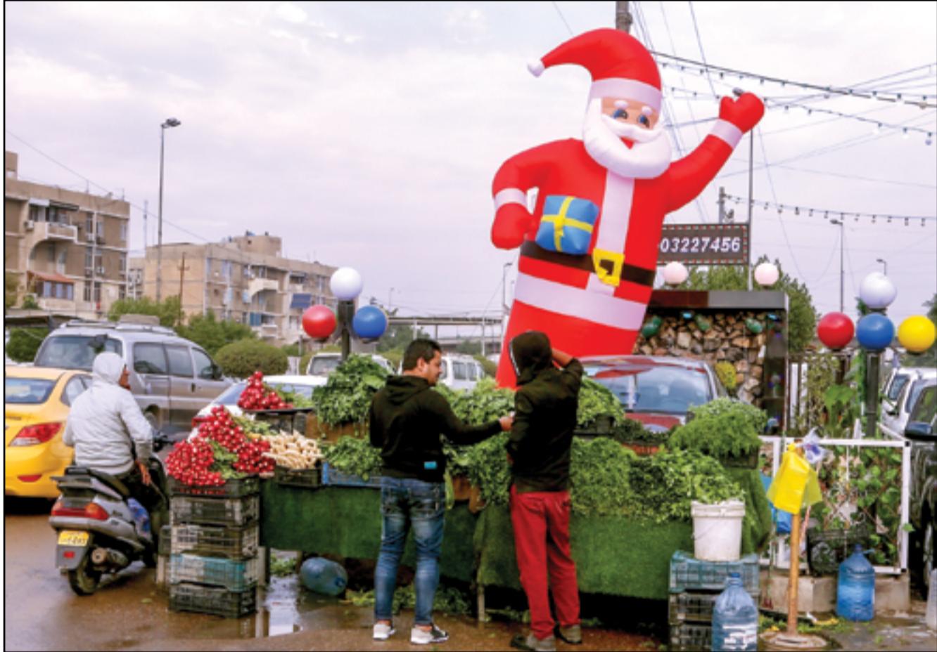
بابا نويل يتوسط إحدى ساحات بغداد... عسة: محمود رؤوف العراق

أعلن مدير دائرة الآثار في دهوك، بيكس بريفكاني، عن مشروع لصيانة مواقع أثرية "مهمة" في المحافظة بتمويل من منظمات فرنسية. وقال بريفكاني، إن "مشروع الصيانة سينطلق في بداية العام الجديد 2024، وسيكون بتكلفة تقدر بمليون و400 ألف