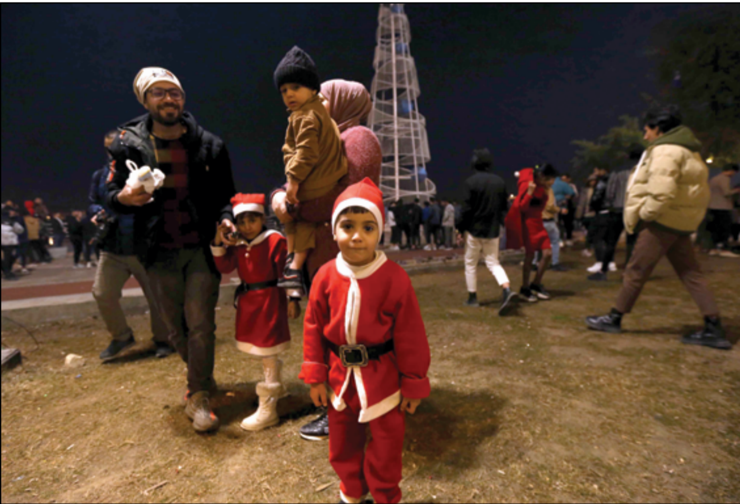
بغداد تحتفل بأعياد رأس السنة الميلادية 2024...

حدد البنك المركزي العراقي، الجهات التي يمكنها استلام حوالاتها الخارجية نقداً بعملة الدولار الأميركي مع حلول عام 2024. البنك قال في بيان له، إن ذلك يأتي «تفصيلاً لمستهدفات السياسة النقدية ولتكمين المصارف من تلبية احتياجات زبائنها من العملة الأجنبية». واعتباراً من أمس الثلاثاء، ستكون الجهات التي يمكنها استلام حوالاتها الخارجية نقداً بالدولار هي «البعثات الدبلوماسية والمنظمات والوكالات الدولية كافة العاملة في العراق، ونسبة 40% من الحوالات الواردة للمصدرين العراقيين ناشئة عن صادراتهم إلى الخارج». بالإضافة إلى «منظمات المجتمع المدني غير الحكومية المسجلة في الأمانة العامة لمجلس الوزراء، في حال اشترطت الجهة الأجنبية المانحة دفع مبالغ الحوالات