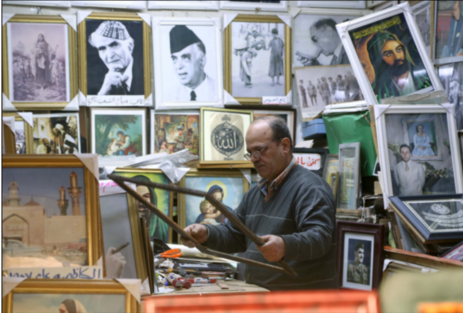
مينة بيع الصور التاريخية تزدهر في بغداد...