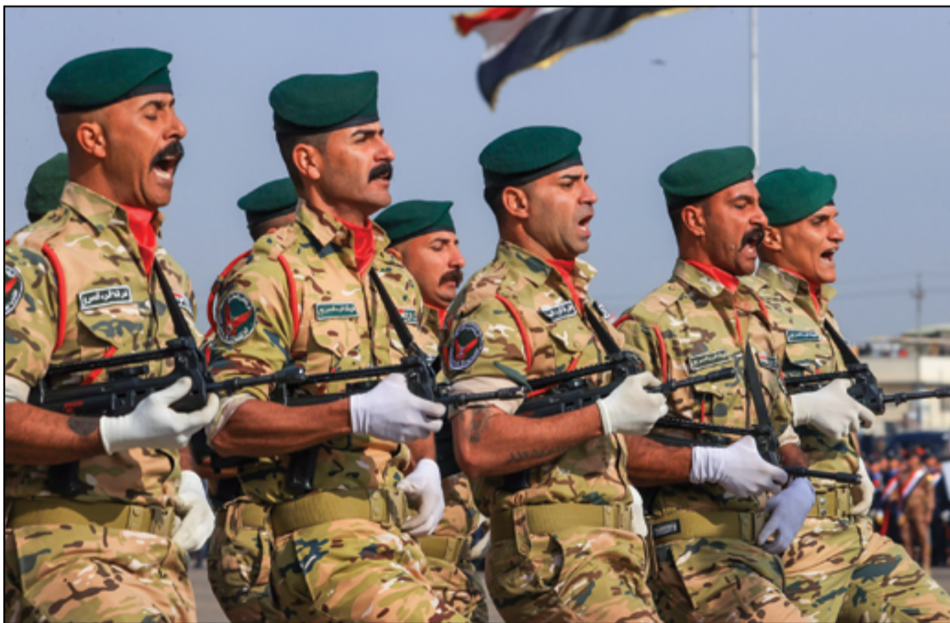
جانب من الاحتفال بعيد تأسيس الشرطة العراقية.. عدسة: محمود رؤوف