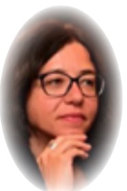
فرجينيا سونر ترجمة: عدوية الهلالي

على خلفية زيادة بنسبة 30% في أسعار المياه خلال العقد الماضي، ويمكن أن يسبب الوصول إلى المياه وتوترات عبر الحدود. وتتهم الدولة العراقية الحكومة التركية بانتظام بتقليص تدفق نهر دجلة والفرات، وتعمل تركيا على تسليح الممرات المائية في سياق الصراع مع سوريا. ومنذ نهاية عام 2020، خفضت البلاد تدفق نهر الفرات بنحو 60%. وقد في سوريا وتفاقم مشكلة الوصول إلى المياه لعدة ملايين من العراقيين. وتؤدي آثار تغير المناخ إلى تفاقم العديد من عوامل زعزعة الاستقرار التي تعاني منها المنطقة كالمشاكل الاجتماعية والاقتصادية، والتوترات والصراعات داخل الدول وفيما بينها، ووجود الجماعات المسلحة وغير التقليدية، والهجرات الداخلية والخارجية، وتقلب أسعار الغذاء والمواد الغذائية. وانعدام الأمن، وضعف الإدارة، وانعدام الثقة في السلطات العامة، وما إلى ذلك.