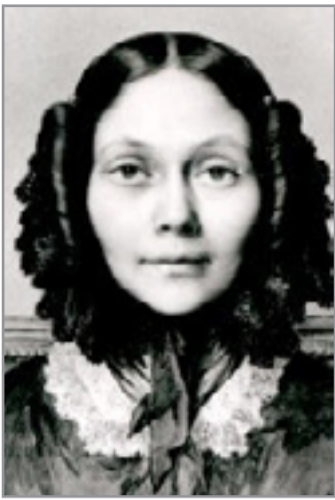
الكونتسة دي سيجور

ومن الكتب المؤلفة في القرن السادس عشر (خواطر حمار) للكونتسة دي سيجور(1899- 1874) ونشر بالفرنسية عام 1532 وبالإنجليزية عام 1912 وهو عبارة عن رواية غير واقعية تتضمن سردا انثويوغرافيا يحكيه سارد ذاتي هو الحمار ويبتدئ برسالة يعيئها الحمار إلى سيده قائلاً:(إلى سيدي الصغير هنري.. كنت إذا نكرت الحمير تحدثت عنها باحتقار لها جميعا فألجأ أن تعرف عن علم حقيقة الحمير ويصدق حكمك عليها ككنت هذه المنكرات واهديتها إليك، وسترى يا سيدي العزيز كيف كنت أنا المسكين ورفقائي من الحمير نغاني من الناس قسوة المعاملة.. وستعرف كيف أنني كنت شقياً في عهد حدثتي) وتتعم المؤلفة تقاليد السرد العربي، فهي تظهر بوصفها الحكاءة التي تنقل للقارئ قصة ساردها مفصول عنها(ساقص عليك في هذا الكتاب بعض الأنوان التي مثلتها معهم في زمن الصبا وعهد التبسيبة) مع توظيف القطع والوصل والأحلام والخيلية والحوار والتوالي كما أن كل قصة مستقلة بنفسها ولكننا أيضاً تكمل ما قبلها من قصص وتنتم الذي بعدها. وكلما تقدمنا في القراءة، تزداد الحكبة واقعية لاسيما حين يلتقي الحمار بالكلب ميدور -وحين يعمل الحمار عند طبيب وتلاطفه الإينة باولين وتحبه(وكنت أنا أحبها أيضا وارثي لها وإذا كانت قريبة مني فأنتي اجتهد ألا أتحرك خشية أن أخصفها برجلي) وعلى شاكلة كليلة ودمنة يستمر السرد الانثويوغرافي لكن بعمومية استعمال ضمير الأنثا فكان الحمار هو السارد والبطل معا، مسترجعا ما لاقاه من متاعب في السوق ومخاطر في الغاية ولطف وقسوة في المزرعة مظهرا مشاعر نفسية من قبيل ضجره وهو بلا عمل أو عناده وهو يضرب بالسوط، وبسبب ما اكتسبه الحمار من خبرة صار يعرف ب(الحمار العالم). واستمر يدافع عن بني جنسه إلى