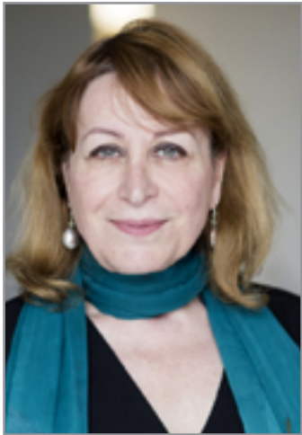
انغام كجه كجي

بمنزلة المعجزة، الإيقاع وقوام الكون برأي فيثاغورس هو الإيقاع والعدد.لايقع تصميم العالم الإبداعي خارج هذه القاعدة.ولولا الإيقاع لبدت النصوص متبعثرة وغير متناغمة.ومن المؤكد أن الإيقاع الذي ينظّم عليه العمل الإبداعي يعكس مايسكن في أعماق الكاتب من المشاعر المتكونة لإيقاعه يقول دافيد لوبورطون "إن إيقاع كل شخص هو إيقاع موسيقاه الباطنة والأنشودة الحميمة التي تحرك خطاه" فكل عمل فني إنما هو إيقاع واحد فريد في مذهب الشاعرة الرومانسية "فيتافون أرنيم". لايتسمر بول أوستر على الطاوله مترقبا لإهام الكتابة بل يطيب له أن يذرع غرفته جبة ونهايا إذ يجد في ذلك ترويضاً للأفكار والكلمات لأن هناك نوعا من الموسيقى داخل الجسد ويعني بها موسيقى اللغة ولاتولد الأفكار بنظر أوستر إلا خلال التجوال هنا يتقاطع رأيه مع مقاله نيتشه بأن الأفكار التي لاتأخذ بالتلايين أثناء المشي لاتجدر أن تتفق بها.يذكر بول أوستر في إطار حديثه عن العلاقة بين الكتابة والمشي ماقرأه في مقال للشاعر الروسي "أوسيب مالديشام" عن شعر دانتى وتناغم إيقاعته مع إحساس خطوات الإنسان حينما يتجول في الأجزاء.ربما أن هذا الترابط بين الحركة الجسدية والكتابة هو مايجعل أوستر منطلعا إلى العمل الرشيق وإذ يقول بأنه كلما نجح في تخليص النص من الفوائض اللغوية يزداد شعورا بالسعادة. فالكتابة في مهب بول أوستر شكل من أشكال التأليف الموسيقي للأصوات والنسبة إليه أن الفقرة هي وحدة التأليف في العمل الروائي