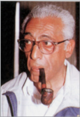
عبد الرحمن منيف