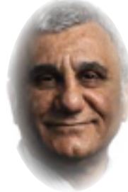
روبرت استيبانيان *

علاوة على ذلك، يوجد في العراق أحد أكبر أعداد النازحين في المنطقة. وقد أدت رداءة نوعية الخدمات الصحية وغياب خدمات الرعاية الاجتماعية الكافية إلى خلق أزمة إنسانية كبيرة، خاصة منذ انتهاء الصراع ضد تنظيم الدولة الإسلامية (داعش) في عام 2018. وقد أدى غزو داعش الكارثي إلى نزوح أكثر من 6 ملايين عراقي بين عامي 2014 و2017. وفي عام 2017، بقي ما يقرب من 2.5 مليون عراقي في حاجة ماسة إلى الرعاية الصحية الأساسية وخدمات الصحة الاجتماعية والعقلية. لقد تطورت هذه الأزمة من أزمة رعاية صحية حادة في المناطق التي كانت تحت سيطرة داعش إلى أزمة طويلة الأمد.