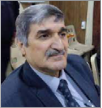
الشاعر أمير الحلاج

واحدًا هو (السائح) ليمثل دعاية مضادة لما هو شائع، في دلالة واسعة للتمرد على النسق المؤسساتي/ الاستهلاكي الذي تكرسه الاعلانات وmedia الشهريّة، على أن هذه الصيغة التعبيرية توأزي ما أشاعته بعض الدراسات الثقافية لنقد (الفنتش) أي ربط السلعة بالرغبة أو الغريزة من خلال الإعلان التجاري. إن النماذج التي وظفت السيرة الذاتية في الشعر العربي عموماً لا تعد ولا تحصى، لكن التجربة السيروية للشاعر العراقي تميزت بكونها الأكثر عمقا، بسبب الصراعات الدائرة التي مست مباشرة حياة المواطن، كما تميزت بالجربة العراقية بكونها مزجت مزجاً وجودياً بين الذات الشاعرة والذات بوصفها سيرة شخصية والواقع اليومي الذي لم يكن واقعاً طبيعياً، أو ساكناً أو مهانداً، فقد كان تحدي الواقع المائل من أبرز التحديات الطبيعية البشرية، مستغنياً عاملاً خارجياً