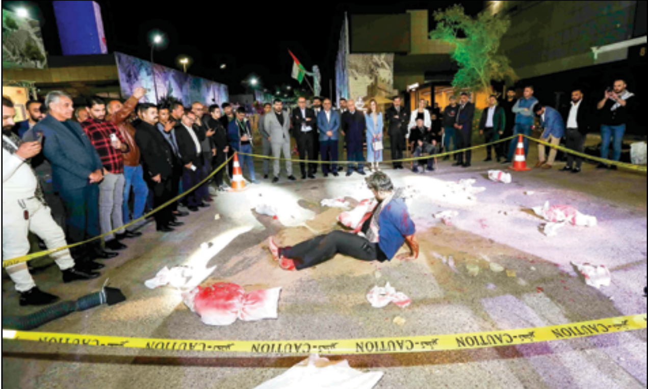
من العروض التي قدمت ضمن فعاليات معرض العراق الدولي للكتاب بنسخته الرابعة...

بإستمرار العمل في المشاريع على مدار اليوم لم تكن تتحقق إلا بوجود جهد أمني يرقى لمستوى التحديات"، مشيراً إلى أن "هناك من يريد عرقلة الجهد الخدمي وعمليات الإعمار والتنمية"، مؤكداً أن هذه المحاولات لن تنفي الحكومة عن المضي في خطط البناء والإعمار وتقديم الخدمات". ووفقاً للبيان، شدد السوداني على "ضرورة توفير كل المستلزمات والتكنولوجيا الحديثة التي تمكن الأجهزة الاستخباراتية من تنفيذ عملها بشكل محترف، وبما يعزز الأمن في جميع المناطق".