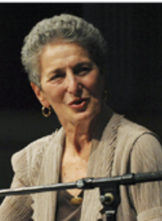
الناس العاديين وليس المتخصصين فقط.

إلا أن الحبل اللوهمي الذي كان يلفك على عنقي فلاڤيمير وإيسترأغون هو حبل الانتظار، وهو أقسى وأشد مرارة، لأنه يمثل الخضوع والعبودية لكافة الأفكار والمعتقدات والأوامر التي تظن أنها تشكل ماهية وجودنا البشري. كذلك غياب غودو لا يحفز على إنتاج قيم علينا وجود أصيل