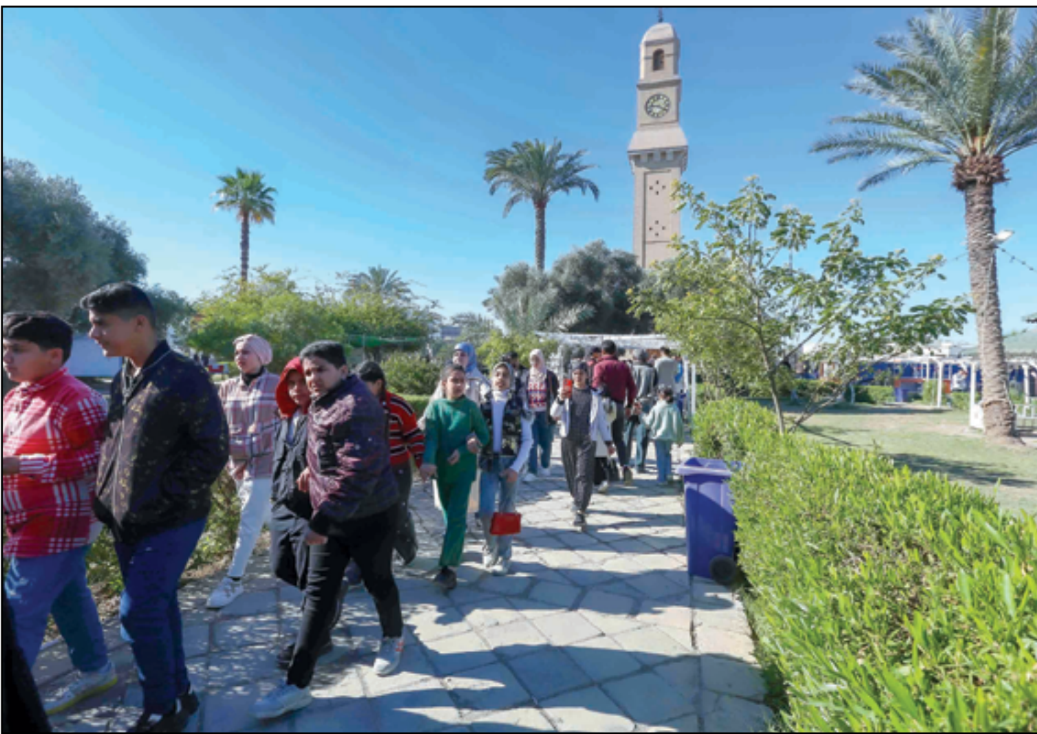
سفرات مدرسية الى القشلة في شارع المتنبي.. عدسة: محمود رؤوف

أصدرت منظمة بيت الحرية أو "فريدم هاوس" تقريرها السنوي (حرية العالم) مؤشر الحرية العالمي 2024، الذي يقيم درجة الحرية السياسية والحرية المدنية في 210 دول، فيما احتل العراق المرتبة التاسعة عربياً بحسب المؤشر. ووفقاً لتقرير هذا العام، تراجع مستوى الحرية العالمية للعام الثامن عشر على التوالي في عام 2023، وكان اتساع وعق التدهور شاسع، وتضاءلت الحقوق السياسية والحرية المدنية في 52 دولة، في حين قامت 21 دولة فقط بإجراء تحسينات، وساهمت الانتخابات المعيبة والصراع