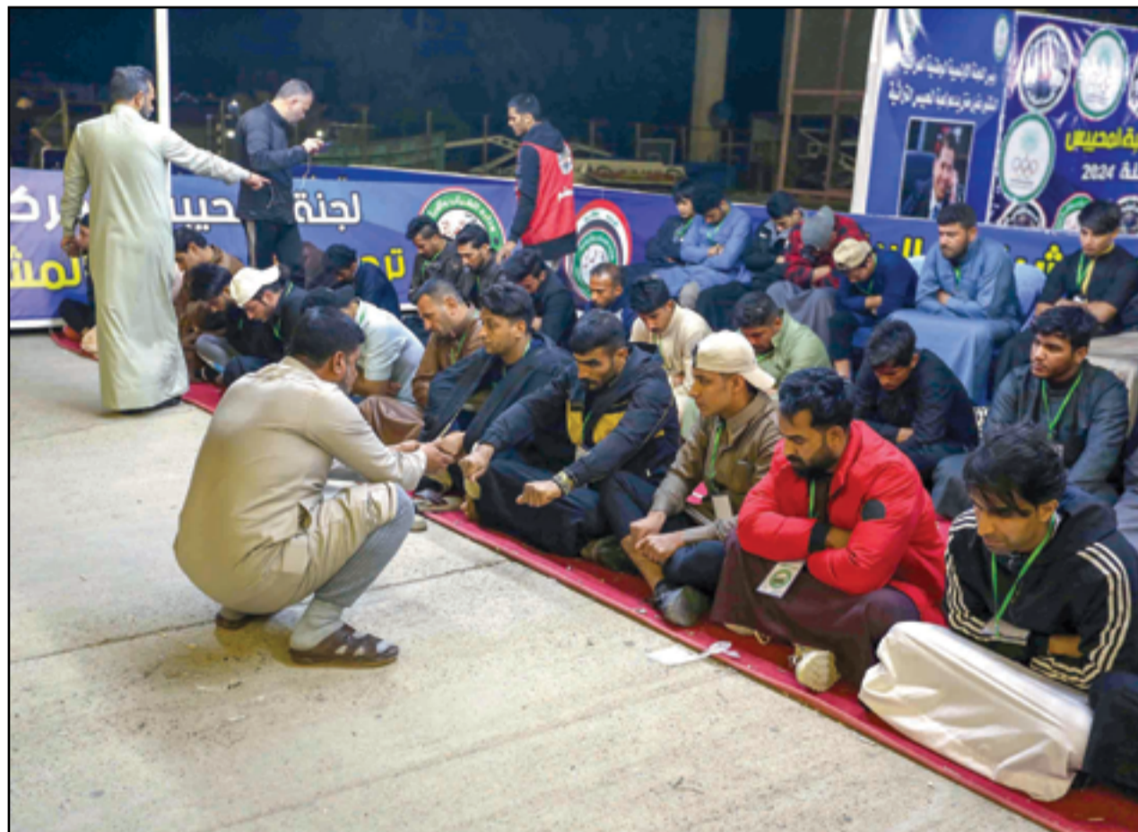
البطولة الرمضانية للعبة "المحبيس" المقامة في ملعب الشعب..

قال المدير العام للوكالة الدولية للطاقة الذرية رافائيل غروسي، أمس الاثنين، إن طي صفحة الماضي من أولويات العمل مع العراق، مشيراً إلى أن الوكالة تدعم إنشاء برنامج نووي سلمي هناك. وذكر غروسي في مؤتمر صحفي