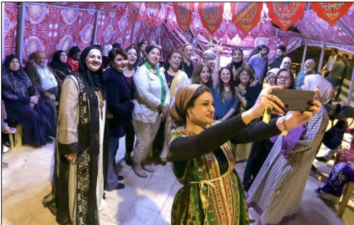
خيمة رمضانية نسائية في شارع المتنبي...

أكد رئيس حكومة إقليم كردستان العراق مسرور بارزاني، أن إقليم كردستان أوفى بجميع التزاماته الدستورية ولا يمكن تبرير أي انتهاك لحقوقه. ونكر مكتب بارزاني في بيان تلقته (المدى)، أن "رئيس حكومة إقليم كردستان مسرور بارزاني استقبل، سفيرة الولايات المتحدة لدى العراق الينا رومانوسكي". وشدد الاجتماع بحسب البيان، على "ضرورة احترام الكيان الاتحادي لإقليم كردستان، وإرسال حقوقه المالية عبر حكومة الإقليم، بالإضافة إلى مناقشة سير عملية (حسابي المصري)". وأكد بارزاني، أن إقليم كردستان أوفى بجميع التزاماته الدستورية، وبالتالي لا يمكن تبرير أي