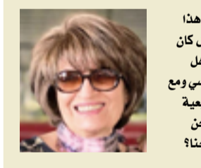
كلنا نسخة من ريان. كلنا سنستأسل يوما ما هذا التساؤل: هل عشت الحياة التي استحق؟ هل كان بمستطاعي عيش حياة أفضل ولم أفعل؟ هل سأعاندُ هذه الحياة وأنا في خصومة مع نفسي ومع البشر جميعا أم سأعتبرُ رحيلي واقعة طبيعية في حياة محكومة بقوانين لا تحيد؟ هل نحن منصالحون مع وضعنا أم تملا المرارة أرواحنا؟

وهذا ما نتكشفه في هذا العمل، أنت متحكم في نفسك، ولكلك غير متحكم في العمل تماماً؟ هناك الدراية التي ترجع إلى الروايات السابقة، ولكن هناك أيضا فكرة الاستمرار في الاستمتاع بنفسك ولهذا عليك أن تستمر في مفاجأة نفسك، وتحمل المزيد من المخاطرة، لترى في النهاية إلى أين سيقدونا كل شيء؟ على أية حال، عليك دائماً في الصباح، عندما تفتح جهاز الكمبيوتر الخاص بك، أن تكون متحمساً قليلاً بأن تقول لنفسك: "أه، ها أنت ذا، ماذا سيحدث لي اليوم خلال الحياة التي أعيشها بشكل غير مباشر من خلال شخصياتي؟"