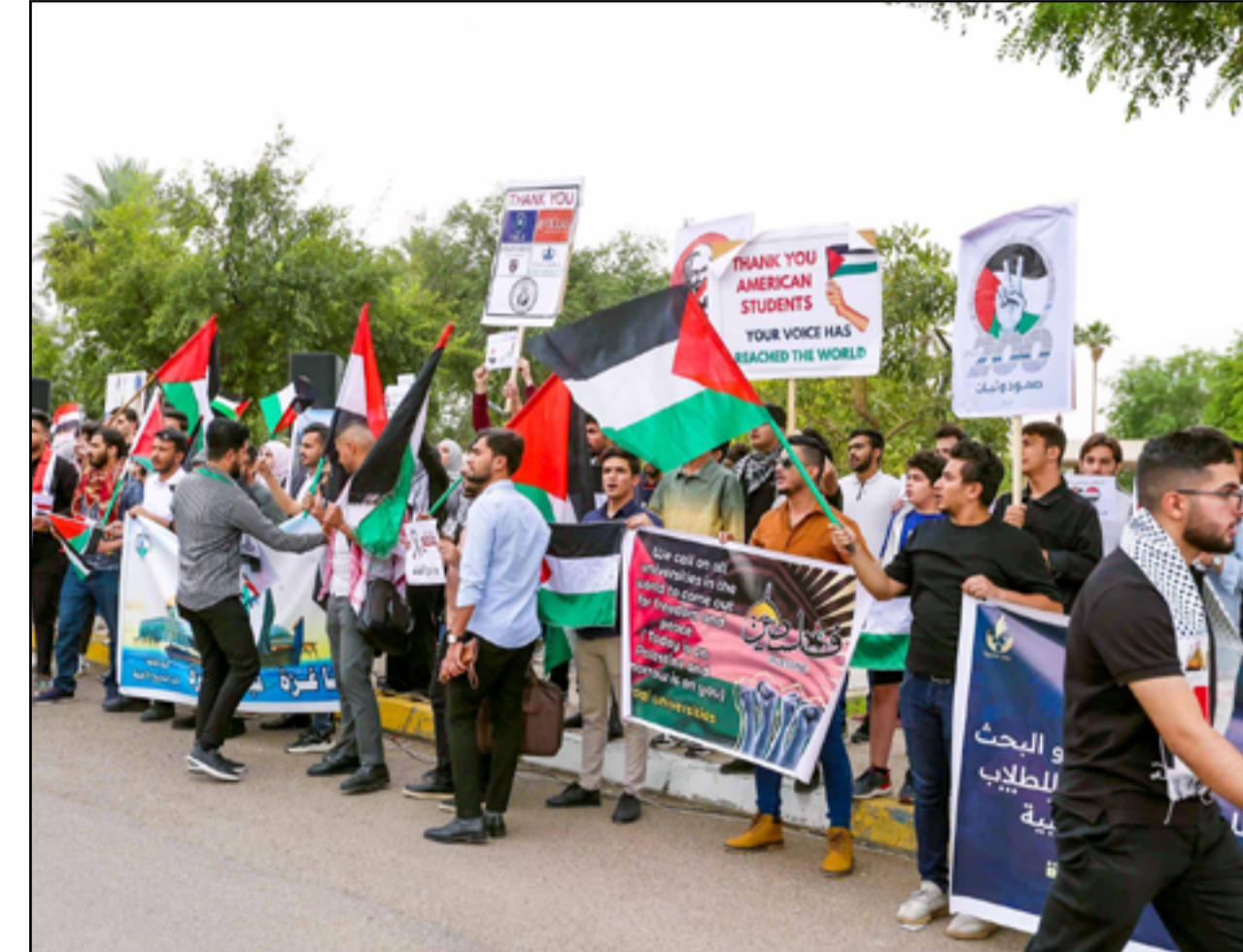
طلبة جامعة بغداد ينضمون وقفة احتجاجية امام قوس بوابة الجامعة لنصرة اهالي غزة ويطالبون بمقاطعة المنتوجات الداعمة لاسرائيل..