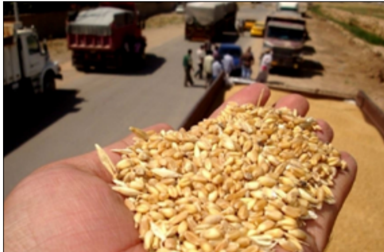
خلال موسم التسويق والتشديد في إجراءات دخولها عبر المعابر بالإضافة الى التدقيق في كل الشحنات واتخاذ سلسلة إجراءات حازمة حيال من يثبت تسويق حنطة معفزة او حاييل الى مراكز وزارة التجارة".

وأشار السلمي الى ان "هناك تحركاً آمناً واسعاً من أجل كشف مافيات الفساد وبالفعل هناك خطوط لكن لا يمكن تحديد هويتها الا بانتظار نتائج التحقيقات من قبل الجهات المختصة لكن يمكن القول إن ما كشف مهم وسيعزز من مبدأ مكافحة الفساد وإيقاف هدر المال العام والتلاعب بقوت الشعب العراقي". وكان عضو مجلس النواب، امير المعموري، كشف أمس الأول عن مضمون ما أسماها بـ"الحنطة باء" لإيقاف مافيات الحنطة في العراق. وقال المعموري ان "مافيات الحنطة تجني أموالاً من قوت الشعب العراقي تصل الى مئات المليارات من الدنانير في موسم تسويق المحصول من خلال الالتفاف والتلاعب بتسويق حنطة معفزة وأخرى حاييل لكسب الفرق في الأسعار". وأشار الى، انه "سيتم اعتماد خطة جديدة للإصلاح تتمثل بتشكيل لجنة رقابية على مستوى عال من الخبرة بدعم نيابي تقوم بأخذ عينات من شاحنات الحنطة لفحصها في مختبرات وزارات أخرى للوقوف على حجم المخالفات". واكد المعموري ان "الخطوة تأتي لمنع حصول أي تلاعب ورصد أية مخالفات، لافتاً الى ان "أي تلاعب في قوت الشعب لن يكون معه أي تهاون وتعتبر كل المخالفات هي شبهات فساد سيتم محاسبة المتورطين بها وفق القانون". واصدر رئيس مجلس الوزراء محمد شياع السوداني في (٣ أيار ٢٠٢٤) ٤ إجراءات فورية كان أبرزها تغيير حنطة البذور وبنسبة ١٠٠٪، ومنع دخول حنطة الحاييل والمصابة الى الساييلو من أجل منع المتاجرة بها، وحجز الحنطة المعفزة والمصبوغة عند مسكها واعتبارها جريمة واستيلاء على المال العام لمن يقوم بذلك ونقله الى المحاكم المختصة".