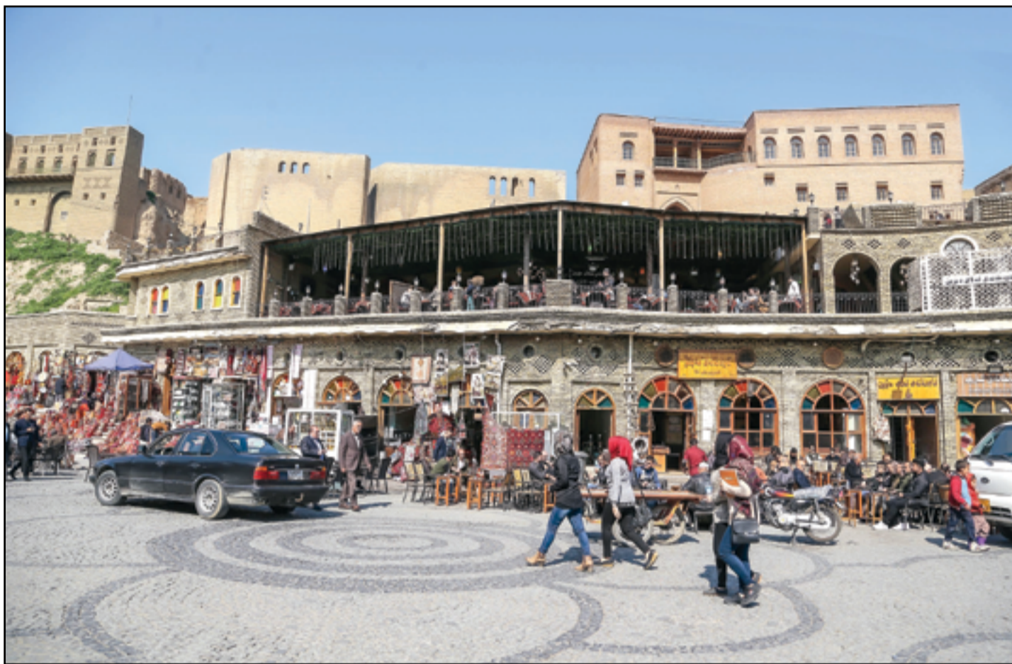
مجدو أشهر مقاهي أربيل التراثية .. عدسة: محمود روفف