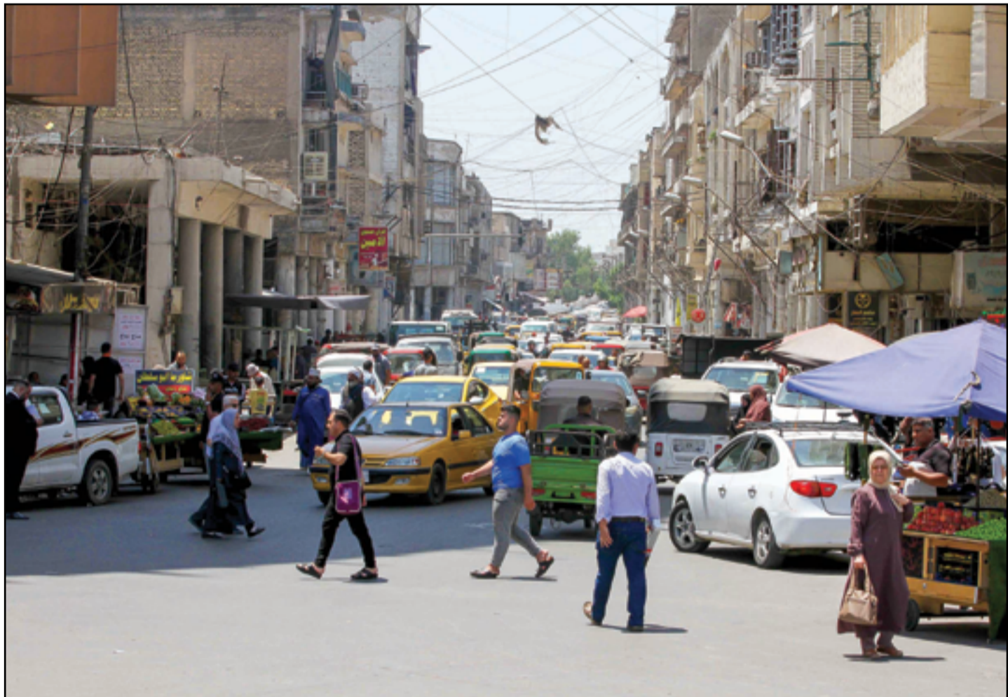
الازدحامات تخنق شوارع بغداد