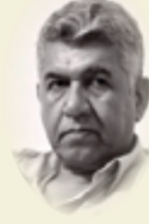
طالب عبد العزيز

في التاسع عشر من كانون الثاني 2009 وبمسالة الفندق بالرياض وضمن وفد ثقافي-فني-بصري يزور السعودية كنت قد اكتفيت بتعريف الشاعر زهير الدجيلي لأعضاء الوفد، بأنه صاحب كلمات أغنية (الطيور الطائرة) التي غناها سعدون جابر، ولحنها كوكب حمزة، ومع أنه (الدجيلي) لم ير في ذلك تعريفاً جزئياً به، كيف لا؟ وهو الشاعر الغنائي، والصحفي، والسيناريست، والإعلامي، وصاحب موقع الجبران، والمناضل الشيوعي الذي أمضى شطراً من حياته متغرباً، والحق أقول: كنت على دراية ببعض قليل مما له، لكنني، كنت أرى بأنه لو لم يكن إلا (الطيور الطائرة) لكفته مؤنة التعريف به، فالأغنية كانت تعويذة العراقيين أجمعهم قبل سقوط النظام السابق.