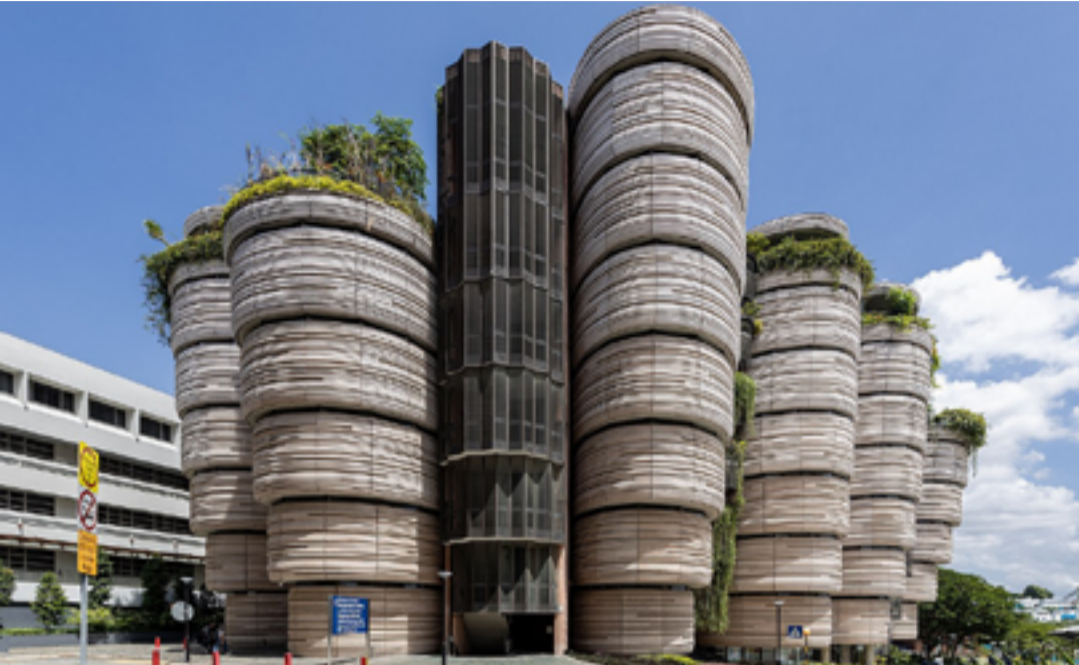
مجمع الجامعة التكنولوجية في سنغافوره (2011)

والصمم «توماس هيدرويك»، مولود في لندن في 17 شباط 1970. وبعد ان انهي تعليمه الفني في «الكلية الفنية الملكية، بلندن Royal College of Art (RCA) سنة 1994. عمل في عدة مكاتب استشارية مرموقة في بريطانيا قبل ان يؤسس مكتبه الاستشاري باسم «استديو هيدرويك، Heatherwick Studio» وهو يقوده الآن ويعمل معه فريق تصميمي يتألف من حوالي 250 معمار ومصمم ومنتج مبدع. يتعاطف المكتب مع مجموعة واسعة من مجالات التصميم، بدءاً من العمارة، والهندسة، والنقل، والخطط الحضري إلى اعمال الاثاث والنحت وتصميم المنتجات. وفي اعتقاد «هيدرويك»، فان التنوع العريض من المهارات التي يتعامل المكتب معها، هي مواجهة ورد فعل «الاستديو» على «غيتوات» فنية معزولة، تسعى إلى فصل النحت عن العمارة وعن الإزياء وعن الاعمال المعدنية وعن تصميم الاثاث، وتعاطف معها كاجناس فنية منفصلة. صمم المكتب عدة تصاميم في انحاء مختلفة بالعالم، وحاز على جوائز و اوسمة تقديرية متنوعة من دول ومنظمات عديدة عن اعماله المميزة. ولعل مجرد ذكر بعض نماذج من اعماله قد تعطي للمتلقي وسع وفرشة «مروحة» التصاميم المختلفة التي يتعاطف معها المكتب؛ فهو المصمم لجناح الملكة المتحدة المشهور في معرض شنغاي بالصين (2010)، كما انه مصمم «الجسر المتدرج او الدوار» The Rolling Bridge في لندن سنة 2005. وكذلك «متحف زايتز للفنون المعاصرة» في كاب تاون، بجنوب افريقيا 2011. ويعود لمكتبه فكرة إعادة تصميم «الباص اللندني الكلاسيكي ذي الطابقين» (2010) بحلته الجديدة وبمزاياه من حيث الاقتصاد بالطاقة وزيادة السرعة. وهو مصمم أيضاً «الميدان الباسيفيكي» Place Pacific (2005) في هونغ كونغ، و الجامعة التكنولوجية في سنغافوره (2011) Tec. University in Singapore؛ وكذلك نصب «الوعاء» (او