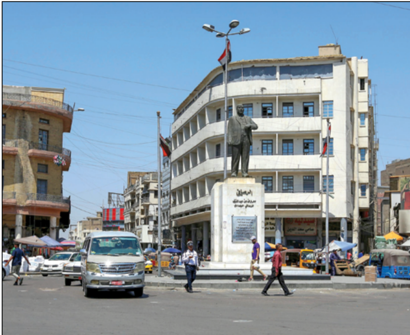
ساحة الرصافي وسط بغداد .. عدسة: محمود رؤوف