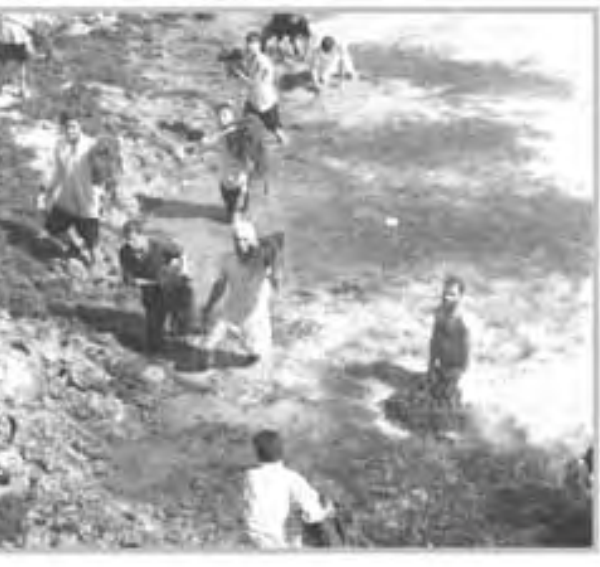
ميسان / المدى